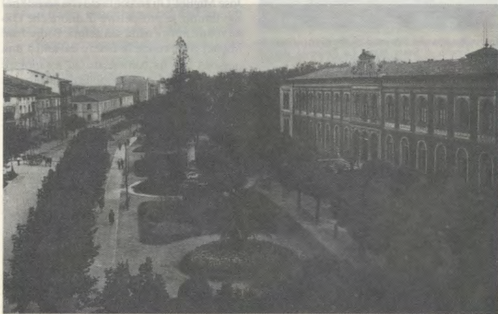
Istituto scolastico di Logroño, dove il Servo di Dio studiò negli ultimi anni della scuola secondaria.

Nel frattempo il Servo di Dio continua a chiedere luce per conoscere la Volontà di Dio — Domine, ut videam! , Signore, che veda! —, e a ripetere una invocazione fiduciosa, perché si realizzi quello che il Signore desidera: Domine, ut sit! , Signore, che sia! che si compia quello che Tu vuoi. Così tra-