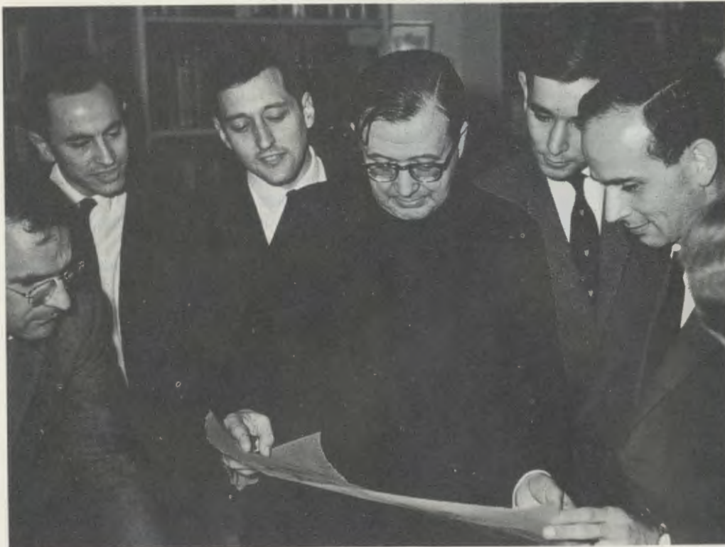
Londra, agosto 1961. Il Servo di Dio con un gruppo di suoi figli, quando si preparava il progetto per i nuovi edifici di Netherhall.

tà e di affetto reciproco permette di superare qualunque differenza di razza, di mentalità o di cultura.