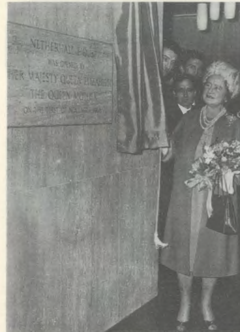
Durante l'inaugurazione dei nuovi edifici di Netherhall, alla presenza della Regina Madre.

zazione della Chiesa in Paesi lontani, un servizio come quello che si proponeva di offrire in questa Residenza universitaria.