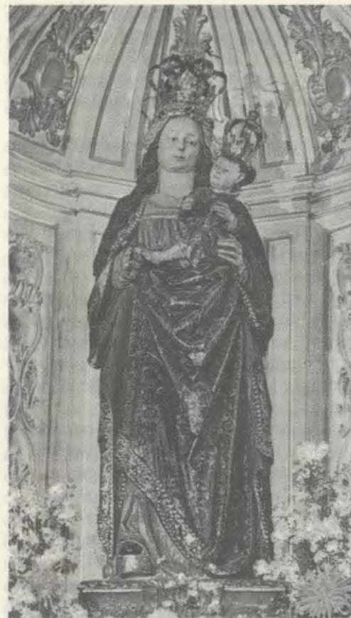
Immagine di nostra Signora degli Angeli che si trova in una cappella di Santa Maria La Redonda, dove il Servo di Dio andava spesso a pregare.

La domanda di questo ragazzo è un invito a fare alcuni passi indietro nella storia. Siamo nel periodo di Natale del 1917. Uno spesso strato di neve copre completamente il paesaggio di Logroño, capoluogo della Rioja spagnola. Un freddo intensissimo ha avvolto la città fino a raggiungere i sedici gradi sotto zero, la temperatura più bassa che Logroño abbia mai conosciuto. Alberi, strade e gronde sembrano opera dalla fantasia di un gigantesco scultore. Il fiume è