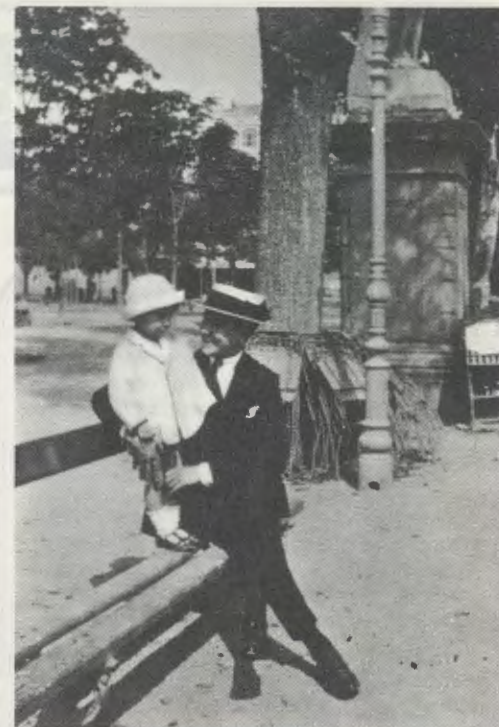
Logroño, maggio 1921. Il Servo di Dio, all'età di diciannove anni, col fratello Santiago.

Comincia un periodo di sacrifici e di gioia: una tappa di crescita nell'Amore a Dio, di generosità, di lotta ascetica.