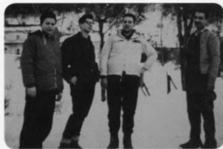
Foto di gruppo a Pacqua. L'atmosfera è culturalmente densa, di scambio, di attenzione all'altro. Multiculturalità non è una parola di questo secolo