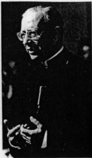
Monsignor Escrivá durante una riunione a Buenos Aires nel 1974.

Monsignor Alvaro del Portillo, Prelato dell'Opus Dei. La finalità della Prelatura è di risvegliare in tutti gli ambienti della società una presa di coscienza della chiamata universale alla santità nell'esercizio del lavoro professionale ordinario.