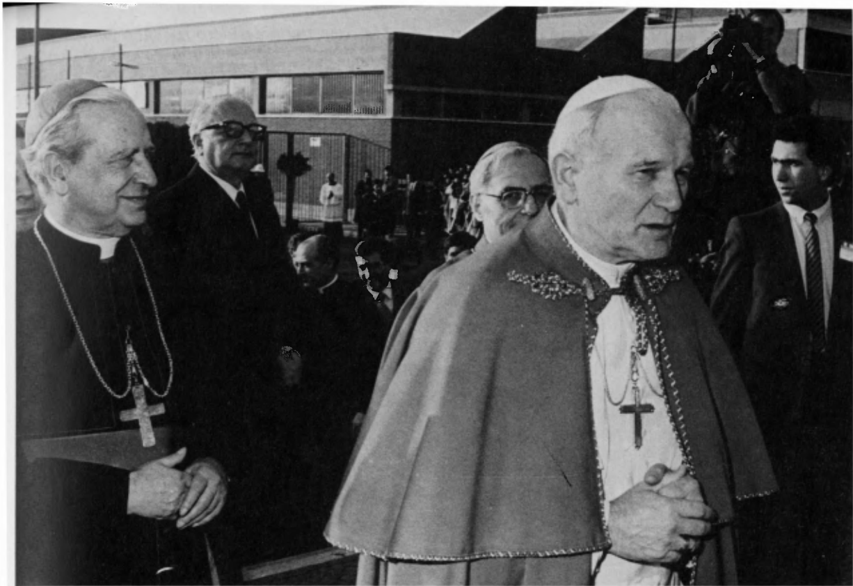
Il Papa, appena arrivato, è atteso in chiesa da mille giovanissimi. È accompagnato da mons. Alvaro del Portillo, Prelato dell'Opus Dei.

membri della Prelatura dirige l'azione pastorale della parrocchia.