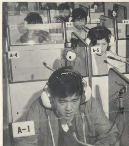
Trabajo en el laboratorio de idiomas de SEIDO.

«Dios Nuestro Señor te ha dado, con el Bautismo, el sentido de la Iglesia. Reza por los de tu tierra, porque es un