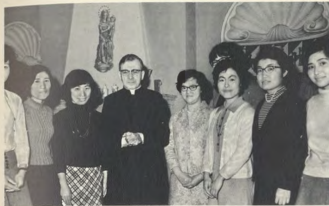
Roma, marzo de 1970. Mons. Escrivá de Balaguer con un grupo de japonesas del Opus Dei.

pueblo muy grande, para que conozcan a Jesucristo, y le amen, y le sirvan. Ya sabéis que ahora tus hermanas de Japón están preparando un colegio en Nagasaki. Hay que rezar para que las dificultades desaparezcan, para que puedan comenzar cuanto antes a trabajar allí...».