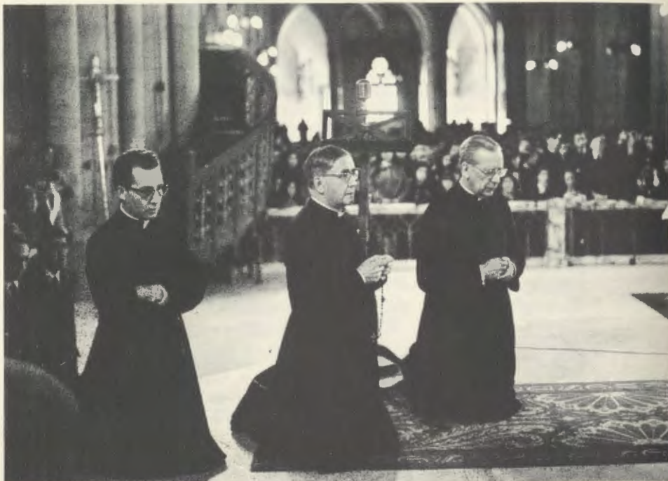
Mons. Escrivá de Balaguer rezando en el Santuario de Nuestra Señora de Luján (Argentina), el 12 de junio de 1974. A su lado, el actual Presidente General del Opus Dei, Revmo. Don Alvaro del Portillo, y Don Javier Echevarría, Secretario General de la Obra.

Sin embargo, no es raro escuchar la pregunta de algunos: ¿cómo hacer oración? El Fundador del Opus Dei nos contesta, en una homilía pronunciada el 4 de abril de 1955: