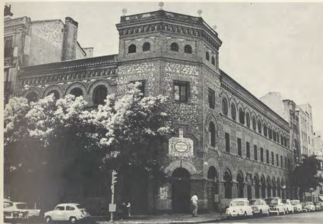
Madrid. Patronato de enfermos.

«Fue un gran beneficio para nosotros tener por Capellán del Patronato