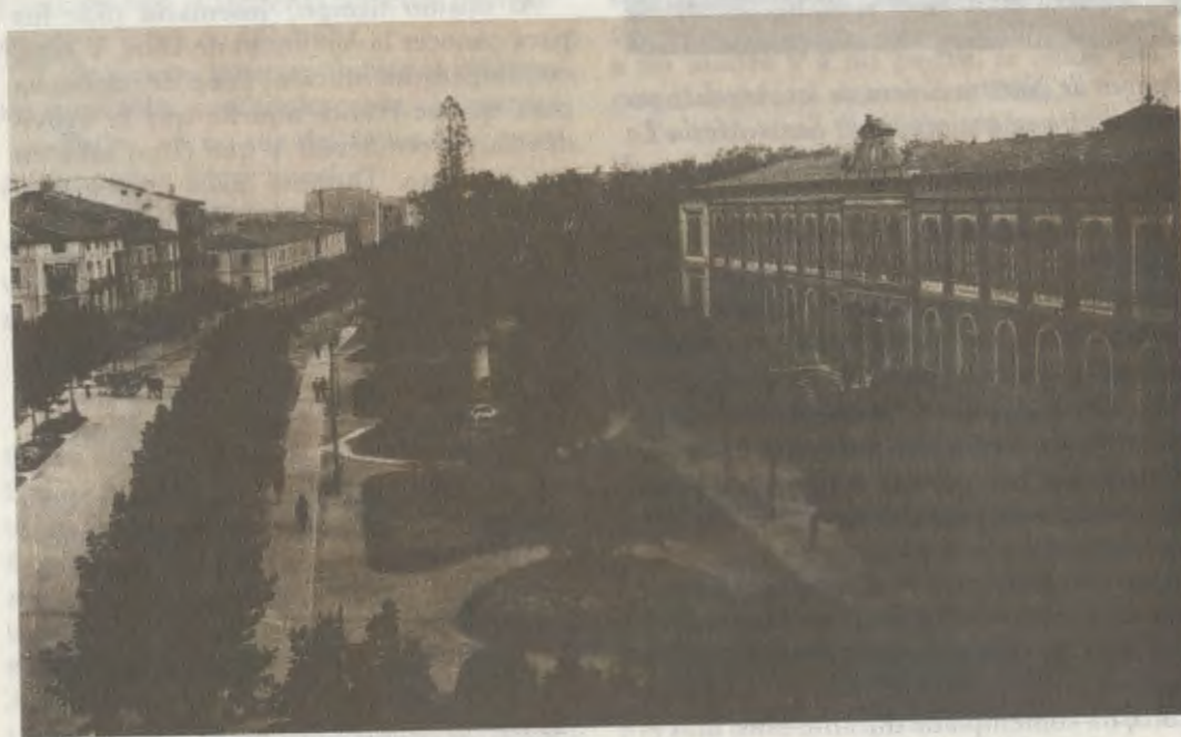
Instituto de Enseñanza Media de Logroño, donde el Siervo de Dios estudió los últimos cursos de Bachillerato.