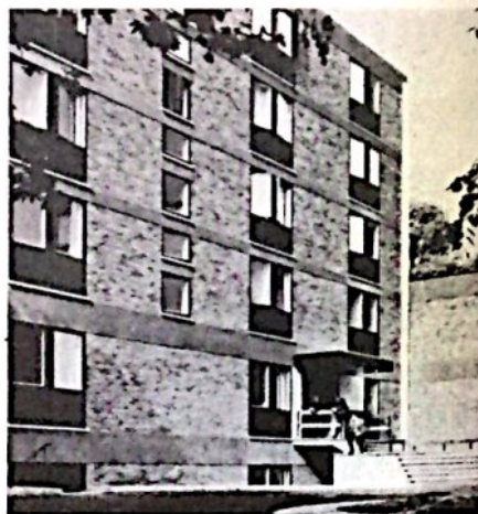
Una vista de Netherhall House.

Netherhall House es una Residencia para universitarios que realizan sus estudios en la Universidad de Londres y en otros Centros de enseñanza superior de la capital británica. Se inauguró en abril de 1952 gracias al impulso de Mons. Escrivá, que desde el principio de la labor apostólica del Opus Dei en el Reino Unido animó a sus hijos a instalar esta Residencia internacional, como medio para contribuir a la formación humana y espiritual de los universitarios. Siempre consideró a Londres como una encrucijada del mundo , donde se encontraban millares de estudiantes de todos los continentes. Y su amor a las