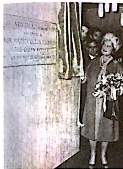
Durante la inauguración de los nuevos edificios de Netherhall por la Reina Madre.

almas le hacía comprender el gran bien que supondría, para la acción evangelizadora de la Iglesia en países lejanos, un servicio como el que se proponía ofrecer en esta Residencia universitaria.