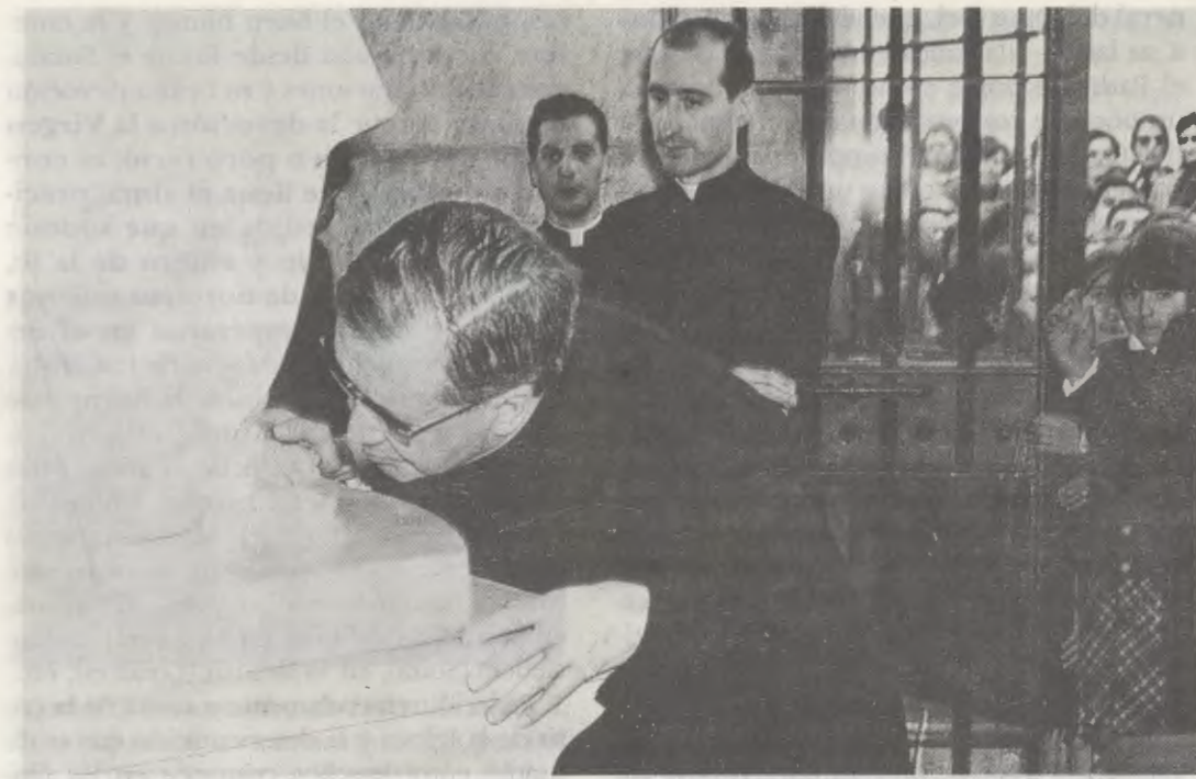
El Siervo de Dios besa los pies de la imagen de Santa María, Madre del Amor Hermoso, en la ermita del campus de la Universidad de Navarra, el día 23 de abril de 1967.

Bajo el amparo de la Virgen puso el Opus Dei y sus apostolados; y de Ella pudo decir, al referirse al 14 de febrero de 1930, fecha en que fundó la Sección de mujeres: Vosotras no habéis tenido fundadora: vuestra Fundadora ha sido la Santísima Virgen (5). La existencia de Mons. Escrivá se agotó en servicio de Dios y de la Iglesia, de la mano de Santa María; por eso, años más tarde, echando la vista atrás, exclamaba: Nunca pensé que sacar la Obra adelante llevaría consigo tanta pena, tanto dolor físico y moral: sobre todo, moral (...) Iter para tutum!