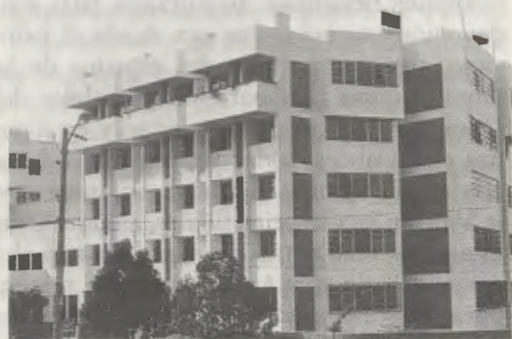
Sede del IFES.

En febrero de 1975, pocos meses antes de su muerte, Monseñor Escrivá de Balaguer estuvo unos días en Guatemala, al final de su tercer recorrido de catequisis por América. Como los anteriores, el viaje fue una siembra abundante de doctrina: movido por su deseo de servir cada vez más generosamente a la Iglesia, el Siervo de Dios impulsó a sus hijas e hijos a un apostolado amplio y fecundo, dirigido a iluminar cristianamente la sociedad entera. En aquellas jornadas, lleno de esperanza, bendijo unos terrenos situados al sur de la capital guatemalteca, sobre los que iban a iniciarse las obras de la nueva sede del IFES, Instituto Femenino de Estudios