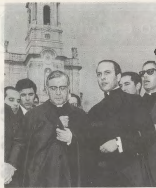
Fátima, 2 de noviembre de 1972. El Siervo de Dios, rodeado de varios miembros del Opus Dei, reza el Santo Rosario en la explanada del Santuario.

No admitimos más ambición que la de servir a tu Hijo y, por El y con tu ayuda, a todas las almas. Ahora sí que te digo con el corazón encendido: monstra te esse Matrem! Y no me contestes Tú: monstra te esse filium!; pues, aunque tengo conciencia de mi poquedad, yo no sé qué más puedo hacer. Si puedo algo más, ¡dilo, dilo!, y lo cumpliré con tu ayuda, porque solo no soy capaz (...). ¡Ruega por nosotros, los pecadores!, que eso somos. Pero también sabemos