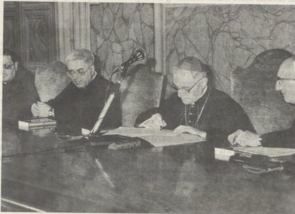
El Cardenal Poletti, Vicario del Papa para la diócesis de Roma, firma las actas de la sesión de clausura del Proceso, como Presidente del Tribunal. Roma, 8 de noviembre de 1986.

Han pasado más de seis años desde que el Vicario de Roma, Cardenal Ugo Poletti, promulgó el Decreto de Introducción de la Causa para la Beatificación y Canonización, el 19 de febrero de 1981. Durante este tiempo, los jueces eclesiásticos han escuchado y recogido las declaraciones de los testigos, en un total de trescientas setenta y cuatro sesiones. El 26 de junio de 1984 concluyó un trabajo paralelo ante el tribunal de la Archidiócesis de Madrid, que escuchó a un gran número de testigos en lengua castellana. También en Madrid concluyeron dos Procesos sobre curaciones de carácter extraordinario, atribuidas a la intercesión de Mons. Escrivá: la desaparición instantánea de una enfermedad tumoral y la curación de un linfoma maligno.