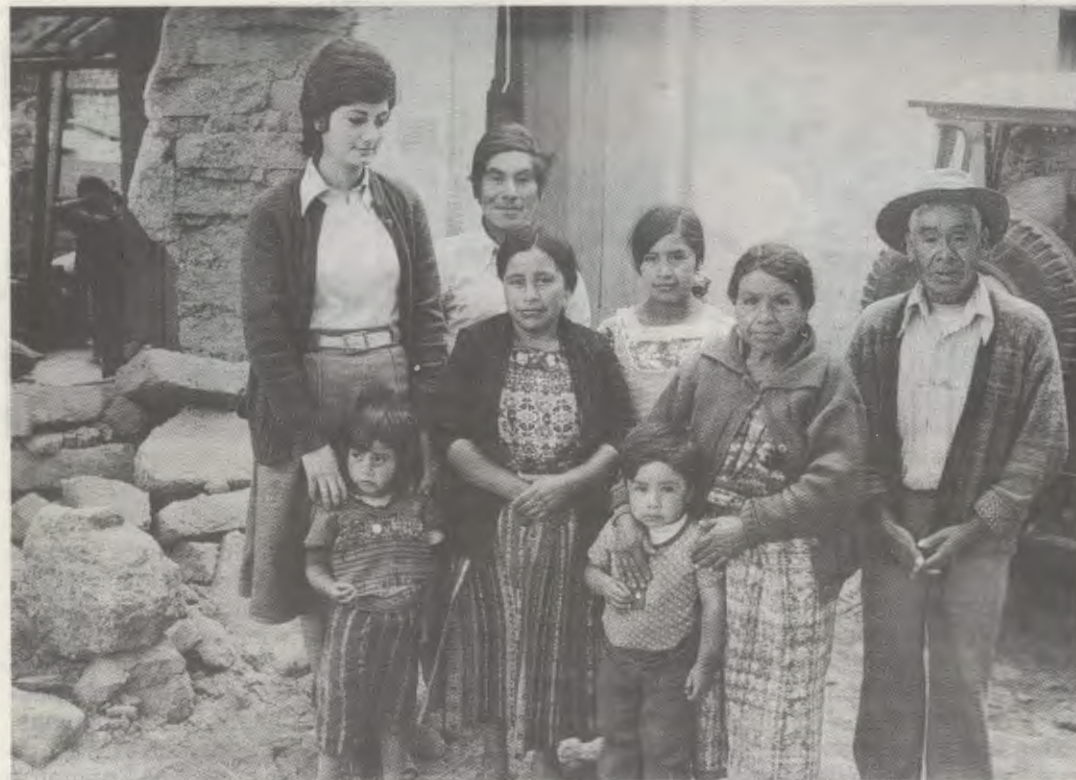
La labor del IFES llega a un gran número de aldeas de Guatemala.

Superiores. La sede anterior, inaugurada en 1964, se había quedado pequeña ante el incremento del número de alumnas y la puesta en marcha de nuevas iniciativas.