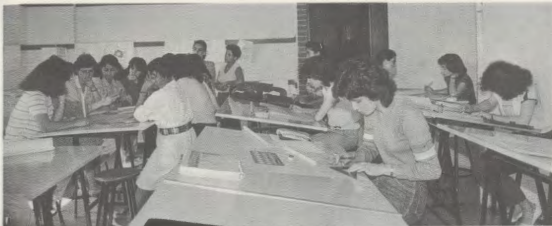
Un grupo de alumnas en el aula de proyectos.

Además, el Centro imparte programas educativos más amplios y cursos a distancia de administración del hogar, de cultura general, de aplicación técnica a la vida doméstica (arquitectura, medicina, psicología, dietética, economía, etc.) también a nivel universitario; y organiza cursos de extensión cultural en diversas ciudades y pueblos del país, extendiendo así su influjo en todo Guatemala. Aparte de sus actividades docentes, el IFES se ocupa de asesorar a otras muchas entidades que, en los demás países de Centroamérica, ofrecen programas similares de educación de la mujer.