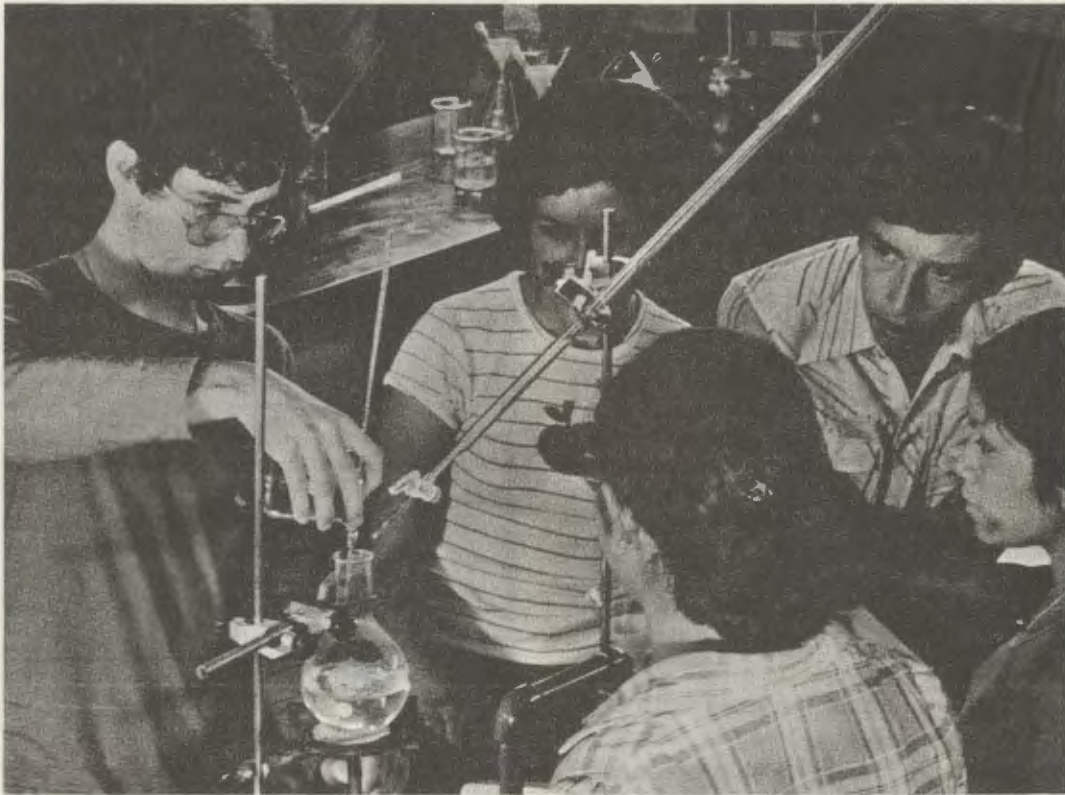
En el laboratorio de química.

Sólo el 13 por 100 de los estudiantes paga la matrícula completa. Otro pequeño porcentaje obtiene matrícula reducida. Y la mayor parte reciben enseñanza gratuita, en atención a su precaria condición económica. La Universidad busca, por tanto, el apoyo en la generosidad de muchas personas, a la que se suma el trabajo que los talleres de Ingeniería ofrecen a las empresas.