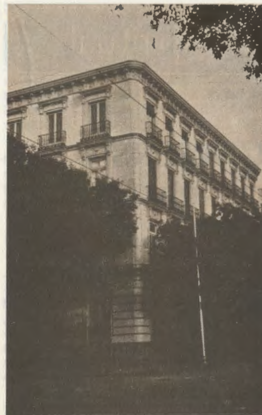
En este edificio de la calle Ferraz, núm. 50 (Madrid), a partir de octubre de 1934, la Residencia DYA ocupó dos pisos en la penúltima planta; la Academia estaba en otro piso de la última planta.