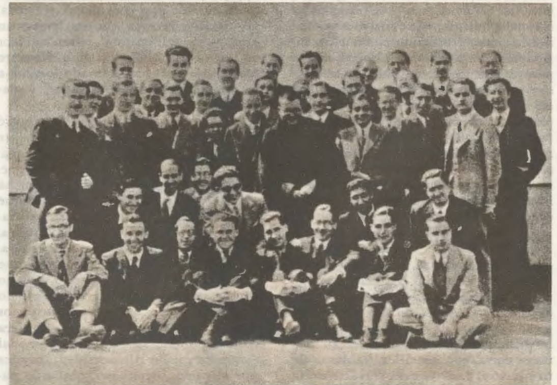
El Siervo de Dios con algunos estudiantes de DYA.