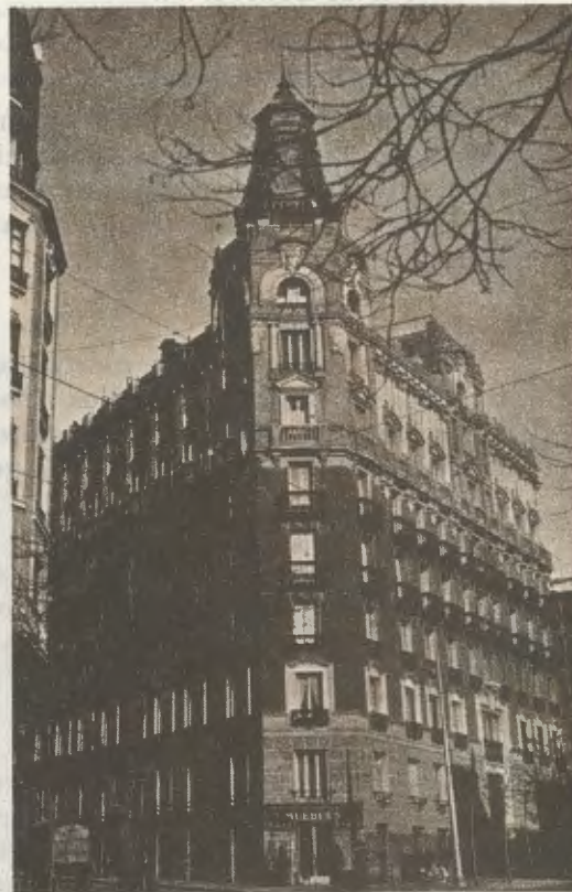
En el entresuelo de este edificio de Madrid, en la calle Luchana, tuvo su sede la Academia DYA, desde finales de 1933 hasta comienzos del curso 1934-35.

Uno de sus apostolados preferentes en aquellos años era el apostolado con estudiantes universitarios, porque habiendo de llegar a todas las capas de la sociedad, como era la precisa Voluntad divina, se dio cuenta de que con jóvenes universitarios podría realizar antes ese programa. Charlaba con ellos por las calles de Madrid o los reunía en tertulias en el hogar de su madre. Cuando se ausentaban de la ciudad, en época de vacaciones, continuaba esa tarea por correspondencia. He aquí, por ejemplo, unas líneas de una carta dirigida a uno de aquellos muchachos: Ten absoluta confianza con Jesús. Háblale, como lo que es, como un Amigo entrañable. Cuéntale tus cosas y nuestras cosas. Pásanos revista a todos: a los viejos y a los nuevos... y a todos los que han de venir, hasta el fin de los siglos. Persuádetes de que te oye, porque es verdad. Llénate de fe. De fe y de Amor. Invoca a la Señora y a San José, nuestro Padre y Señor. Ten siempre camaradería afectuosa con tu Angel Custodio. Todo esto es devoción recia y sólida. Si alguna vez (o muchas veces) estás seco y árido, ante el Sagrario, sin saber qué decirle a Jesús..., hazle la guardia: persevera como de costumbre, sin quitar un minuto: fiel, como un perrillo a los pies de su amo (1).