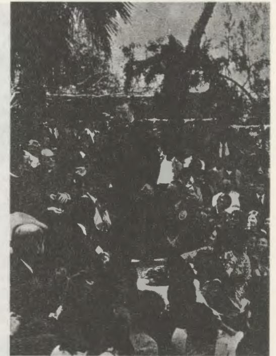
El Siervo de Dios en Larboleda, cerca de Lima, el 29-VII-74: en la tertulia participaron varios profesores y alumnos de la Universidad de Piura.

Son palabras significativas del constante aliento que el Fundador infundió en esa empresa universitaria. Sobre esa guía se ha construido un proyecto educativo que responde a las exigencias de la región y en particular a la demanda de profesionales bien preparados. Los más de mil quinientos estudiantes de la Universidad se reparten, por ahora, entre las Facultades de Artes Liberales, Ciencias de la Ingeniería, Ingeniería Industrial, Ciencias de la Información y Administración de Empresas. Aparte de los normales cursos académicos, la Universidad ha creado un Servicio de Extensión Cultural que desarrolla programas para profesionales de la zona, en diversos ra-