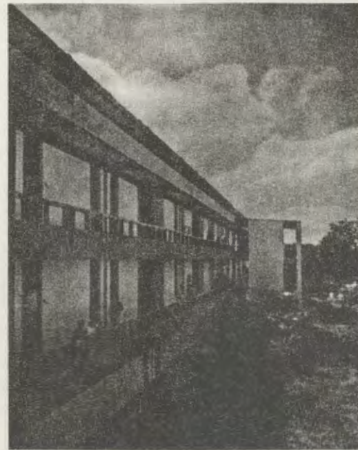
Un edificio de la Universidad.

En un arenal que alimenta sólo algarrobos, nació en 1968 la Universidad de Piura, fruto de la convergencia de un doble empeño: de una parte, la iniciativa