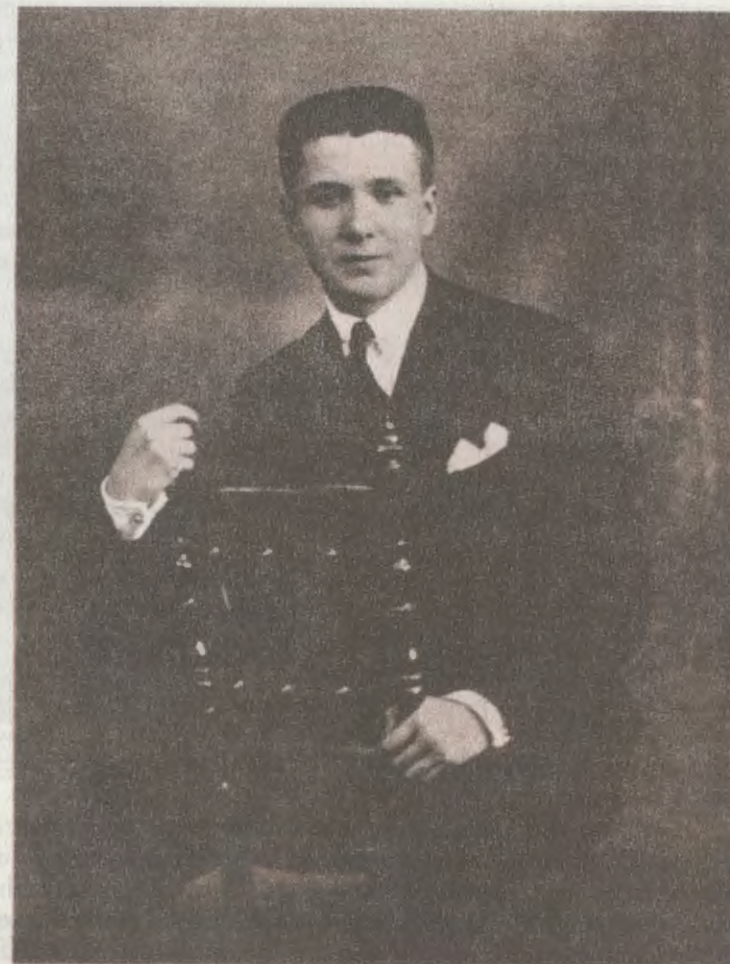
Josemaría a los 19 años.

En 1946 el Siervo de Dios se trasladó a Roma, donde fijó definitivamente su residencia. En 1947 obtuvo de la Santa Sede el decretum laudis para el Opus Dei que, el 16 de junio de 1950, recibió la aprobación definitiva como institución de derecho pontificio. Simultáneamente fue aprobada la Asociación de Cooperadores del Opus Dei, en la que podían ser admitidos también los acatólicos.