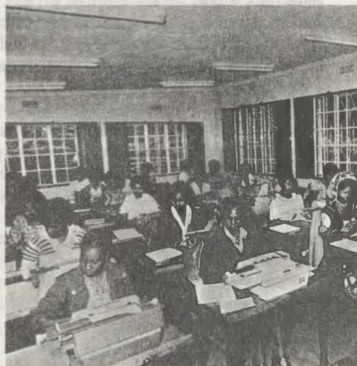
Clase de mecanografía en Kianda College.

Así respondía Mons. Escrivá de Balaguer, en 1966, a las preguntas de un periodista. Y el desarrollo de la Obra en países de los cinco continentes es la mejor demostración de la exactitud de esas palabras.