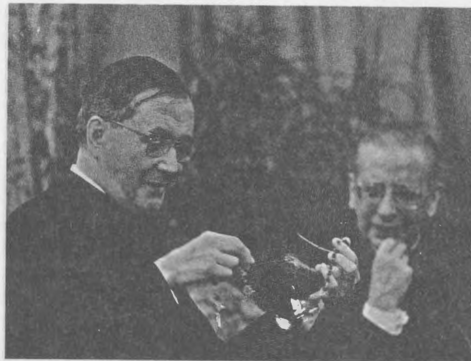
Con don Álvaro del Portillo, en Lima (Perú), el 25 de julio de 1974.

En la base de la espiritualidad del Siervo de Dios se halla una profunda percepción del misterio de Jesús, perfecto Dios y perfecto hombre, que se manifiesta en el entrelazamiento de lo divino y lo humano, en unidad de vida . En su vida personal demostró esta íntima fusión de contemplación y acción, de vida interior y actividad cotidiana. Las virtudes sobrenaturales se unían con las virtudes humanas, haciendo de él el ejemplo de una santidad entretejida de sencillez y naturalidad, construida de fidelidad en las cosas pequeñas. Vivía profundamente el sentido de la filiación divina, que se traducía en un confiado abandono en Dios Padre, en la primacía de la