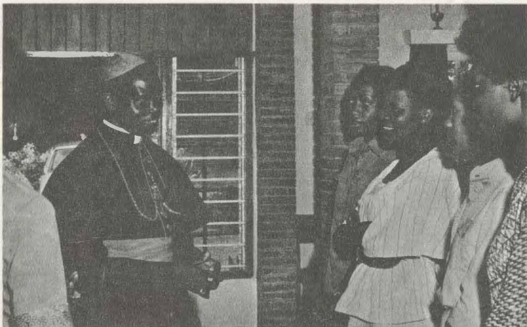
El Cardenal Maurice Otunga, Arzobispo de Nairobi, en Kianda College.

había ya alumnas de los tres países del África Oriental, y a partir de 1967, de muchos otros del Continente africano: Nigeria, Etiopía, Zambia, Ghana, Lesotho... En ese mismo año, se abrió una Residencia para cien chicas, y en un ala del nuevo edificio comenzó Kibondeni School, una Escuela hotelera. En 1973, también bajo el impulso directo de Mons. Escrivá de Balaguer, que no llegó a verlo hecho realidad, se pusieron las bases de Kianda High School, un colegio de enseñanza media que actualmente tiene 350 alumnas. Desde el principio, esta iniciativa contó con el apoyo entusiasta de las tres mil antiguas alumnas de Kianda, deseosas de que sus hijas se educaran en el mismo ambiente que habían conocido ellas.