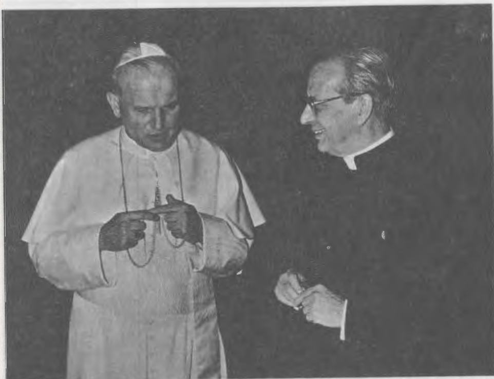
El 5 de febrero de 1981, Su Santidad el Papa Juan Pablo II ratificó el Nihil obstat de la Sagrada Congregación para las Causas de los Santos, a la introducción de la Causa de Beatificación y Canonización del Siervo de Dios Josemaría Escrivá de Balaguer.

Romano Pontífice y la lealtad a la Jerarquía son inconfundibles características suyas.