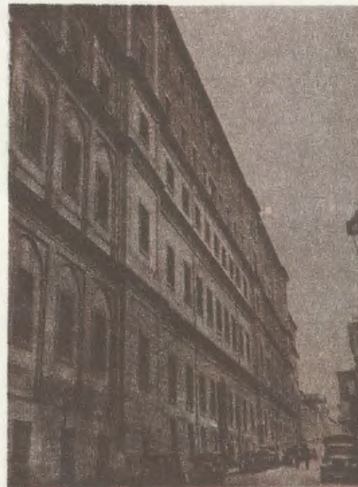
Fachada del antiguo Hospital General de Madrid, en los años treinta. Se divisa al fondo la iglesia del Patronato de Santa Isabel, del que fue Rector el Siervo de Dios.

Se enteró don Josemaría del estado en que se encontraba el Hospital General. Era un inmenso edificio situado en la misma calle de la iglesia de Santa Isabel. El Siervo de Dios, que había consumido muchas jornadas en la atención de enfermos desamparados, vio enseguida la posibilidad de prestar alguna ayuda también a los de este Hospital, y consideró además que ese servicio sería un gran medio de formación para los muchachos que le rodeaban. Aspiraba a que las almas de todos los que estaban a su alrededor profundizaran en las verdades fundamentales de la fe. No quería que se quedasen en una afirmación teórica de los valores cristianos, sino que entendieran el sentido sobrenatural de la vida real, concreta, con sus dolores y con sus alegrías. Por propia y larga experiencia, sabía cuánto ayuda a descubrir la realidad profunda de cada cosa o acontecimiento el contacto con la enfermedad y con el dolor: este contacto con el sufrimiento abre paso en el alma al olvido de sí misma, a percibir con fuerza la grandeza de los ideales cristianos, y estimula a la entrega generosa a los demás.