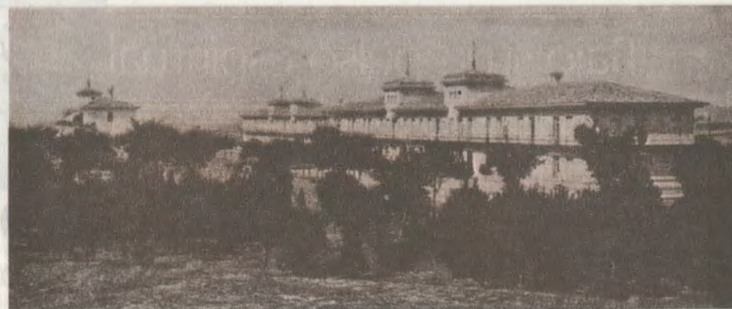
Hospital del Rey (Madrid), después de su inauguración en 1925.

También frecuentó el Hospital del Rey, que en aquellos años de la segunda República española se llamaba Hospital Nacional. Era posiblemente el hospital más moderno de Madrid, y se dedicaba a enfermos infecciosos. Abundaban las personas aquejadas de tuberculosis, que por entonces era una enfermedad que no tenía remedio. Una Hija de la Caridad guarda en su memoria la imagen de Mons. Escrivá de Balaguer: «Todavía recuerdo con claridad cuando don Josemaría nos hablaba de Dios, aprovechando cualquier cosa (...), y a los enfermos les decía lo mismo (...). Recuerdo a enfermas jóvenes, tuberculosas, que recuperaban incluso la alegría hu-