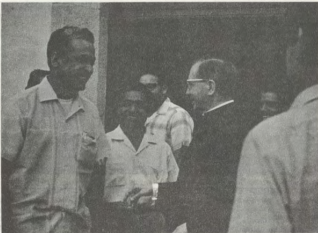
4 de junio de 1970. Mons. Escrivá de Balaguer en el Centro Agropecuario El Peñón.

juveniles, una amplia tarea de extensión cultural y de formación cristiana que alcanza a quince pueblos del valle de Amilpas.