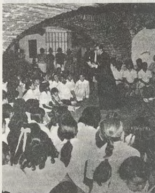
Mons. Escrivá de Balaguer, en junio de 1970, mientras habla a un grupo de campesinas de la Granja Escuela de Montefalco.

Después de recorrer un centenar de kilómetros por carretera asfaltada des-