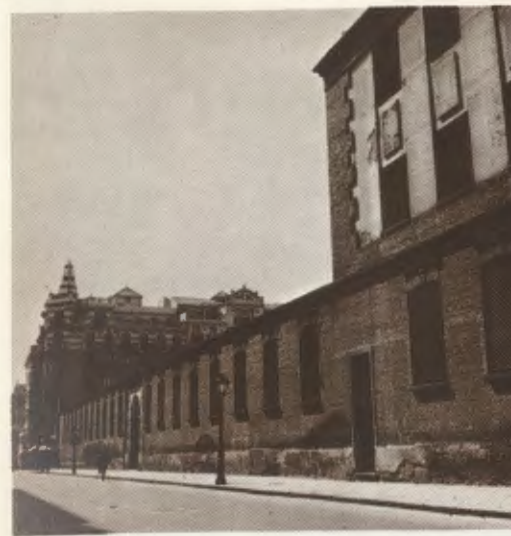
Asilo de Porta Coeli. Aquí, a comienzo de los años treinta, el Siervo de Dios desarrolló parte de su inmensa labor de Catequesis.

Hacia marzo de 1932 quedó suprimida la enseñanza de la Religión en todos los centros docentes estatales de España. En