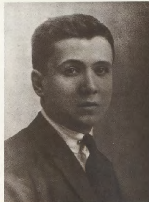
El Siervo de Dios, a los quince años.

Con la gracia de Dios en su alma, los cristianos pueden convertirse en sembradores de paz y de alegría (18) entre los hombres. El apostolado, ese deber que todos tenemos de llevar a otros al encuentro con Cristo, tiene así en el sacramento de la Penitencia la garantía segura de eficacia y un objetivo bien preciso. En efecto, una de las grandes obras que el cristiano puede hacer en favor de un amigo es ayudarlo a acercarse a la Confesión sacramental, donde experimentamos la alegría de ser perdonados por Dios.