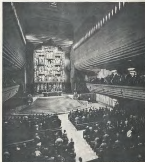
Interior del Santuario de Torreciudad.

La ciudad de Barbastro (España) ha quedado atrás. La carretera recorre la orilla derecha del río Cinca; penetra en el Somontano y el paisaje se vuelve agreste. Más allá de la presa de El Grado se convierte el Cinca en lago cerrado por recios canchales que el agua no puede cubrir. En su orilla izquierda, sobre un peñasco, se encuentra la vieja ermita y, cerca, un torreón de señales medio derruido. Más elevado, el nuevo Santuario con los edificios en los que se realiza la labor espiritual con la que soñó el Fundador del Opus Dei. Al fondo se recorta en un limpio cielo azul la impresionante mole del Pirineo aragonés.