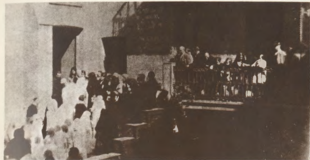
En esta foto de la época (1929), se ve al Siervo de Dios —en el dintel de la puerta, a la izquierda— un día de Primeras Comuniones, en el Patronato de Enfermos.

Así, bajo el impulso del Padre, se fueron