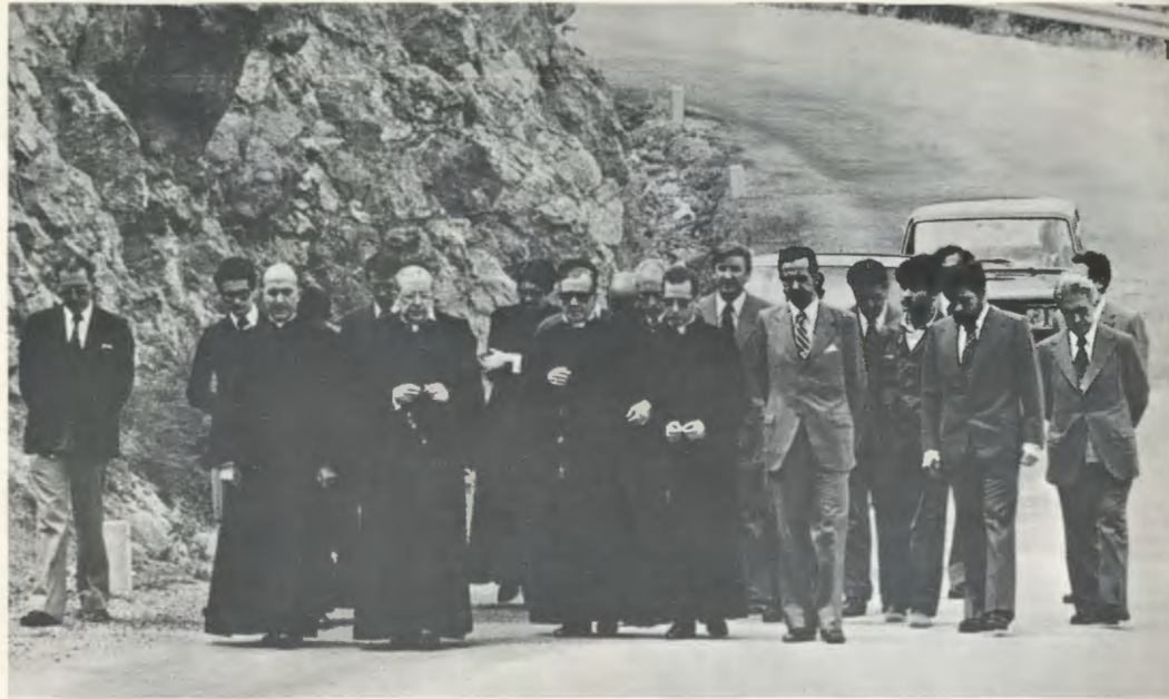
El Siervo de Dios reza el Rosario, con un grupo de hijos suyos, camino de la ermita de Torreciudad, el día 24 de mayo de 1975.

ro. Se descalzó e hizo a pie este último recorrido. La carretera no estaba asfaltada todavía y la gravilla hería sus pies. El caminar era lento, en medio de un tiempo inclemente.