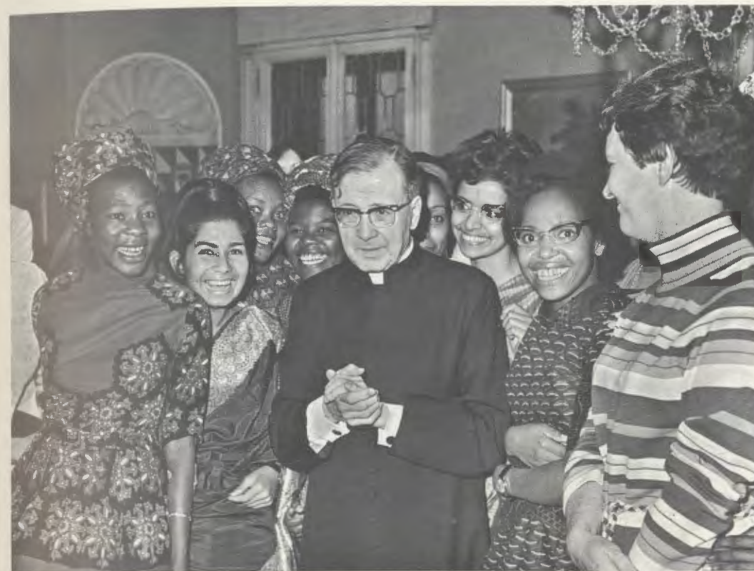
Roma, 10 de abril de 1971. Mons. Escrivá con un grupo de estudiantes, alumnas de Kianda.

En 1958, la labor del Opus Dei se extendió —bajo el impulso de su Fundador— al Extremo Oriente y a África. Dos años después, la Sección de mujeres de la Obra comenzaba su labor en Kenia. En mayo de 1960, las asociadas que marcharían a ese país, procedentes de diversas naciones de Europa y de América, se reunieron unos días en Roma, para recibir la bendición y el aliento espiritual del Siervo de Dios.