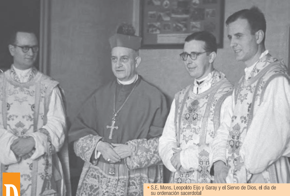
• S.E. Mons. Leopoldo Eijo y Garay y el Siervo de Dios, el día de su ordenación sacerdotal