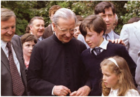
• El Siervo de Dios Mons. Javier Echevarría, Prelado de Opus Dei, con un grupo de familias en 1980.

apasionamientos, y cuyos corazones no sabían ya amar; se hace oír a sordos, que no deseaban saber de Dios; se logra que hablen los mudos, que tenían atenazada la lengua porque no querían confesar sus derrotas; se resucita a muertos, en los que el pecado había destruido la vida» (Josemaría Escrivá, Es Cristo que pasa , n. 131). Dispensador de los misterios divinos, el sacerdote fiel oye como resuena en lo más íntimo de la propia alma las palabras de Jesús: «Alegraos más bien porque vuestros nombres están escritos en los cielos» (Lc 10,20). Yo soy testigo de los prodigios obrados por Dios a través del ministerio de Mons. del Portillo. ¿Trazas de esta fecundidad sacerdotal? Antes que nada, el servicio a la Santa Sede, con incansable dedicación y siempre con una ejem-