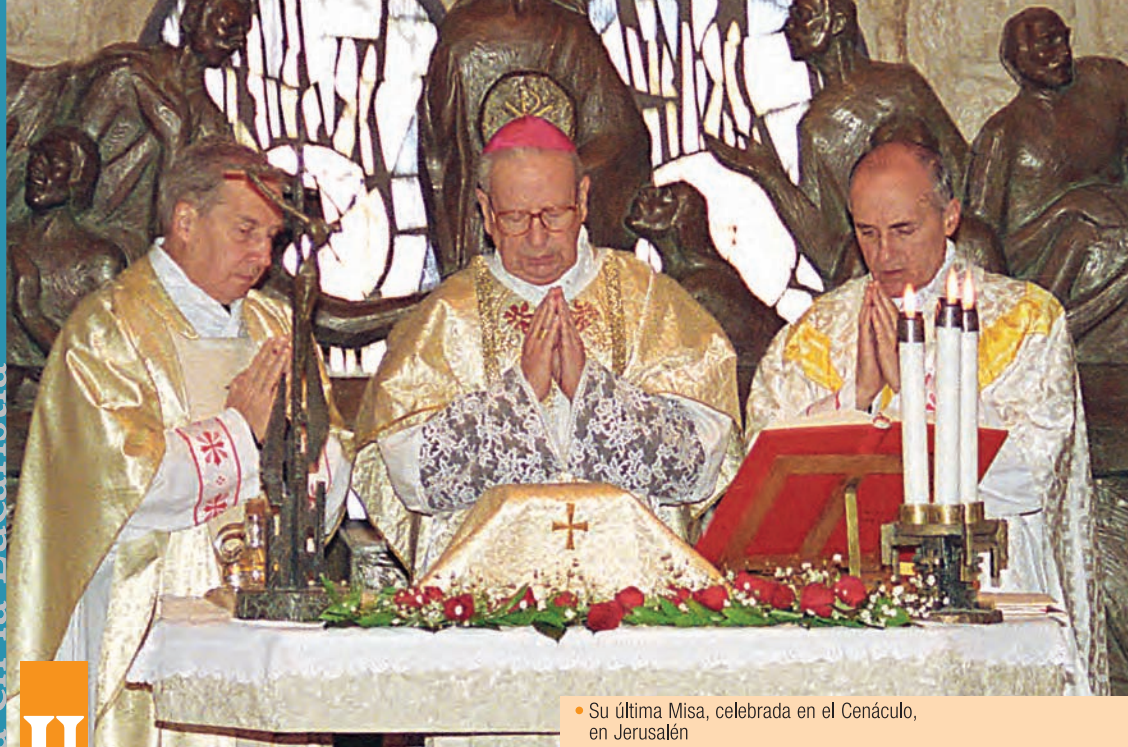
• Su última Misa, celebrada en el Cenáculo, en Jerusalén