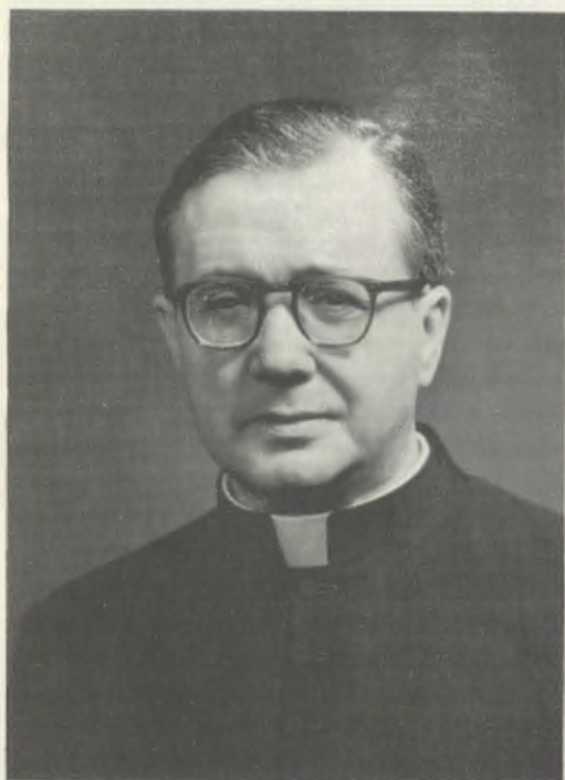
Monseñor José María Escrivá de Balaguer y Albás.

Comienzo hoy una tarea árdua, pero aleccionadora y estimulante, una auténtica aventura; el desfile de ex-alumnos brillantísimos de las Escuelas Pías.