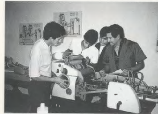
Durant una classe de tipografia.

Una part important de la història de Kinal és l'estada del Fundador de l'Opus Dei a Guatemala, el febrer de 1975. Foren pocs dies, però intensos, i plens d'una sembra apostòlica que des del primer moment va donar fruits abundants, multiplicats amb el pas dels anys. Kinal atén actualment més de cinc mil persones cada any, en els seus distints serveis, i promou com a objectiu central de la seva activitat la realització d'un treball ben fet i ple de sentit cristià. A part de la preparació tècnica completa, que implica