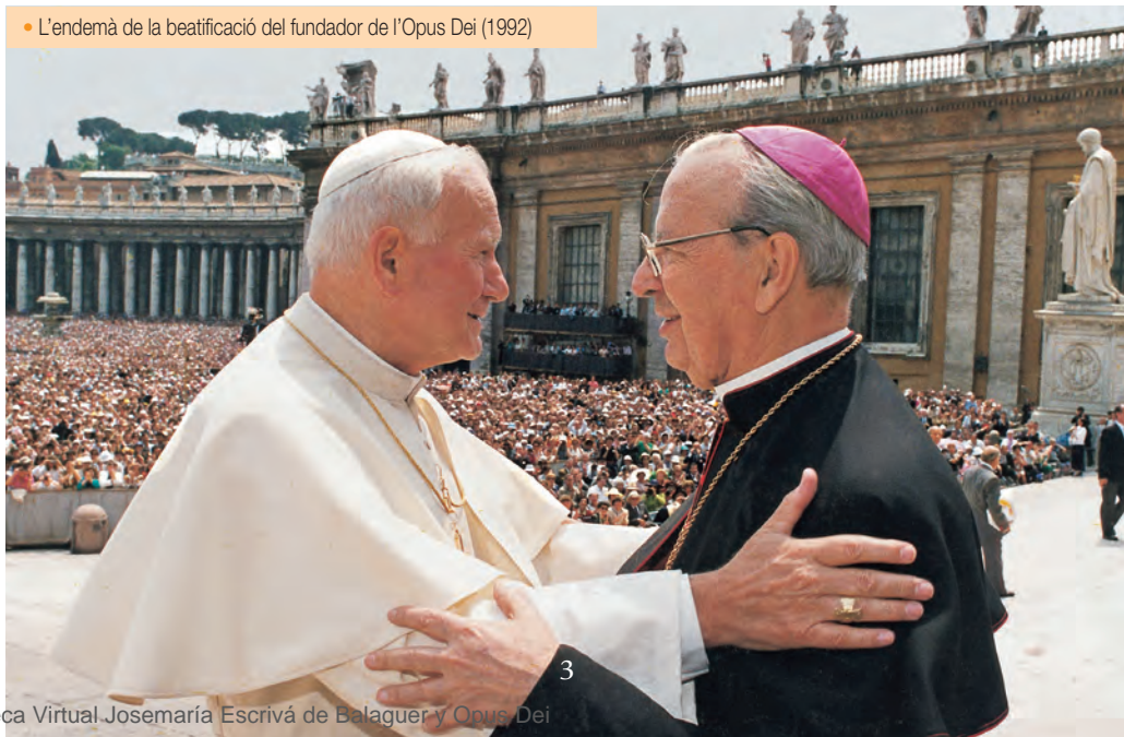
• L'endemà de la beatificació del fundador de l'Opus Dei (1992)

El Servent de Déu va ajudar molts cristians a viure la unió filial amb el Sant Pare mitjançant el seu exemple lluminós d'amor al Papa, que el va portar a gastar-se generosament per estendre el Regne de Crist - Regnare Christum volumus! : "volem que Crist regni!", era el seu lema episcopal, i amb la seva predicació incessant: «hem de ser molt romans, pel nostre amor al successor de Pere, que es manifesta en oració i mortificació per la seva persona i intencions, en la fidelitat als seus ensenyaments, i en l'obediència retuda a les seves indicacions». ▲