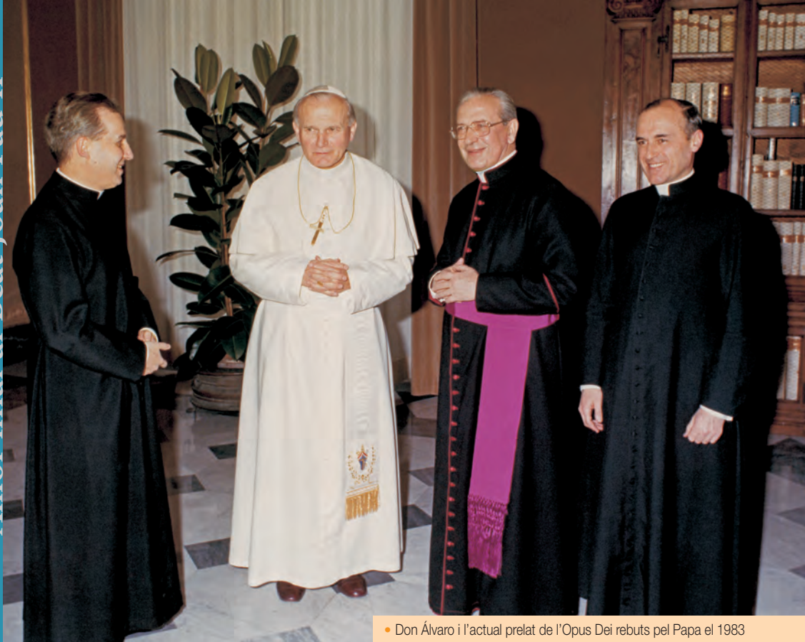
• Don Álvaro i l'actual prelat de l'Opus Dei rebuts pel Papa el 1983

tució apostòlica Ut sit , va erigir l'Opus Dei com a Prelatura personal i va nomenar Prelat Mons. Álvaro del Portillo. El 6 de gener de 1991, li va conferir l'ordenació episcopal a la Basílica de Sant Pere. No es tractava només d'un reconeixement cap a la seva persona, sinó d'una cosa molt congruent amb la peculiar missió que correspon al prelat de l'Opus Dei a l'Església.