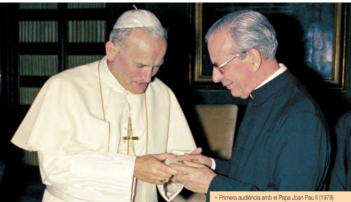
• Primera audiència amb el Papa Joan Pau II (1978)

“Crist. Maria. El Papa. No acabem d’indicar, en tres paraules, els amors que compendien tota la fe catòlica?”. Aquestes paraules de sant Josepmaria van influir profundament en Mons. Álvaro del Portillo des que va conèixer l’Opus Dei. L’amor filial i l’adhesió al Romà Pontífex -fos qui fos la persona que ocupés la Càtedra de Pere en cada moment- van marcar el seu afany de servir Déu al llarg de la seva vida.