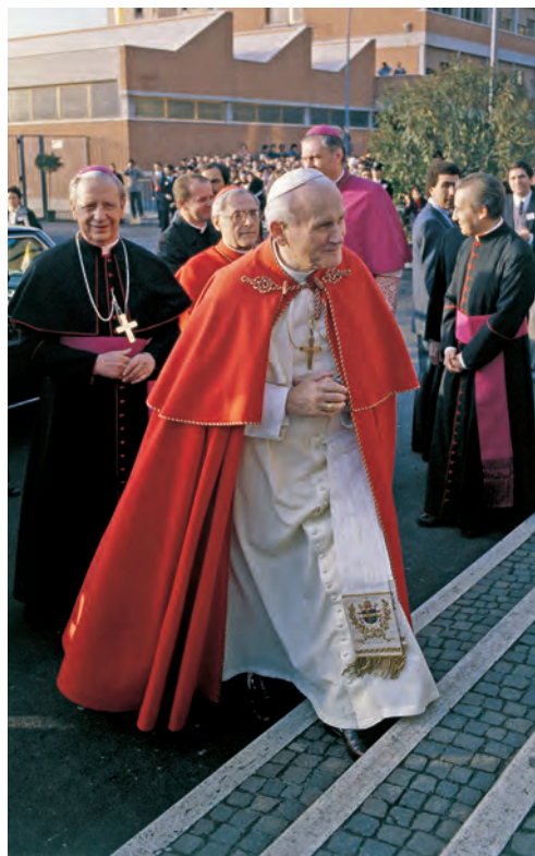
• Visita del Sant Pare al centre ELIS, Roma (1984)

Mons. Echevarría li va agrair en nom de l'Opus Dei aquesta prova de profunda benevolència. El Beat Joan Pau II va contestar, en italià, que el considerava un deure: " Si doveva, si doveva ", van ser les seves paraules. ▲