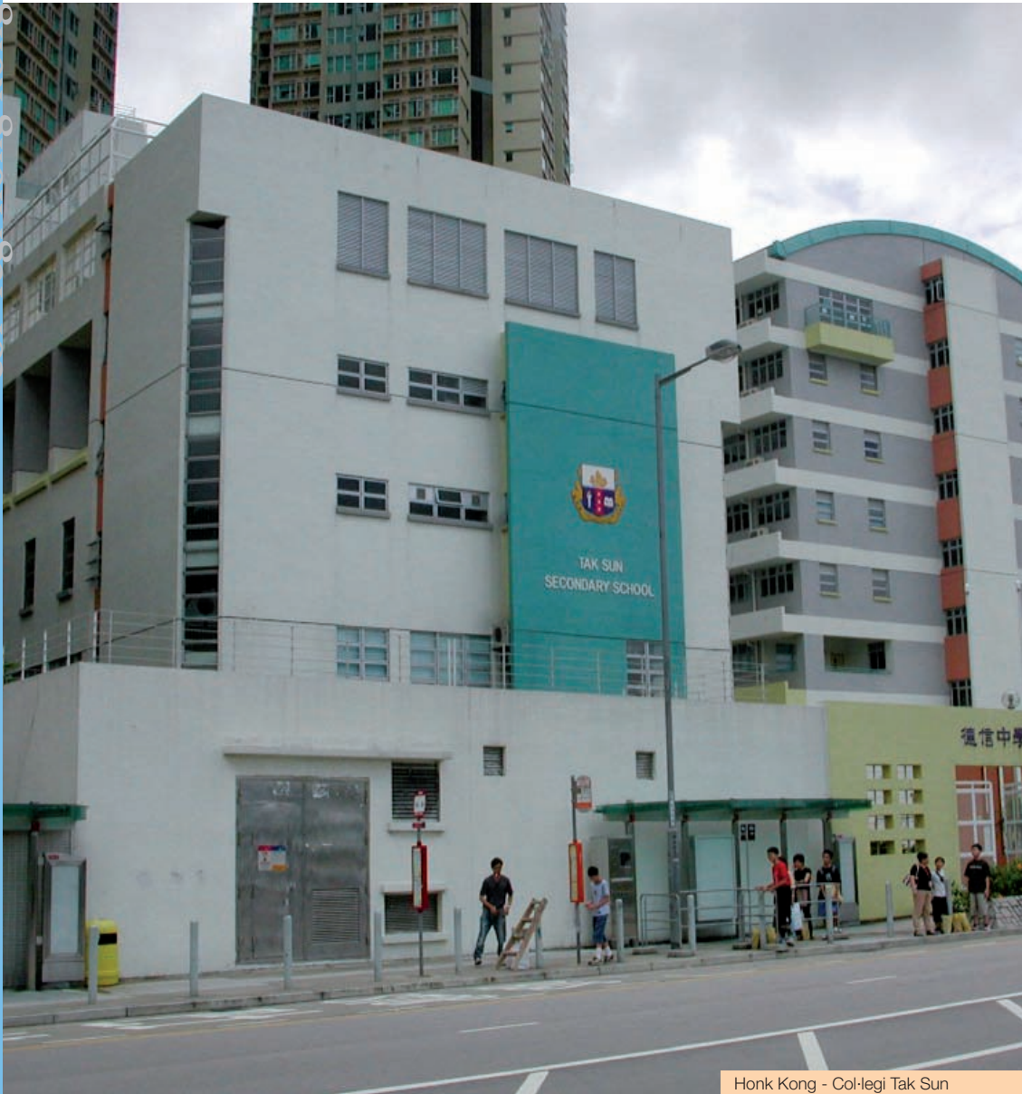
Honk Kong - Col·legi Tak Sun