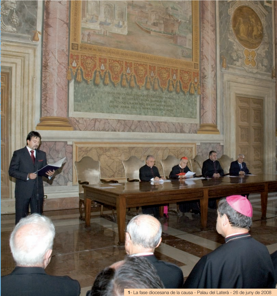
1- La fase diocesana de la causa - Palau del Laterà - 26 de juny de 2008