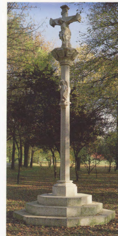
Crucero. Campus Universidad

Universidad de Navarra (Edificio Central) 31080 Pamplona. Teléfono (948) 252700. Télex: 37917 UNAV-E. Telefax: (948) 173650.