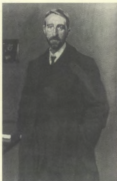
Manuel Bartolomé Cossío.

En el argumentario turístico que me encontré en 1958 al llegar a la Dirección General, que estaba en la calle del Duque de Medinacelli, brillaba como un sol refulgente el Spain is different que Vicente consideraba tan aislacionista y negativo, como falso y perjudicial para la imagen de nuestro país. Por aquello de "el que pregunta se queda de cuadra", dejamos por las buenas de utilizarlo sin que se levantara voz alguna reclamando. Empezaron a recibirse premios internacionales por los nuevos carteles que reproducían