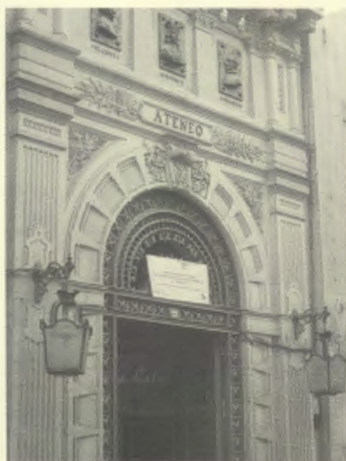
Ateneo de Madrid.