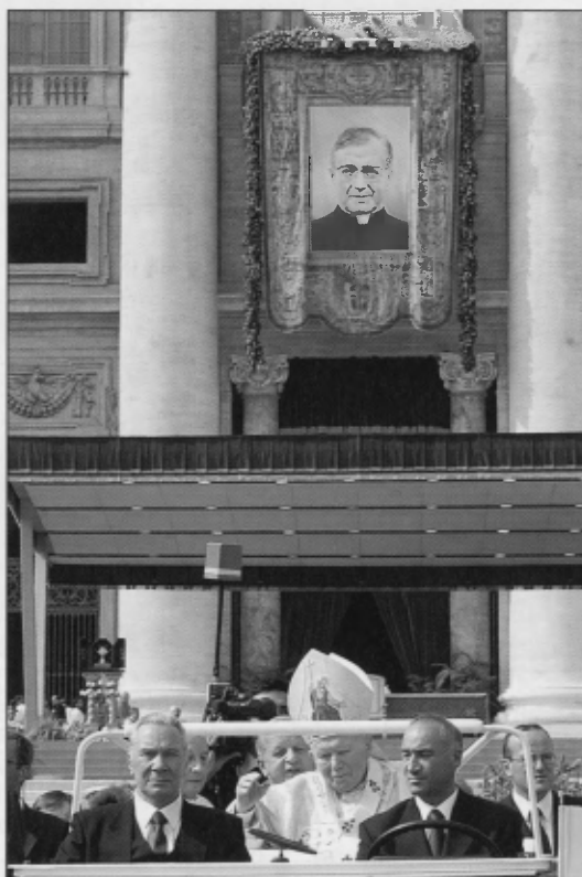
Juan Pablo II en el «papamóvil»; al fondo, el cuadro de San Josemaría Escrivá el día de su canonización.

2 «Tomó, pues, Yahveh Dios al hombre y lo dejó en el jardín de Edén, para que lo labrase y cuidase» (Gn 2, 15). El Libro del Génesis, como hemos escuchado en la primera Lectura, nos re-