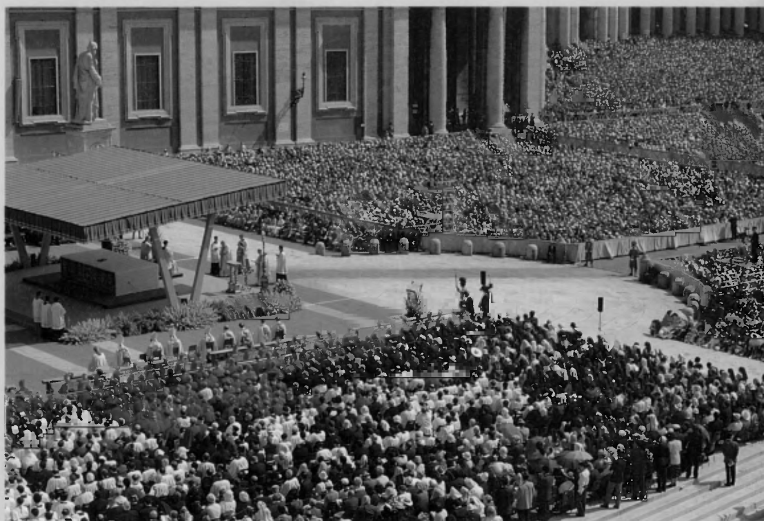
Vista general de la plaza en el momento de la beatificación.

Llegada a Venecia por los caminos misteriosos de la divina Providencia, Bakhita se abrió muy pronto a la gracia. El bautismo y, después de algunos años, la profesión religiosa entre las Hermanas Canosianas, que la habían acogido e instruido, fueron la consecuencia lógica del descubrimiento evangélico , para lo cual sacrificó todo, incluso el regreso, ya siendo libre, a su tierra natal. Como Magdalena de Canosa, ella también quería vivir sólo para Dios, y con constancia heroica emprendió humilde y confiadamente el camino de la fidelidad al amor