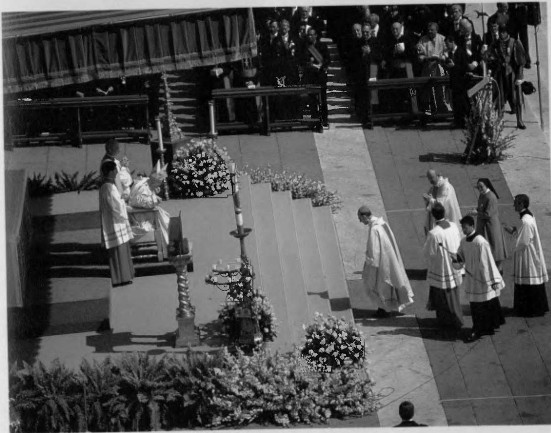
El Cardenal Ruini agradece al Santo Padre la beatificación.