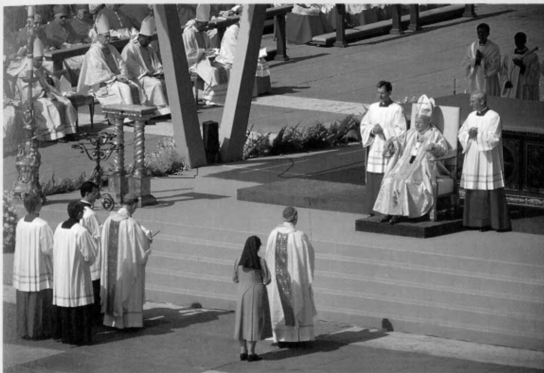
El Cardenal Camillo Ruini, junto con el Postulador, solicita que se proceda a la beatificación de Josemaría Escrivá de Balaguer.

si se usan rectamente para gloria del Creador y al servicio de los hermanos, pueden ser camino para el encuentro de los hombres con Cristo. Todas las cosas de la tierra –enseñaba– también las actividades terrenas y temporales de los hombres, han de ser llevadas a Dios (Carta, 19.III.1954).