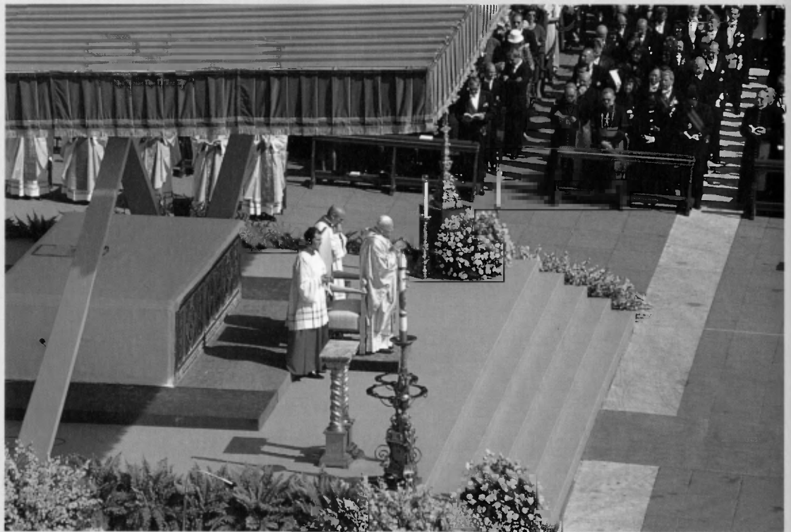
El Santo Padre va a dar comienzo al rito de la beatificación.

Con sobrenatural intuición, el Beato Josemaría predicó incansablemente la llamada universal a la santidad y al apostolado. Cristo convoca a todos a santificarse en la realidad de la vida cotidiana; por ello, el trabajo es también medio de santificación personal y de apostolado cuando se vive en unión con Jesucristo, pues el Hijo de Dios, al encarnarse, se ha unido en cierto modo a toda la realidad del hombre y a toda la creación (cfr. Dominum et Vivificantem , 50). En una sociedad en la que el afán desenfrenado de poseer cosas materiales las convierte en un ídolo y motivo de alejamiento de Dios, el nuevo Beato nos recuerda que estas mismas realidades, criaturas de Dios y del ingenio humano,