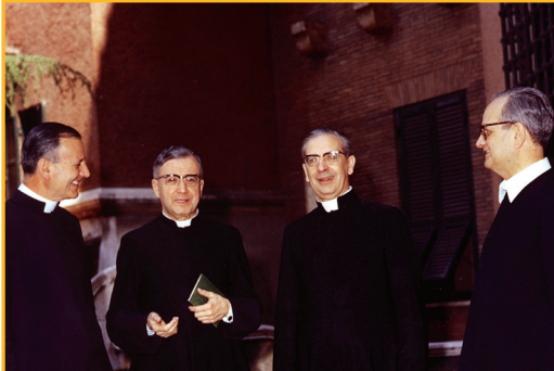
Los tres primeros sacerdotes del Opus Dei, el día del 25 aniversario de su ordenación, con San Josemaría.