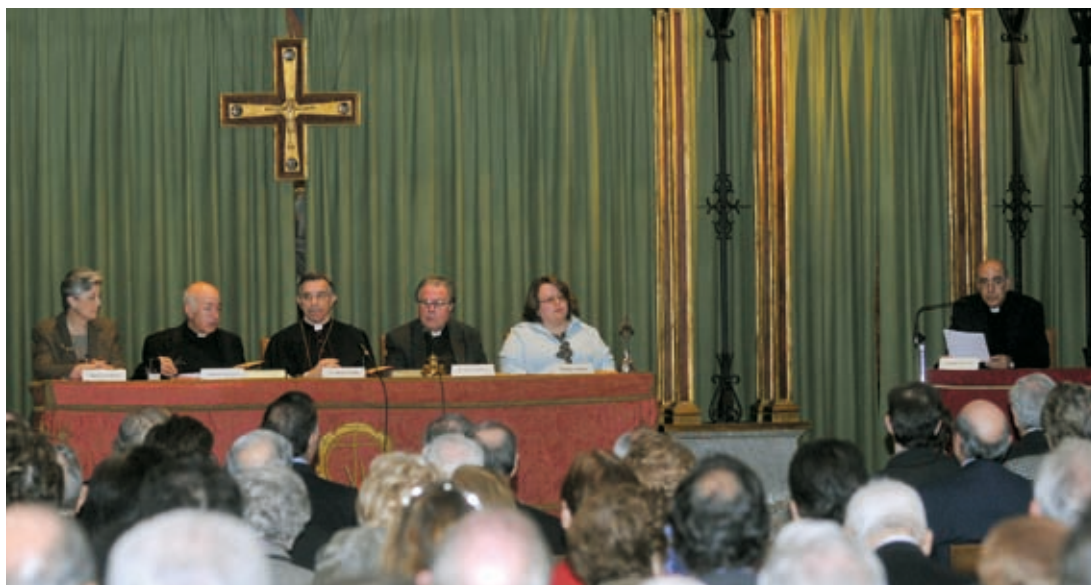
Sesión de clausura del proceso diocesano.