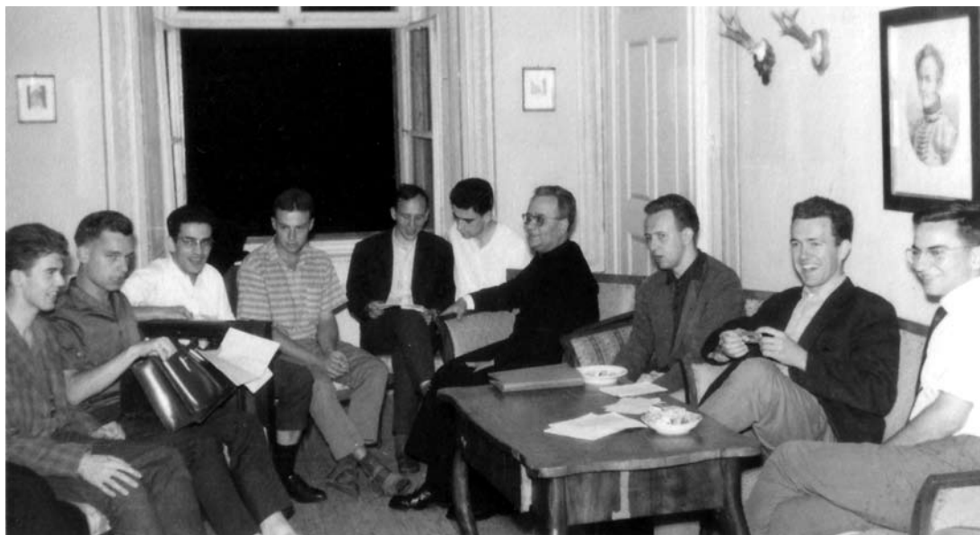
Durante un rato de tertulia en Austria (1963).