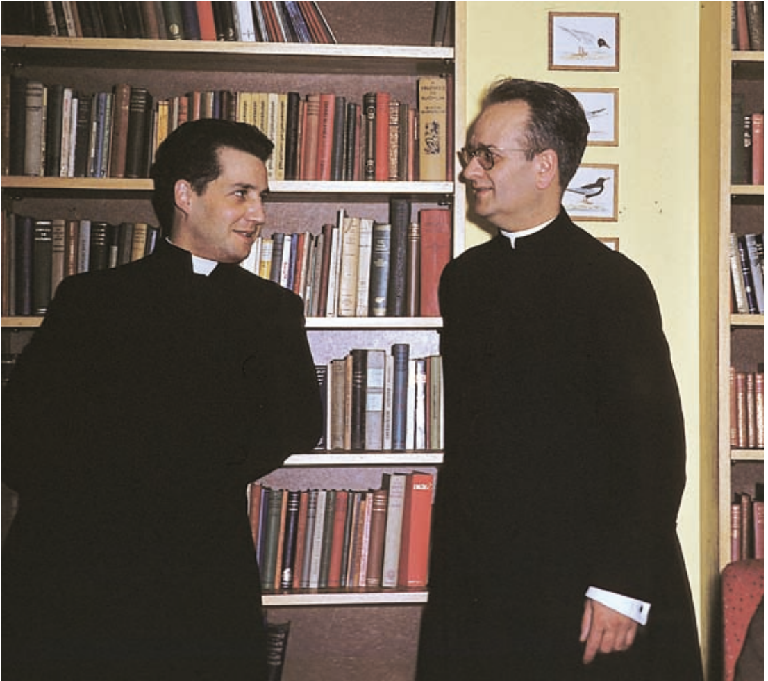
En Londres, con Mons. Javier Echevarría.

Toda su inteligencia y capacidad de trabajo la empleó en el cumplimiento de la voluntad de Dios, y fue con total disponibilidad de un lugar para otro, según se le necesitó, para difundir la llamada universal a la santidad y al apostolado, y llevó el espíritu del Opus Dei a muchos países.