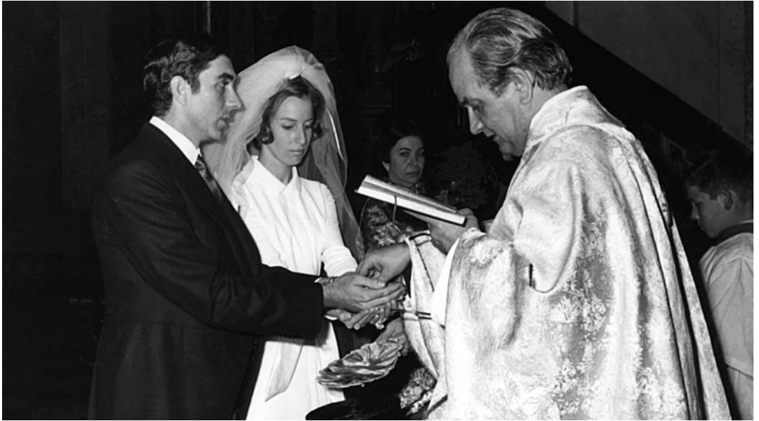
En la boda de unos parientes.