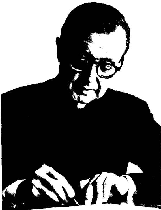
josémaría escrivá de balaguer

Llegan ya, en este año de 1970 salpicado de guerras y tragedias, las fiestas de la paz y de la familia. La Nochebuena se viene... y las ciudades y los pueblos de España se han vestido de luces navideñas. Parece como si renaciera por todas partes la alegría y la esperanza. Mucho se ha hablado en los últimos tiempos de la crisis de la familia. La Navidad es fecha propicia para meditar sobre este tema, cuya trascendencia a nadie escapa. En un gran artículo, José María Escrivá de Balaguer aborda los más varios aspectos de la vida familiar: el matrimonio, el amor, la relación entre los esposos, el sexo, la castidad, el hogar, la indisolubilidad conyugal, la natalidad, la educación, los deberes de los hijos para con los padres y de los padres para con los hijos... Monseñor Escrivá expone todas estas cuestiones con una extraordinaria claridad de fondo y de forma y con ese admirable sentido del equilibrio y la ponderación que preside todos sus escritos. El artículo que publicamos a continuación, como los anteriores del padre Escrivá aparecidos en estas columnas («Los domingos de ABC», 2-XI-69 y 22-III-70), hará sin duda un inmenso bien en infinidad de familias españolas, en los hombres y las mujeres de buena voluntad para quienes suenan alegres, un año más, las campanas de la Natividad del Señor.