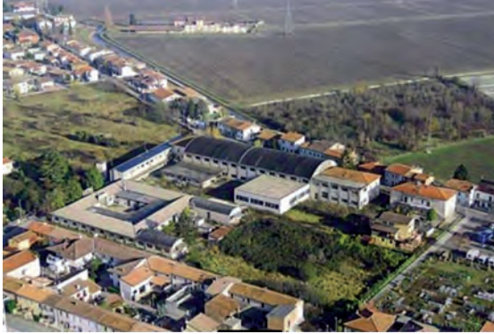
El Ricamificio Automático en los años 80 del siglo pasado.