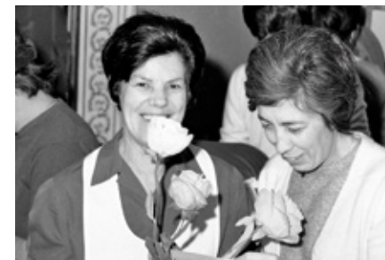
In Rom, 1970.