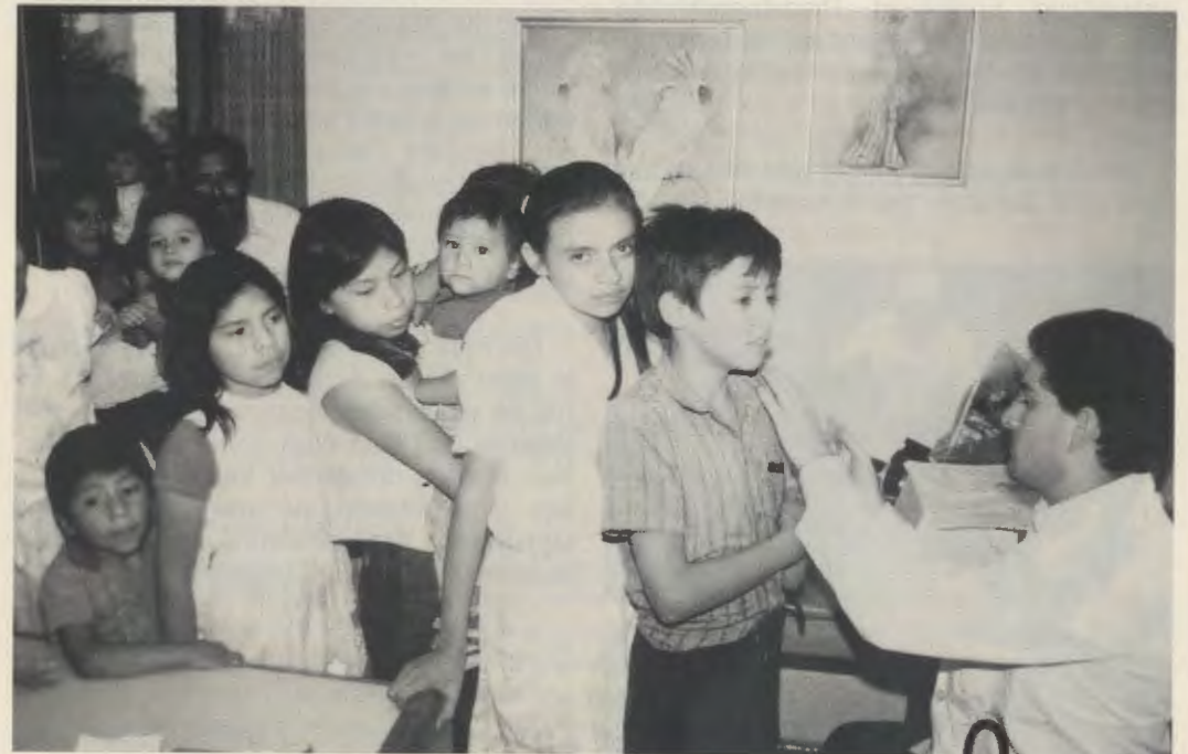
Beim Impftermin in der Ambulanzstation von Kinal.

Heute ist Kinal dank der großzügigen Hilfe vieler Personen aus allen Schichten mit