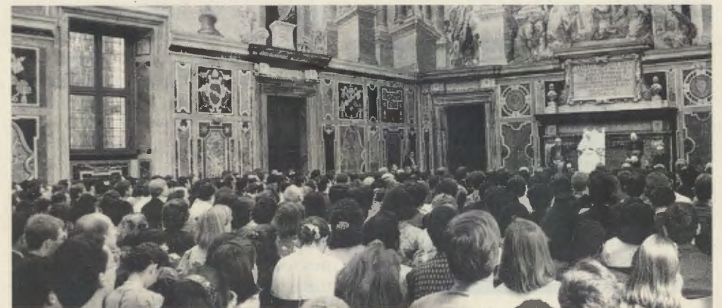
Der Heilige Vater Johannes Paul II. richtet bei der Audienz am 14. Oktober 1993 eine kurze Ansprache an die Teilnehmer der Theologischen Studientagung.

Am letzten Tag, dem 14. Oktober, wurden die 500 Kongreßteilnehmer von Papst Johannes Paul II. in Audienz empfangen. Die Ansprache des Heiligen Vaters ist nachfolgend dokumentiert.