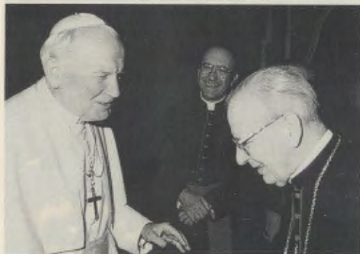
Der Prälats des Opus Dei, Bischof Alvaro del Portillo, begrüßt Papst Johannes Paul II. bei der Audienz in der »Sala Clementina«.

3. Die Kirche unserer Zeit erkennt, daß die Erlösung, in deren Dienst sie steht, alle Dimensionen der menschlichen Existenz umfaßt. Diese tiefe Überzeugung ist unter der Führung des Heiligen Geistes durch einen schrittweisen intellektuellen und spirituellen Prozeß vorbereitet worden. In dieser Richtung stellt die Botschaft des seligen Josemaria, der Ihr Euer Treffen gewidmet habt, einen der bedeutendsten charismati-