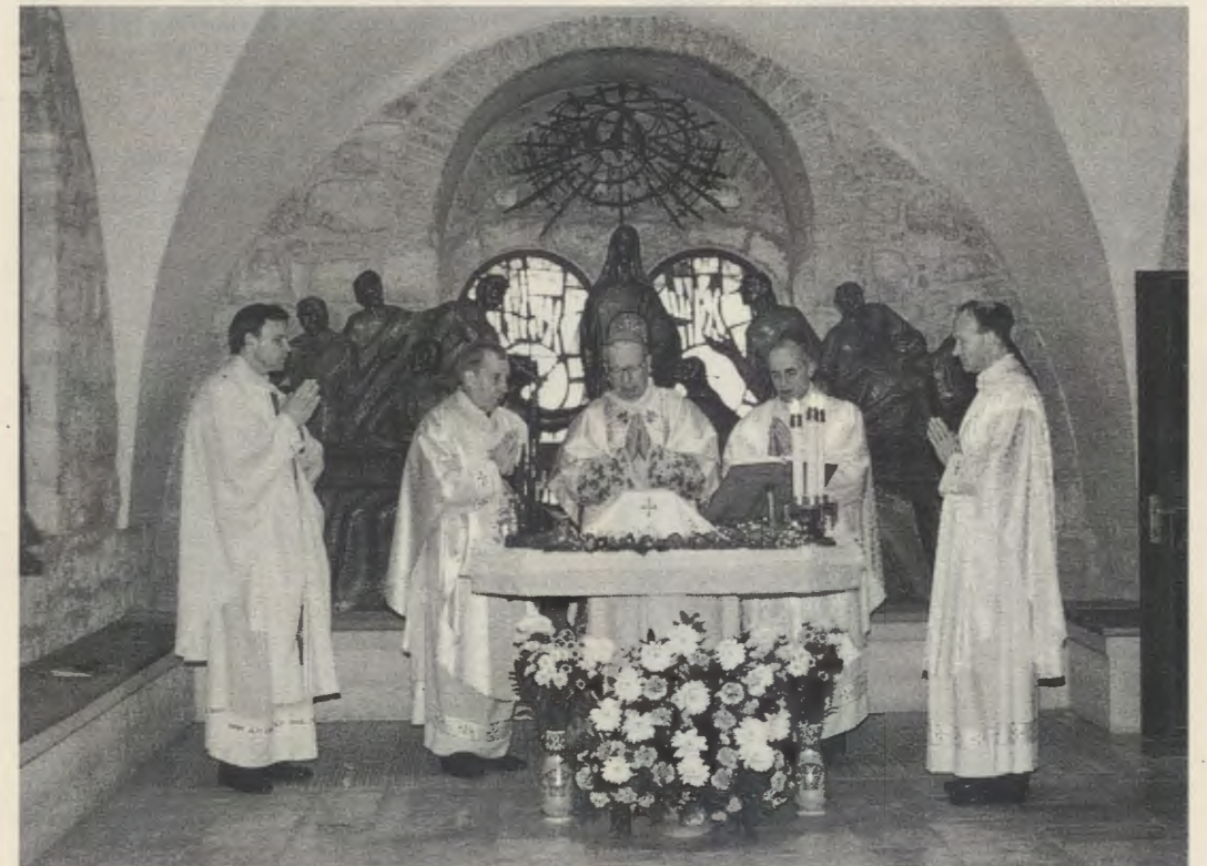
Bischof Alvaro del Portillo bei der Feier seiner letzten Heiligen Messe im Abendmahlssaal in Jerusalem am 22. März 1994.