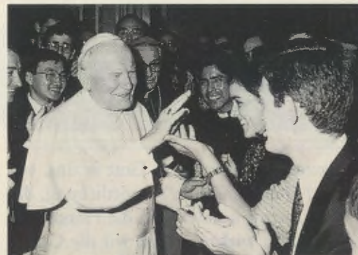
Der Heilige Vater unter den Teilnehmern beim Schlußakt der theologischen Studientagung.

schen Impulse dar, weil sie von einer einzigartigen Einsicht in die universale Strahlkraft der Gnade des Erlösers ausgeht. In einer seiner Homilien bemerkte der Gründer des Opus Dei: »Es gibt nichts, was der Sorge Christi fremd wäre. Wenn wir wirklich theologisch denken, (...) können wir nicht behaupten, es gäbe Wirklichkeiten – seien sie nun gut oder edel oder auch nur indifferent –, die ausschließlich profan sind, nachdem einmal das Wort Gottes unter den Menschen geweilt, Hunger und Durst verspürt und mit seinen Händen gearbeitet hat, nachdem es Freundschaft und Gehorsam, Leiden und Tod erfuhr« 1 .