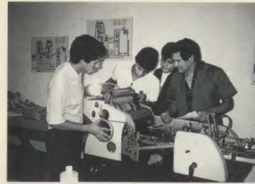
Eine Unterrichtsstunde in der Druckerei.

Ein wichtiger Augenblick in der Geschichte von Kinal war im Februar 1975 der Besuch des Gründers des Opus Dei in Guatemala. Es waren einige wenige Tage, in denen er sehr intensiv und nachhaltig seine apostolische Saat ausstreute. Bereits in den ersten Tagen stellten sich reichliche Früchte ein. Und diese vervielfältigten sich im Laufe der Jahre. Kinal erreicht z. Zt. mit seinen verschiedenen Angeboten jährlich über fünftausend Personen. Dabei steht die Förderung einer Arbeitshaltung im Mittelpunkt, aus christlichem Geist die Arbeit gut zu verrichten. Natürlich gibt es jetzt eine vollständige technische Berufsausbildung in den verschiedenen Abteilungen, in denen theoretisches und praktisches Fachwissen vermittelt wird. In den Werkstätten stehen modernste technische Geräte. Worauf es aber bei der Ausbildung besonders ankommt, ist der be-