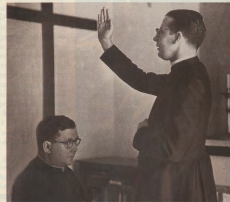
Der Neupriester Alvaro del Portillo erteilt dem seligen Josemaria seinen Primizsegen am 26. Juni 1944.

Ihre Studien waren bereits sehr weit fortgeschritten, und der Gründer wußte immer noch nicht, wie er das rechtliche Problem lösen sollte. Es war einfach kein Weg in Sicht, der es erlaubte, diese seine Söhne zu Priestern zu weihen und sicherzustellen, daß sie auf den Dienst im Opus Dei inkardiniert würden. Am 14. Februar 1943 schließlich erhielt er von Gott die Erleuchtung. Der selige Josemaria hielt sie in seinen Erinnerungen fest: Der Herr, der sich der Eselin des Balaam bediente, hat sich auch dieses eures Vaters als Werkzeug bedient. Am 14. Februar 1943 begann ich die Feier der heiligen Messe. Ich suchte damals intensiv nach einem rechtlichen Weg, wie die Priester im Opus Dei inkardiniert werden könnten; bis dahin ohne Erfolg. Und an diesem Tag, intra missam, hat mir der Herr nach der heiligen Kommunion die Lösung gezeigt: die Priesterliche Gesellschaft vom Heiligen Kreuz. Sogar das Siegel für diese Gesellschaft zeigte er mir: Der Erdkreis mit dem Kreuz, das in ihn gezeichnet war. Es war in Madrid, in einem Haus eurer Schwestern in der Straße Jorge Manrique. 4