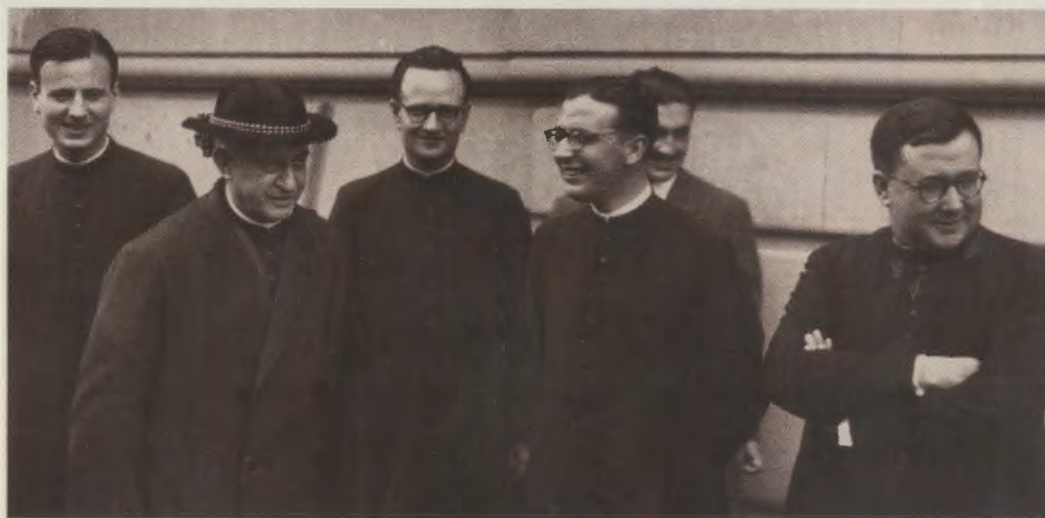
Der selige Josemaria mit dem Bischof von Madrid und den drei ersten Mitgliedern des Werkes, die am 25. Juni 1944 zu Priestern des Opus Dei geweiht wurden.

Die Vorlesungen über Liturgie und Pastoraltheologie behielt sich der Gründer selbst vor.