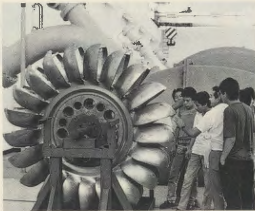
Viele Jugendliche sind bemüht, ihre berufliche und christliche Bildung zu vervollkommen.

Abendschule besuchen. Sie kommen aus verschiedenen Unternehmen und wollen sich als Facharbeiter qualifizieren. Ihnen wird die Möglichkeit geboten, ihr theoretisches Wissen zu vertiefen und auf den neuesten Stand zu bringen. Im Laufe eines Semesters werden ihnen ungefähr hundert Spezialkurse angeboten. Diese befassen sich mit Fachfragen wie Dampfkessel, Qualitätskontrolle, Personalaufsicht, Instandhaltung von Gebäuden und im Betrieb, Spezialfragen für Maurer etc. Die Absolventen erhalten ein »Technisches Diplom«. Diese Kurse werden von den Firmen gefördert, bei denen die Arbeiter beschäftigt sind, da ihnen eine bessere Fachausbildung ihrer Belegschaft letztlich selbst zugute kommt. In den letzten Jahren haben über 350 Betriebe im Land ihre Arbeiter zur fachlichen Qualifikation nach Kinal geschickt.