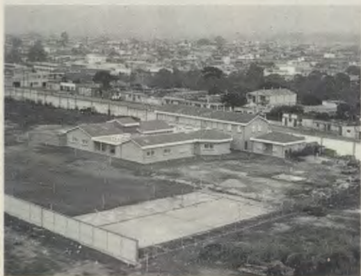
Blick auf Kinal

Das Wort Kinal stammt aus der Sprache der Maya und bedeutet soviel wie »Ort, wo das Feuer entsteht«. Und tatsächlich, jener erste Funke von Großzügigkeit einiger Jugendlicher, vom Wunsch beseelt, anderen zu dienen – ein Wunsch, den sie dem Gründer des Opus Dei verdankten –, entfachte eine Glut der Liebe und der Hingabe, die sich später in einer Arbeit für tausende von Personen Bahn brach.