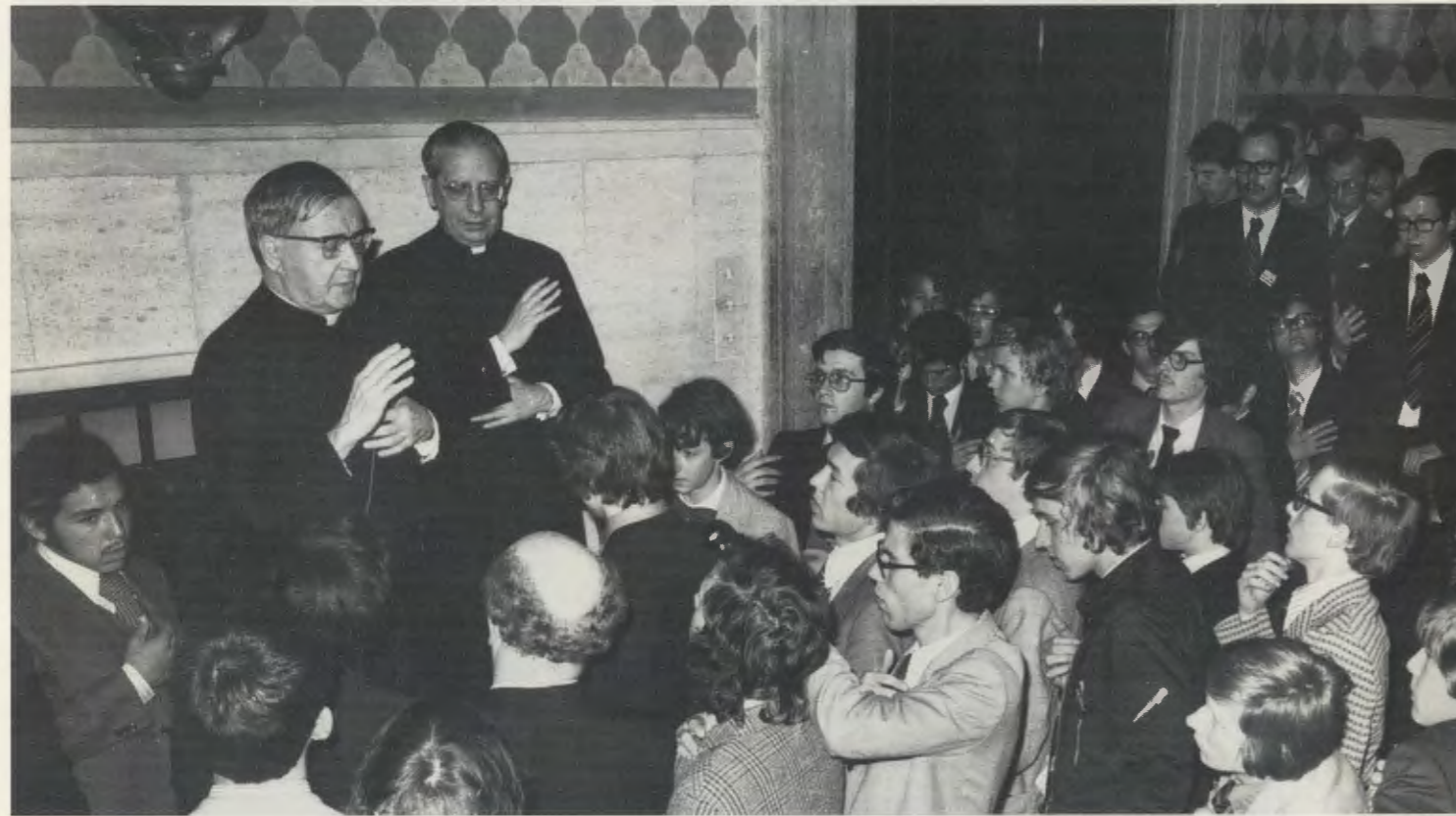
Der Gründer des Opus Dei und der jetzige Prälat, Bischof Alvaro del Portillo, segnen die Gruppe deutscher Studenten, die das Osterfest 1971 in Rom verbrachten.

Dieses Informationsblatt möchte dem durch zwei Beiträge abhelfen: Einer stammt vom Generalpostulator des Opus Dei und einer von Kardinal Edouard Gagnon, der früher selbst Mitglied der Kongregation für die Selig- und Heiligsprechungen war. Dezember 1993