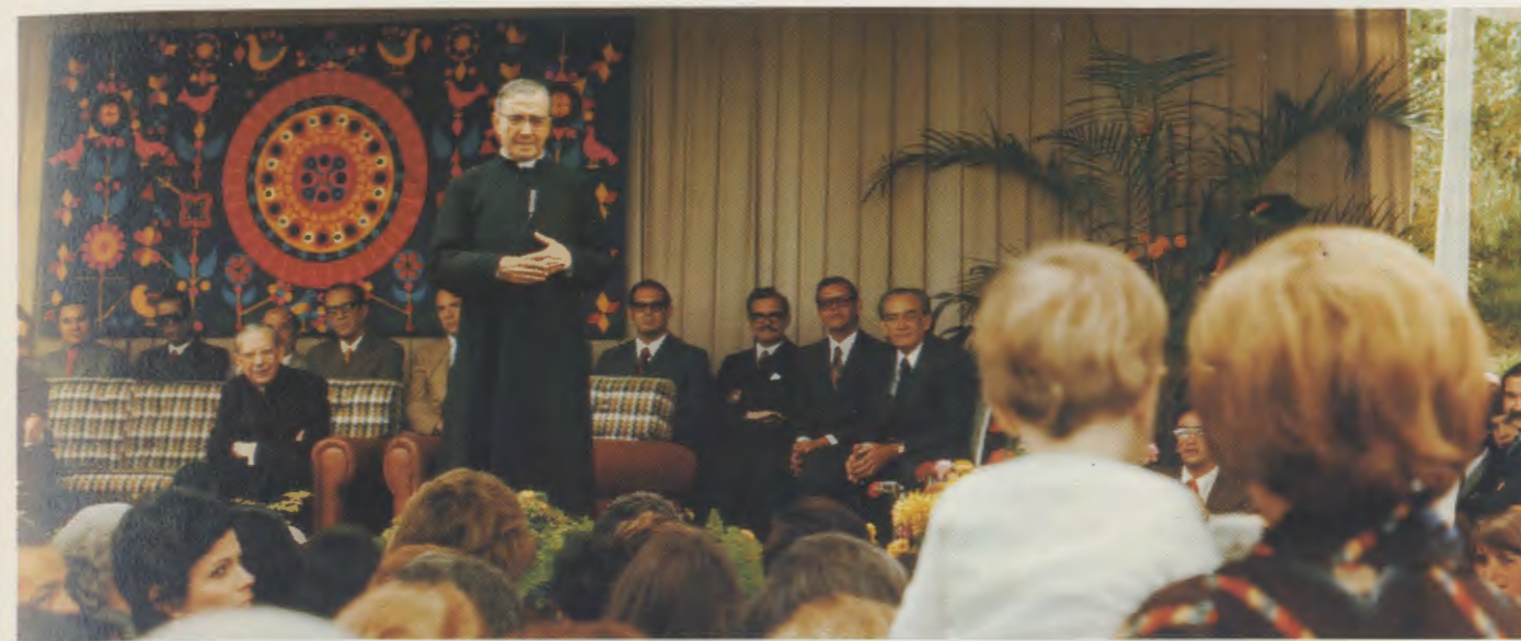
Der selige Josemaria Escrivá bei einer Katechese mit Familien in Venezuela 1975.