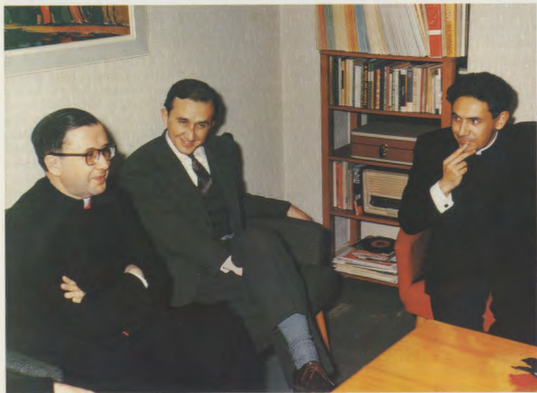
Der selige Josemaria (links) in Köln im Jahre 1960

Das Echo auf der ganzen Welt hat nur eine mögliche Erklärung: Den Glauben so vieler Christen, die in ihr ein göttliches Zeichen sehen. Diese Reaktion der Gläubigen in allen fünf Kontinenten zeigt die Wirklichkeit einer Kirche, die sich daranmacht, eine Gesellschaft zu evangelisieren, in der die Christen sich als normale Bürger selbstbewußt und nicht als passive Zuschauer verhalten. Mit einem herausfordernden und zugleich zu Herzen gehenden Zitat aus einer Ansprache, die der selige Josemaria Escrivá ein Jahr vor seinem Tod in Spanien gehalten hatte, möchte ich schließen: "Es werden nicht diejenigen die Welt retten, die sich darum bemühen, das geistliche Leben einzuschläfern, indem sie alles auf wirtschaftliche oder materielle Interessen reduzieren, sondern jene, die an Gott und an das ewige Ziel des Menschen glauben, die die Wahrheit Christi als wegweisendes Licht für ihr Tun annehmen. Denn der Gott unseres Glaubens ist nicht ein weltenfernes Wesen, das den Menschen gleichgültig betrachtet. Er ist ein Vater, der seine Kinder leidenschaftlich liebt, ein Schöpfer, der seine Geschöpfe zärtlich beschützt. Er hat den Menschen das große Privileg verliehen, ihn lieben zu können, und hat ihn so von seiner Vergänglichkeit und Endlichkeit befreit" (Ansprache in der Universität von Pamplona am 9. Mai 1974).