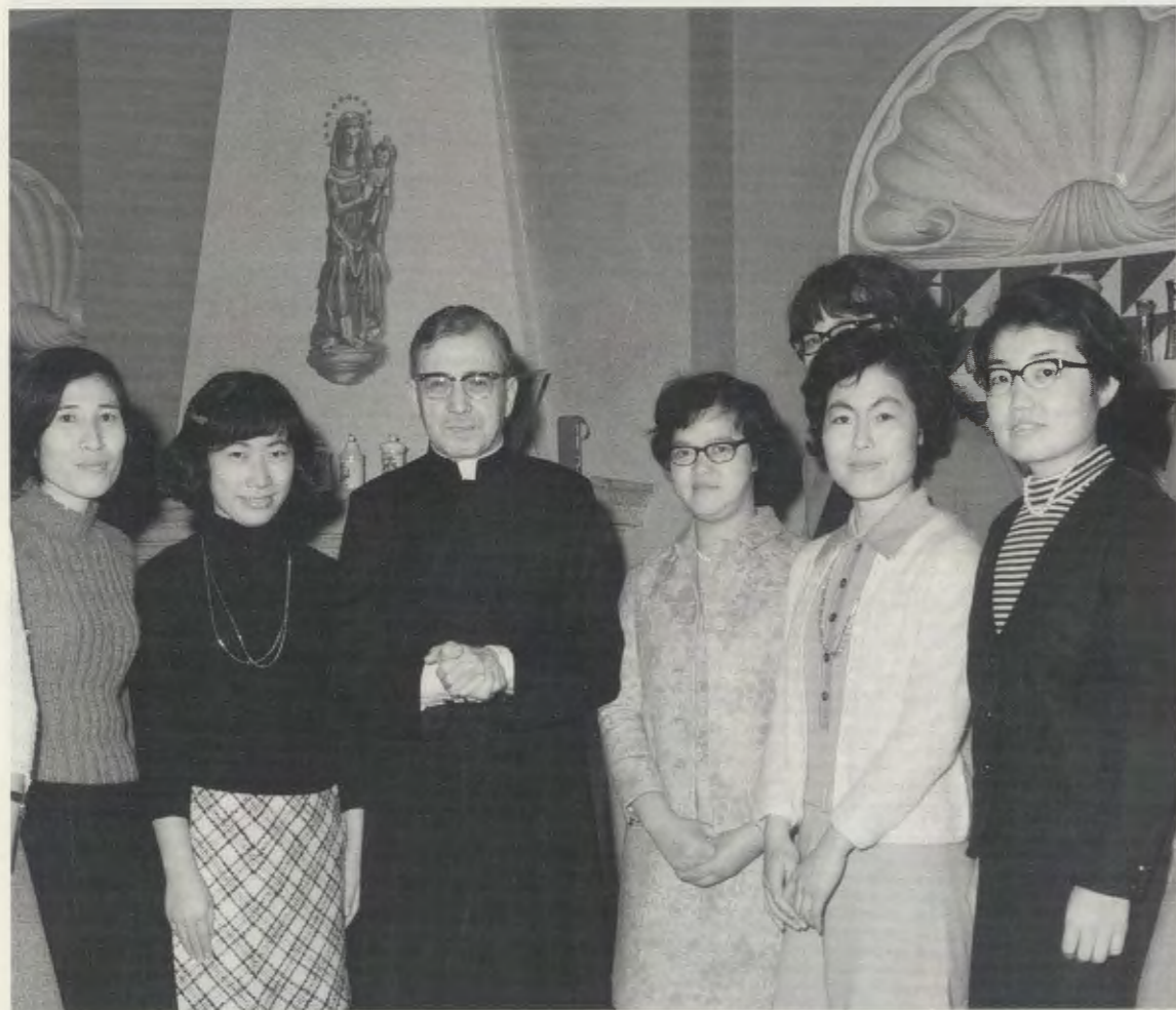
Der selige Josemaría mit einer Gruppe von Japanerinnen in Rom im Jahre 1970.

Das Opus Dei wirkt sich in seinem Bemühen, den Eltern eine tiefe geistliche Bildung zu geben, vorteilhaft für alle Mitglieder der Familie aus. Den Eltern läßt man diese Bildung nämlich nicht allein für sie selbst angedeihen, sondern lehrt sie zugleich, sie weiterzugeben, auch und gerade an die Kinder. Eines der charakteristischen Merkmale der Spiritualität des Opus Dei besteht darin, alle Werte an den Nächsten weiterzugeben. Das Opus Dei sucht verständlich zu machen, daß sich niemand für sich selbst heiligt, sondern für die anderen. Es gilt zu teilen. Denn niemand kann sich heiligen, wenn er nicht mit dem Nächsten teilt.