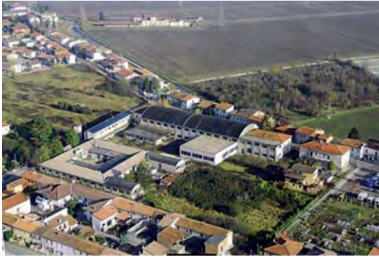
El Ricamificio Automático en los años 80 del siglo pasado.