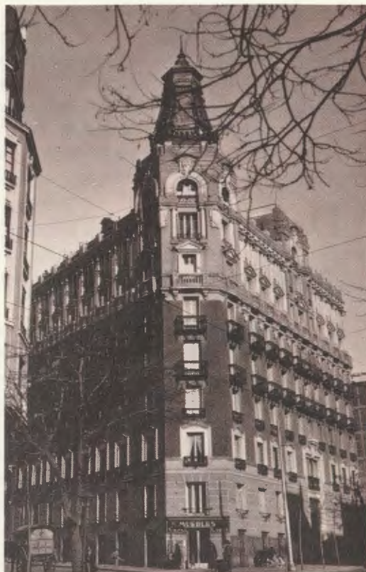
Im Erdgeschoß dieses Gebäudes der Luchana-Straße in Madrid hatte die Akademie DYA ihren Sitz von Ende 1933 bis zu Beginn des akademischen Jahres 1934/35.

Nachdem es ihm 1933 gelungen war, eine stattliche Anzahl von Studenten um sich zu scharen, entschloß er sich, nach einem Ort Ausschau zu halten, an dem er sie intensiver und kontinuierlicher würde ausbilden und dabei gleichzeitig auch mehr Menschen erreichen können. So eröffnete er im Dezember, nicht ohne große Schwierigkeiten, auf einer bescheidenen Etage in der Luchana-Straße in Madrid die Akademie DYA.