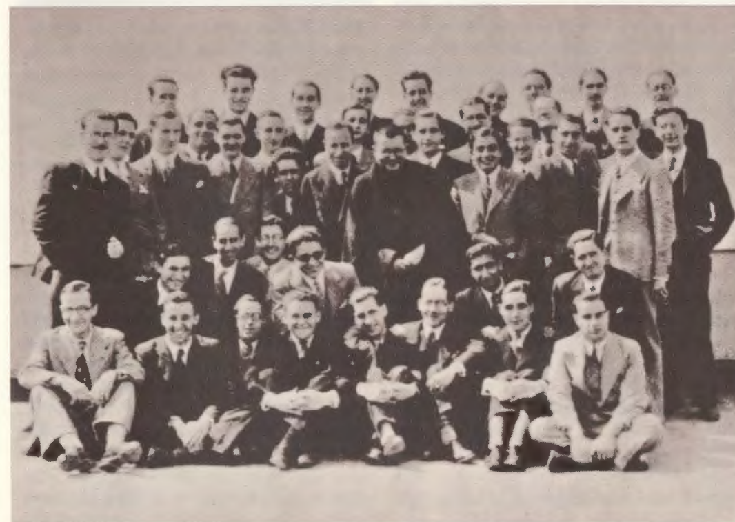
Der Diener Gottes mit einigen Studenten der Akademie DYA.

Abgesehen von geistlicher Leitung im persönlichen Gespräch machte er die jungen Leute mit dem Wesen des laikalen Apostolates