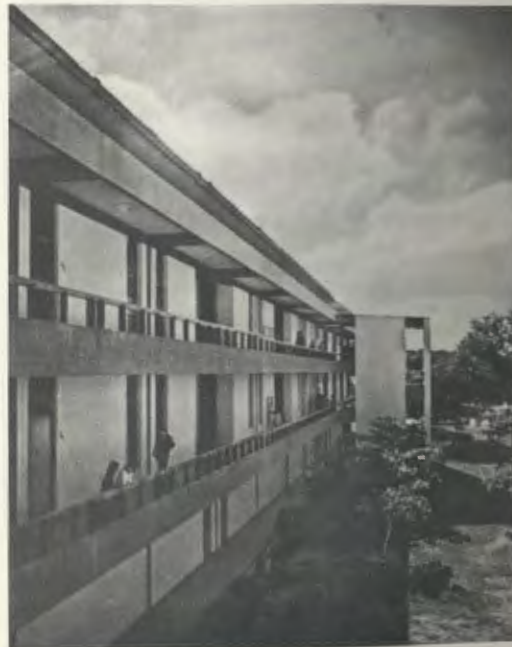
Ein Gebäude der Universität

Auf einem Sandboden, der nur Johannisbeerbrot trägt, wurde 1968 die Universität Piura