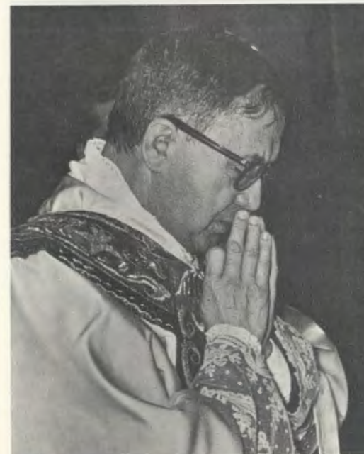
Der Gründer des Opus Dei während der Heiligen Messe in Rom am 21. März 1964.

Wenn der Christ sich mit dem Opfer vereint, mit dem Christus sich selbst dem Vater darbringt, um die ganze Menschheit zu erlösen, wird er fähig, das Erlösungsverlangen des Menschensohnes zu teilen. In seiner Seele nimmt der Wunsch, sich mit dem Kreuzesopfer Christi zu vereinen und Gott das eigene Leben, die eigene Arbeit, die Freuden und Leiden darzubringen und so dem Nächsten zu dienen, wirksame Gestalt an: denn in diesem