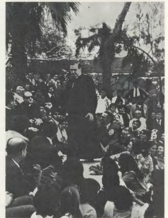
Der Diener Gottes in Larboleda, nahe bei Lima, am 29. Juli 1974. An dem Beisammensein nahmen mehrere Professoren und Studenten der Universität von Piura teil.

Des Gründers Worte stehen für die dauernde Ermunterung zu diesem universitären Unternehmen. Aufgrund seiner Anregungen entstand so ein Bildungsprojekt, das den Bedürfnissen der Region, insbesondere der Forderung nach gut ausgebildeten Fachkräften entspricht. Die mehr als 1 500 Studenten der Universität verteilen sich auf die Geistes- und Ingenieurwissenschaften, auf industrielle Technologie, Medien- und Wirtschaftswissenschaften. Neben dem allgemeinen akademischen Angebot hat die Universität ein systematisches Bildungsprogramm entwickelt, nach welchem für die Region die von Industrie, Handel und Schulwesen benötigten branchenspezifischen Fachkräfte ausgebildet werden sollen.