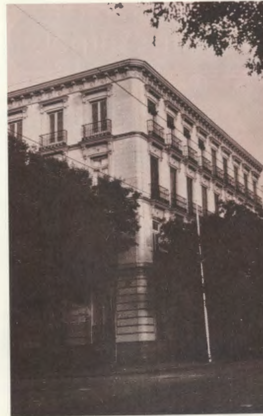
Ab Oktober 1934 war das Studentenwohnheim DYA in der zweiten Etage dieses Gebäudes der Ferraz-Straße Nr. 50 (Madrid) untergebracht; die Akademie hingegen befand sich im obersten Stockwerk.