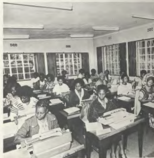
Schreibmaschinenunterricht im Kianda College

So antwortete Msgr. Escrivá de Balaguer 1966 auf die Frage eines Journalisten. Die Entwicklung des Werkes in vielen Ländern der fünf Erdteile ist der beste Beweis dafür, daß seine Worte zutreffen.