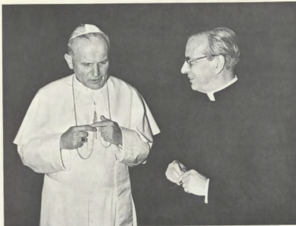
Der Hl. Vater unterzeichnete am 5. Februar 1981 zur Eröffnung des Seligsprechungsverfahrens des Dieners Gottes Josemaría Escrivá das Nihil obstat der Kongregation für die Selig- und Heiligsprechungsprozesse.

Die Liebe zur Freiheit – zu einem Wert also, für den unsere Zeit ein sehr empfindsames Gespür hat – nimmt in der Botschaft von Msgr. Escrivá einen entscheidenden Platz ein. Besonderen Nachdruck legte er auf die Freiheit in den irdischen Angelegenheiten, die für das Wirken der Christen in der Welt unerlässlich ist. Er wollte sie immer mit der dazugehörigen Verantwortung ausgeübt wissen und in Beachtung der Glaubens- und Sittennormen, die das Lehramt der Kirche verkündet. Mit äußerster Korrektheit respektierte er die legitimen Entscheidungen der Christen in allen Bereichen, die der persönlichen Meinung überlassen bleiben. Damit verteidigte er einen unveräußerlichen Bestandteil der Berufung des christlichen Laien und gewährleistete die abschließlich geistliche Zielsetzung des Opus Dei.