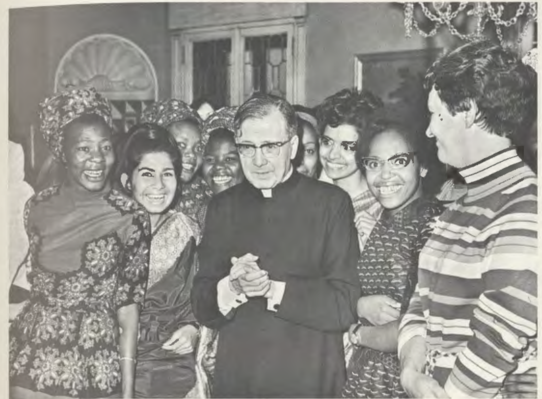
Am 10. April 1971 in Rom: Msgr. Escrivá mit einer Gruppe von Studentinnen des Kianda College

Im Jahre 1958 dehnte sich die Arbeit des Opus Dei unter dem Antrieb seines Gründers zum Fernen Osten hin und nach Afrika aus. Zwei Jahre später begann die weibliche Abteilung des Werkes ihre Arbeit in Kenia. Im Mai 1960 kamen Frauen des Opus Dei aus verschiedenen Ländern Europas und Amerikas für einige Tage nach Rom, um den Segen des Dieners Gottes und seine geistliche Ermunterung zu empfangen, bevor sie nach Kenia gingen.