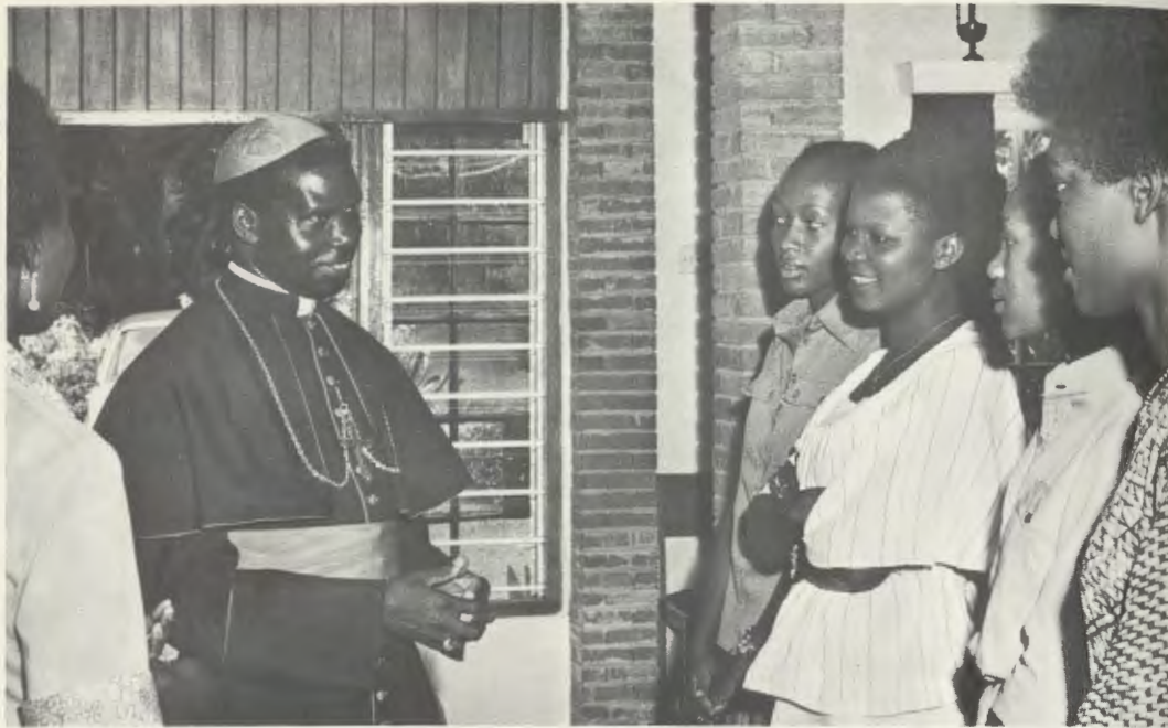
Der Erzbischof von Nairobi, Kardinal Maurice Otunga, im Kianda College

Einige Zahlen verdeutlichen die rasche Entwicklung des Kianda College. Bereits 1963 kamen Schülerinnen aus drei Staaten Ostafrikas, ab 1967 auch aus anderen Ländern des Kontinents: Nigeria, Äthiopien, Sambia, Ghana, Lesotho... Im selben Jahr wurde ein Wohnheim für 100 Mädchen und in einem Flügel des neuen Gebäudes auch die Kibondeni School, eine Hauswirtschaftsschule, eröffnet. 1973 begann die Vorbereitung für die Kianda-Mittelschule, ebenfalls auf den direkten Impuls von Msgr. Escrivá hin, der ihre Fertigstellung jedoch nicht mehr erlebte. Heute zählt diese Schule 350 Schülerinnen. Sie erfuhr von Anfang an die Unterstützung von 3000 ehemaligen Schülerinnen von Kianda. Sie wollten ihre Töchter in dem gleichen Milieu erziehen lassen, das sie selber erlebt hatten.