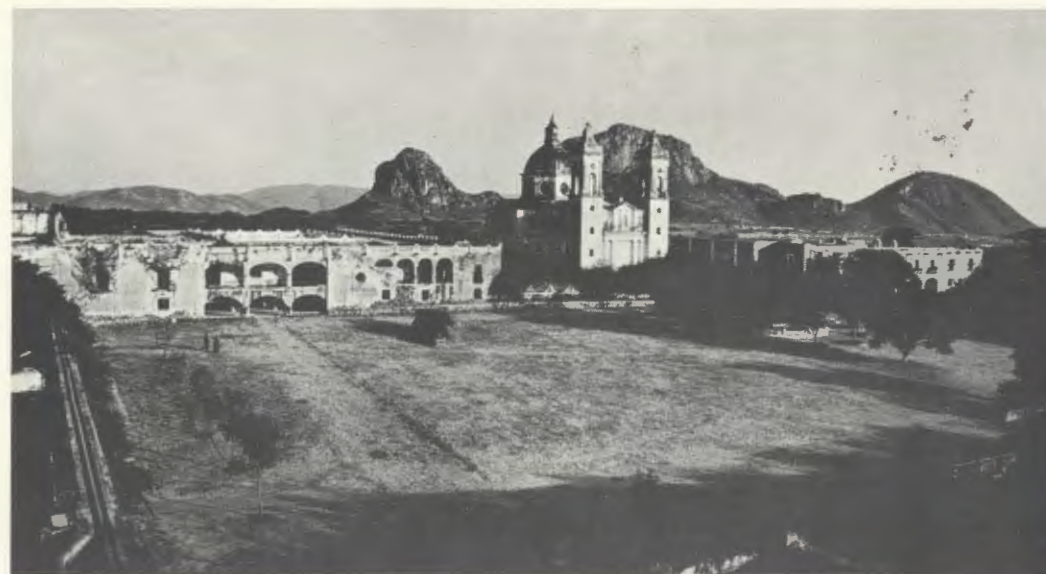
Eine Ansicht von Montefalco bei Jonacatepec im Staate Morelos, Mexiko, 1967

durch das Tal von Amilpas im Staate Morelos. Mich begleiteten einige Mitglieder des Opus Dei; unterwegs sprachen sie eingehend über das Angebot der Eigentümerin des Grundstücks, der privaten Gesellschaft Campo y Deporte A.C., an das Opus Dei, die Leitung jener apostolischen Initiative zu übernehmen; sie erwähnten auch, daß sich Msgr. Escrivá de Balaguer an jener Arbeit sehr interessiert gezeigt hatte.