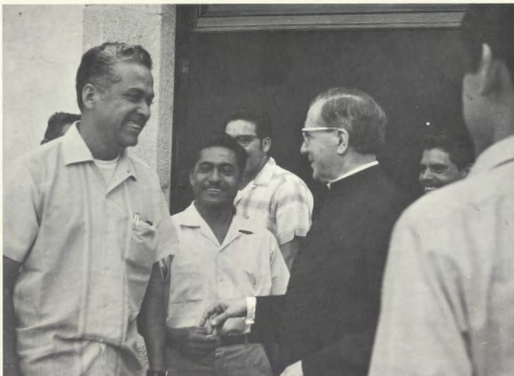
4. Juni 1970: Msgr. Escrivá de Balaguer in der landwirtschaftlichen Versuchsanstalt „El Peñón“

Außerdem werden von Montefalco aus verschiedene Gruppen und Jugendclubs betreut, die in fünfzehn Dörfern des Amilpas-Tales Programme kultureller Bildung und Erziehung im christlichen Geist durchführen.