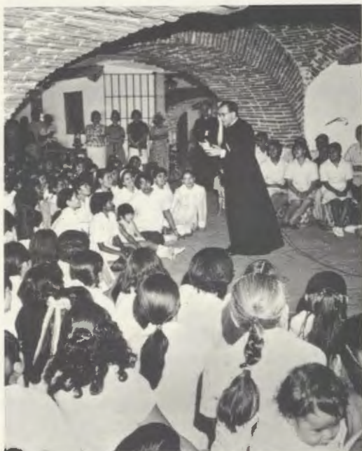
Msgr. Escrivá de Balaguer spricht zu einer Gruppe Bäuerinnen aus der Landwirtschaftsschule Montefalco. Juni 1970

Etwa hundert Kilometer nach Mexiko-City hörte die gute Straße auf. Wir nahmen einen Feldweg