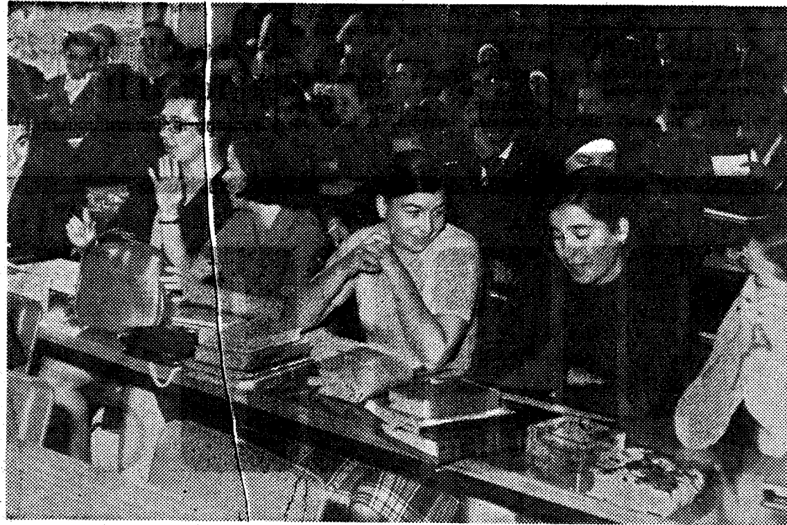
Estudio en una de las aulas de la Universidad.

a formar una mentalidad social, para que los que luego manden —los que ahora estudian— no caigan en esa aversión a la libertad personal, que es verdaderamente algo patológico. Si la Universidad se convierte en el aula donde se debaten y deciden problemas políticos concretos, es fácil que se pierda la serenidad académica y que los estudiantes se formen en un espíritu de partidismo; de esa manera, la Universidad y el país arrastrarán siempre ese mal crónico del totalitarismo, sea del signo que sea.