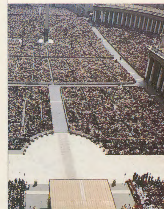
Panoramisch zicht op het Sint-Pietersplein, op 18 mei 1992, gedurende de plechtige dankmis naar aanleiding van de zaligverklaring van de stichter van het Opus Dei, voorgedaan door Mgr. Alvaro del Portillo.

Gesprekken met mgr. Escrivá. De taak van de leek, de vrouw, kerkelijke en maatschappelijke ontwikkelingen, pluralisme, godsdienstvrijheid, universaliteit en democratisering, opvoeding van kinderen, het Opus Dei: vragen van journalisten, en antwoorden van mgr. Escrivá. Geïllustreerd.