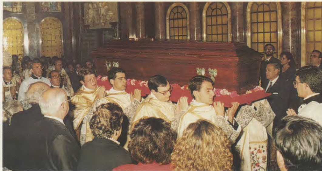
Processie binnen de prelaatskerk van de Heilige Maria van de Vrede, waar het stoffelijk overschot van de zalige Josemaría Escrivá berust, op 21 mei 1992.

pauselijk decreet over de heldhaftigheid van de deugden omschrijft deze devotie als "een waarachtig fenomeen van volksvroomheid". Dit werd vooral duidelijk ter gelegenheid van de zaligverklaring: mensen van alle leeftijden, afkomstig van de meest verschillende landen en van alle sociale lagen, stroomden, ordelijk en in stilte, samen om te bedanken voor de op zijn voorspraak verkregen gunsten, en om hulp te vragen