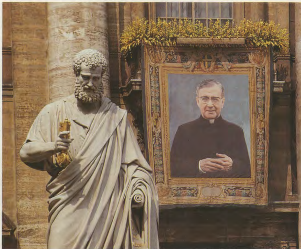
Portret van de zalige Josemaría Escrivá onthuld op 17 mei na de zaligverklaring en tentoongesteld op de gevel van de Sint-Pietersbasiliek tot 18 mei.