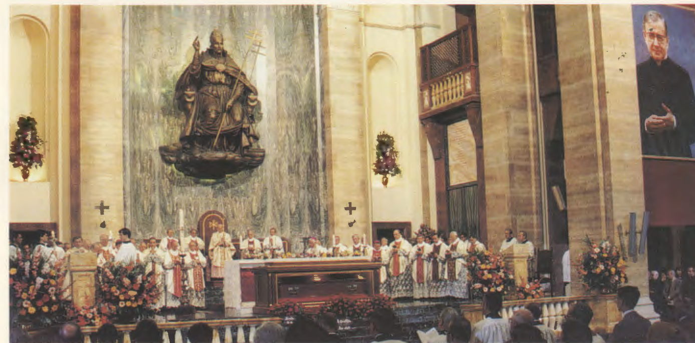
De prelaat van het Opus Dei, met een groep bisschoppen en priesters, tijdens de plechtige dankviering, geconcelebreerd in de Basiliek van Sint Eugenius, op 21 mei 1992.