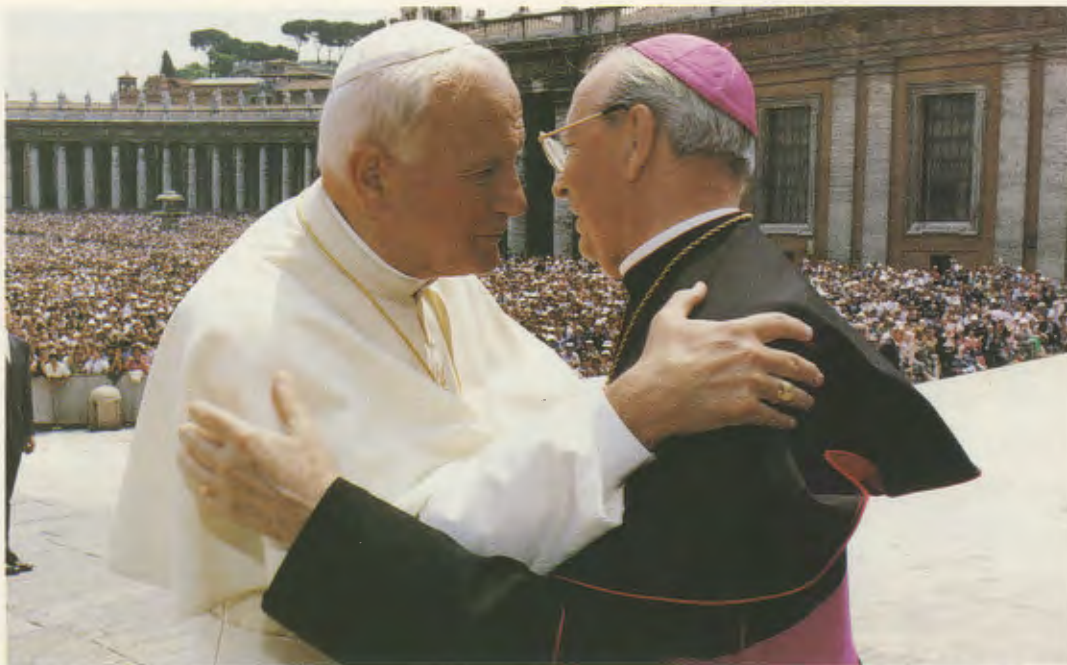
De Heilige Vader omhelst Mgr. Alvaro del Portillo, voor het begin van de audiëntie van 18 mei 1992.

het enige verlangen van het Opus Dei en van ieder van zijn kinderen is de Kerk te dienen zoals de Kerk gediend wil worden 1 .