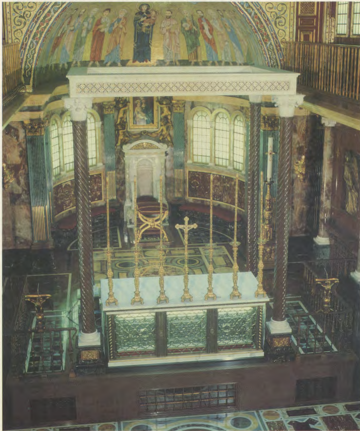
Altaar van de prelaatskerk, met de schrijn waar het stoffelijk overschot van de zalige Josemaría Escrivá berust.