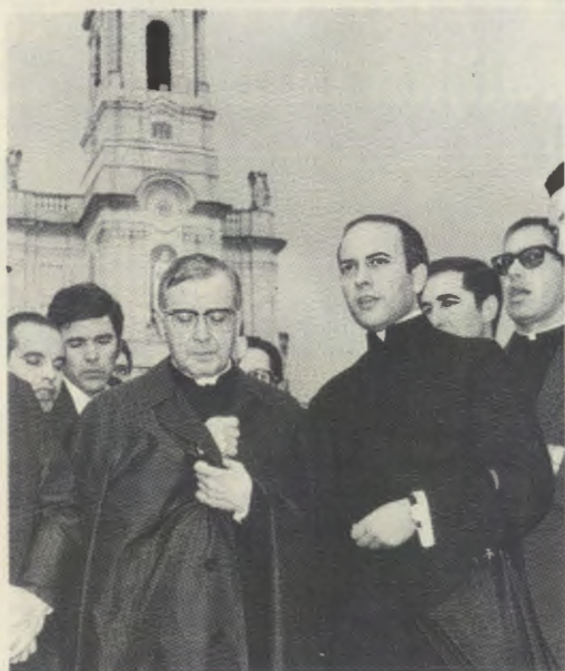
Fatima, 2 november 1972. De Dienaar Gods, omringd door enkele leden van het Opus Dei, bidt de H. Rozenkrans op het plein voor het heiligdom.