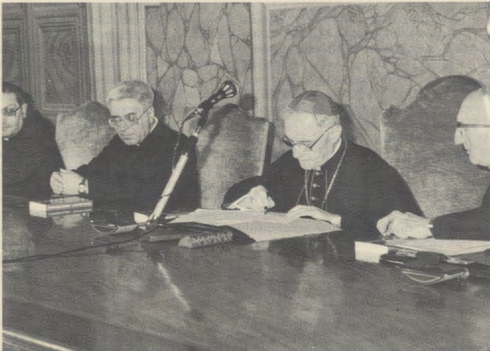
Kardinaal Poletti, Vicaris van de Paus voor het bisdom Rome, tekent als Voorzitter van het Tribunaal, de akten van de slotzitting van het proces. Rome, 8 november 1986.

Meer dan zes jaar zijn verlopen sinds de Vicaris van Rome, kardinaal Ugo Poletti, het decreet ter inleiding van het zalig- en heiligverklaringsproces op 19 februari 1981 uitvaardigde. Gedurende al deze tijd hebben de kerkelijke rechters de getuigenissen aanhoord en verzameld, in een geheel van driehonderd vierenzeventig zittingen. Op 26 juni 1984 werd een gelijksoortig proces afgesloten voor het Tribunaal van het aartsbisdom Madrid, dat een groot aantal getuigen verhoorde in het Spaans. Eveneens in Madrid werden twee processen gevoerd over genezingen van buitengewone aard, die toegeschreven worden aan de bemiddeling van Mgr. Escrivá : de plotselinge verdwijning van een tumor en de genezing van een kwaadaardig lymfoom.