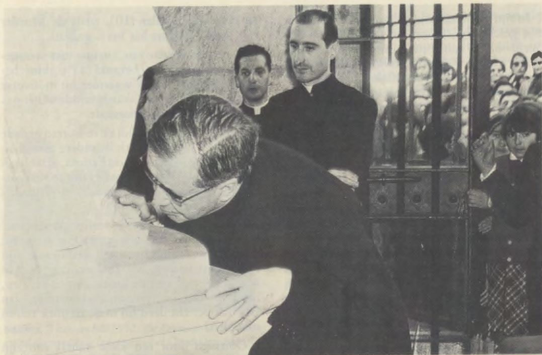
De Dienaar Gods kust de voeten van het beeld van O.-L.-Vrouw, Moeder van de Schone Liefde, in de kapel van de campus van de Universiteit van Navarra, op 23 april 1967.

bij een boom liggen. Er stond een afbeelding van Maria op. Uit vrome fijngevoeligheid raapte hij het blad op en uit eerherstel kaderde hij het in, gebruik makend van kostbare zijde, om het een voornam plaats te geven in de kleine bibliotheek van de Academie DYA, het eerste centrum van het Opus Dei (zie Informatiebulletin nr. 6).