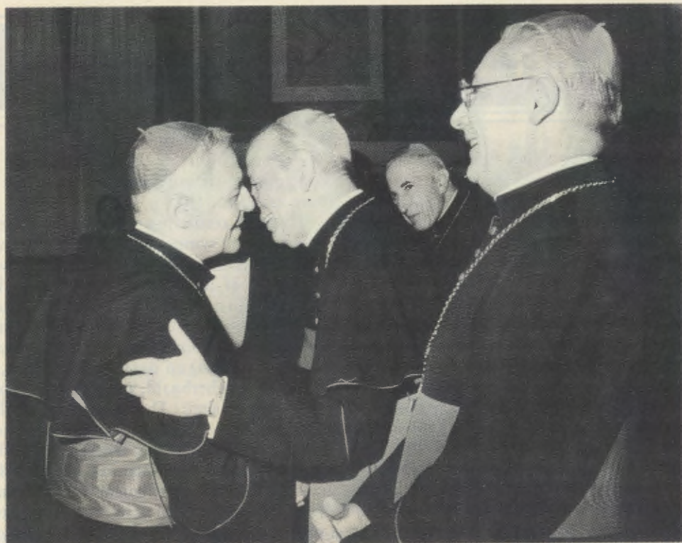
De Prelaat van het Opus Dei, Mgr. Alvaro del Portillo, groet kardinaal Poletti en de kardinalen Poupard en Bafile, gedurende de slotzitting van het proces.

werd in samenhang met de daaruit voortvloeiende verantwoordelijkheid om de waarheid en het goede te bereiken, in volkomen overeenstemming met het geloof en met loyale trouw aan het leergezag van de Kerk. »