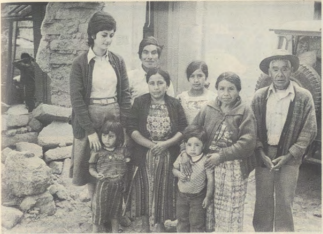
Het werk van het IFES bereikt een groot aantal dorpen van Guatemala.

Het ging om een nieuwe etappe in het leven van dit centrum, dat, zoals zovele andere, ontstaan was vanuit de bezorgdheid van de Stichter van het Opus Dei voor de vorming van de vrouw. Vanaf de eerste jaren van zijn priesterschap had Mgr. Escrivá de fundamentele rol van de christelijke vrouw in herinnering gebracht. Die behelst in vele gevallen een rechtstreekse deelneming aan het openbaar leven, aan de verbetering van de maatschappelijke structuren en, niet het minst, aan de versterking van het gezin: «Zij zal deze rol kunnen vervullen in de mate dat zij menselijk en professioneel voorbereid is. Het is duidelijk dat zowel het gezin als de maatschappij haar specifieke bijdrage nodig heeft, die hoegenaamd niet van bijkomstige aard is.» (1)