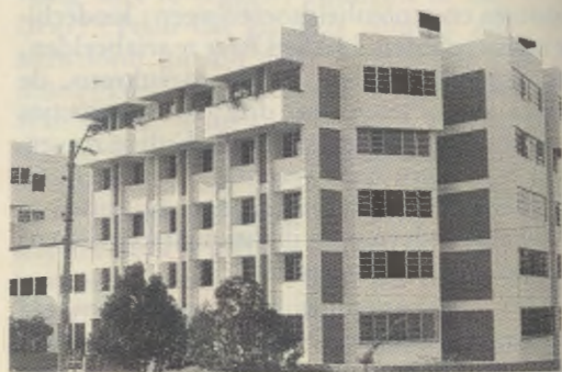
Het hoofdgebouw van het IFES.

In februari 1985, enkele maanden voor zijn overlijden, verbleef Mgr. Escrivá, een aantal dagen in Guatemala, aan het einde van zijn derde katechesereis door Zuid-Amerika. Zoals voordien, kwam ook deze reis neer op een overvloedig uitzaaien van de christelijke leer: aangezet door zijn verlangen de Kerk almaar edelmoediger te dienen, moedigde de Dienaar Gods zijn dochters en zonen aan tot een uitgebreid en vruchtbaar apostolaat, erop gericht de hele maatschappij op een christelijke wijze te verlichten. Tijdens die dagen zegende hij met hoopvolle verwachting een stuk grond ten zuiden van de hoofdstad van Guatemala, waarop de gebouwen van het IFES ( Instituto Femenino de Estudios Superiores ) zouden worden opgetrokken. Het eerste gebouw, dat in 1964 ingehuldigd werd, was te klein geworden voor het groeiend aantal leerlingen en de ontwikkeling van nieuwe initiatieven.