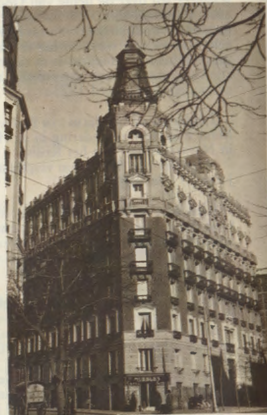
In de benedenverdieping van dit gebouw, gelegen in de Luchanastraat te Madrid, was de Academie DYA gevestigd vanaf eind 1933 tot aan het begin van het academisch jaar 1934-35.

In die jaren ging zijn voorliefde uit naar het apostolaat met de studenten van de universiteit; omdat hij alle lagen van de maatschappij volgens de uitdrukkelijke wil van God moest bereiken, zag hij in dat dit plan op de eerste plaats met jonge mensen uit de universiteitswereld te verwezenlijken viel. Hij onderhield zich met hen in de straten van Madrid of nodigde hen uit op een vriendschappelijk samenzijn in het huis van zijn moeder. Wanneer de studenten niet in de stad waren, wat b.v. tijdens de vakantie het geval was, dan hield hij verder contact met hen door correspondentie. Zo zegt hij onder andere in een van zijn brieven aan een student: Vertrouw volkomen op Jezus. Praat met Hem als met een vriend op wie men erg gesteld is, want dat is Hij. Vertel Hem over de dingen die jou en ons aangaan. Laat allen voor de ogen van je geest de revue passeren: je broeders die daar al langer zijn en de nieuwelingen... en allen die tot aan het eind der tijden zullen komen. Wees ervan overtuigd dat Hij je hoort, want dat is zo. Wees vol geloof, vol geloof en liefde. Roep Maria aan en de H. Jozef, onze Vader en Heer. Ga met je engeltbewaarder om als met een goede vriend. Dit is allemaal oprechte en sterke vroomheid. Wanneer jij je eens (of soms vaak) voor het Tabernakel als het ware uitgedroogd en leeg voelt, zonder te weten wat je Jezus moet zeggen..., houd dan bij Hem de wacht. Volhard zoals gewoonlijk, zonder een minuut eerder op te