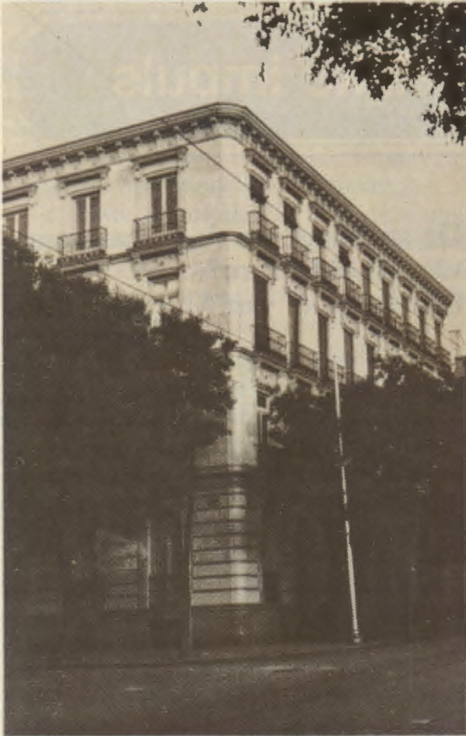
Vanaf oktober 1934 was het studentenhuis DYA op de tweede etage van dit gebouw aan de Ferrazstraat 50 (Madrid) gevestigd; de academie daarentegen bevond zich op de bovenste verdieping.

grond, ingenieurs verven de muren; advocaten, jonge dokters en studenten (die echt studeren) plaatsen de kasten; en als u eens zag hoe zij hun spaargeld ter beschikking stellen voor dit apostolaat! (8).