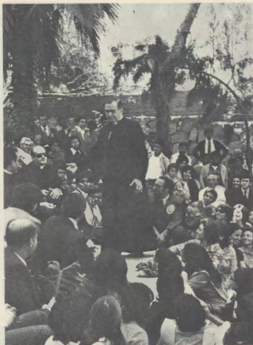
De Dienaar Gods in Larboleda, dicht bij Lima, op 29 juli 1974. Aan de bijeenkomst namen verschillende professoren en studenten van de Universiteit van Piura deel.

Dit zijn betekenisvolle woorden, die uitdrukking geven aan de moed welke de Stichter deze universitaire onderneming voortdurend inblies. Met dit richtsnoer is een vormingsproject ontstaan dat aan de behoeften van de regio, vooral de vraag naar goed opgeleide vakleerkrachten, beantwoordt. Tot op dit moment zijn er voor de meer dan 1500 studenten de faculteiten van geesteswetenschappen, Algemene en Industriële Technologie, Journalistiek en Bedrijfskunde. Naast het algemeen academische aanbod heeft de universiteit een systematisch vormingsprogramma ontwikkeld, dat voor de regio de nodige gespecialiseerde vakmensen voor industrie, handel en onderwijs opleidt.