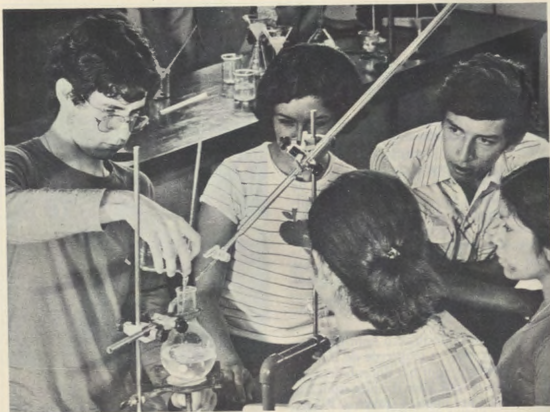
In het chemisch laboratorium.

het oog op de slechte economische situatie, gratis onderwijs. Daarom is de universiteit aangewezen op steun van veel edelmoedige mensen; en er bestaat ook een financieringsbron doordat technische werkplaatsen van de universiteit aan ondernemers ter beschikking worden gesteld.