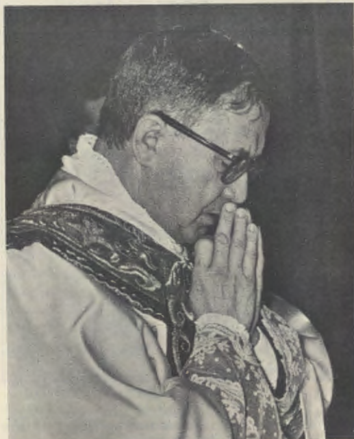
De Stichter van het Opus Dei tijdens de H. Mis in Rome op 21 maart 1964.

Wanneer de christen zich met het Offer verenigt, waarmee Christus zelf zich aan de Vader aanbiedt om heel de mensheid te verlossen, dan is hij in staat te delen in dat verlangen van de Mensenzoon om te verlossen. In zijn ziel neemt de wens om zich met het Kruisoffer van Christus te verenigen en God zijn eigen leven, zijn eigen arbeid, zijn vreugde en verdriet te schenken