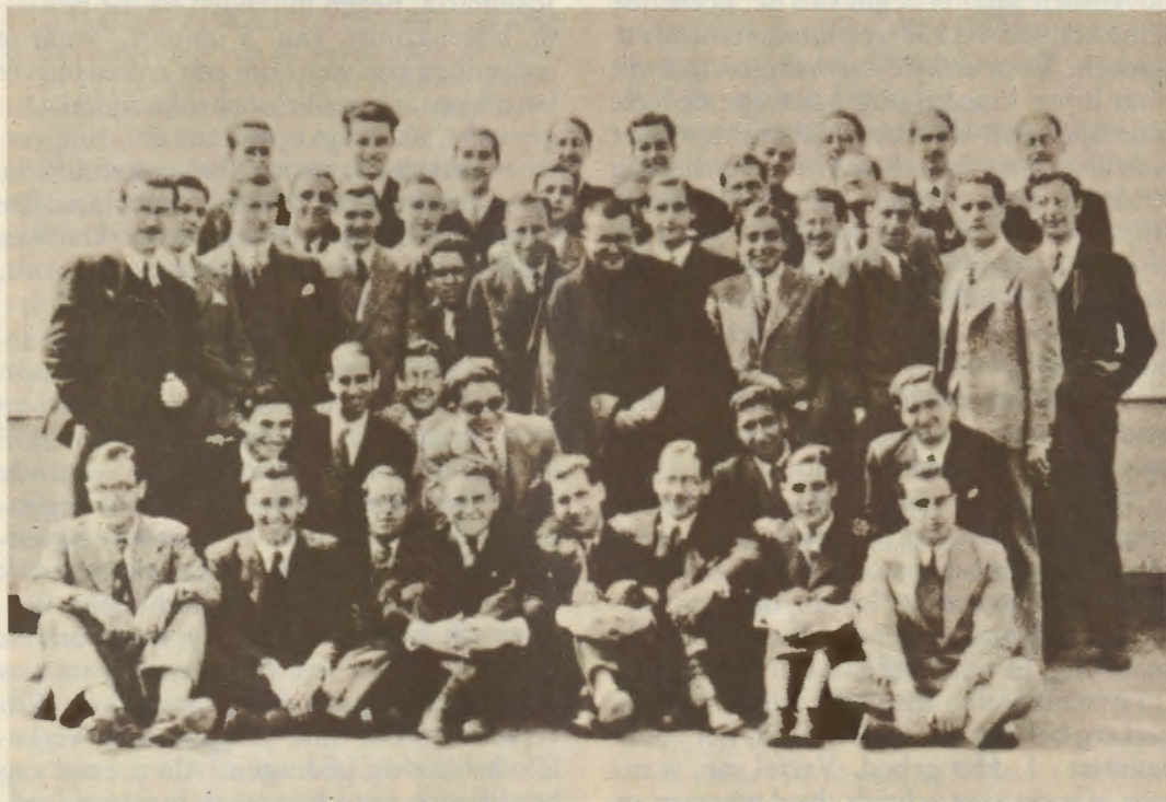
De Dienaar Gods met enkele studenten van de Academie DYA.

Hij legde hun soms uit wat hij later in De Weg zou schrijven: Als je soms een arm houten Kruis ziet, eenzaam, verachtelijk en zonder waarde... en zonder Gekruisigde, vergeet dan niet dat dat Kruis jouw Kruis is: het kruis van iedere dag, het verborgene, zonder glans en zonder troost..., dat wacht op de Gekruisigde die eraan ontbreekt: en die gekruisigde moet jij zijn (3).