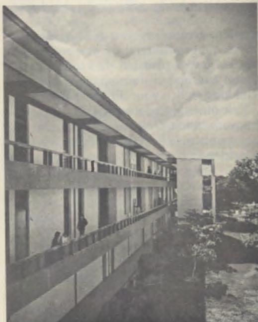
Een gebouw van de universiteit.

Op een zandige bodem, waar alleen maar Johannesbroodbomen groeien, werd in 1968 de Universiteit van Piura opgericht: als resultaat van twee samenwerkende krachten, ten eerste het apostolisch initiatief van leden en medewerkers