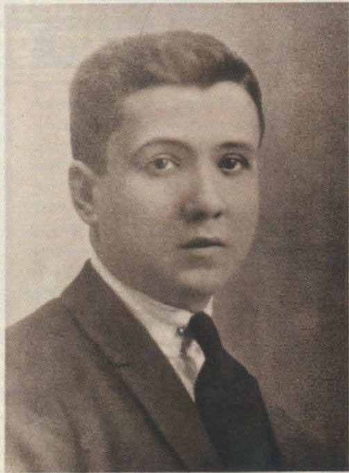
De Dienaar Gods als 15-jarige

Wanneer de Dienaar Gods het boetesacrament beschouwde, dan sprak hij ook dikwijls tegelijk over de vrede en het blijde vertrouwen, die God schenkt aan degene die het Sacrament van vergeving zoekt. Schaduwen verdwijnen, de ziel wordt rustig: daarna moet men alles vergeten zoals God alles vergeet (15) . God overwint in dit arme lichaam, in deze arme ziel, in dit arme hart van mij (16) . Degenen die reeds lang niet meer gebiecht hebben, zullen zich gelukkig voelen nadat zij zich gereinigd hebben. Zij zullen begrijpen dat het leven toch een andere zin heeft, dat zij tot iets hogers geroepen zijn op aarde (17) . Christenen kunnen zaaiers van vrede en vreugde (18) onder de mensen worden, wanneer Gods genade in hen woont. Het apostolaat — de plicht die ons is opgedragen om andere mensen tot een ontmoeting met Christus te brengen — is ook gericht op het boetesacrament en vindt daarin de garantie van haar doeltreffendheid. Een mens helpen om te gaan biechten en daarin de vrede van Gods barmhartigheid te ervaren — dat is een buitengewoon belangrijk bewijs van vriendschap.