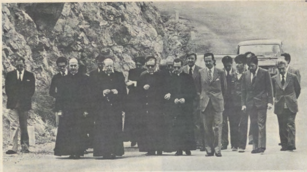
Op weg naar de oude bedevaartkerk van Torreciudad op 24 mei 1975 bad de Dienaar Gods met enkelen van zijn zonen van het Opus Dei de Rozenkrans.

Zeer ingetogen ging hij voort, bleef af en toe staan, en bad onderweg de vijftien geheimen van de Rozenkrans.