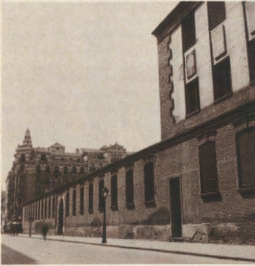
Het Tehuis Porta-Coeli. Hier verrichtte de Dienaar Gods in het begin van de jaren dertig een deel van zijn katechetische activiteit.

meisje van een van deze gezinnen — nu kloosterzuster bij de « Dienstmaagden van Maria » — herinnert zich nog die lessen, welke Don Josemaría in 1932-33 voor acht kinderen uit dat huis gaf: « Als ik het me goed herinner, kwam Don Josemaría tweemaal in de week, 's woensdags en zaterdags, tussen vijf en zes uur 's middags. Het hele jaar door werd er les gegeven met uitzondering van juli en augustus (...). Hij was heel vriendelijk en blij, en de kinderen, waaronder echt nog kleintjes zaten, hadden er zoveel plezier in, dat wij hem niet weg wilden laten gaan. De tijd vloog om en aan het eind van de les klaagden wij altijd dat hij al weer zo gauw weg moest (...). Bij hem voelden wij ons echt op ons gemak. Hij gebruikte afbeeldingen om de katechismus uit te leggen, over de Tien Geboden, de Sacramenten, enz. De kinderen kropen dichterbij om die goed te kunnen bekijken » (5).