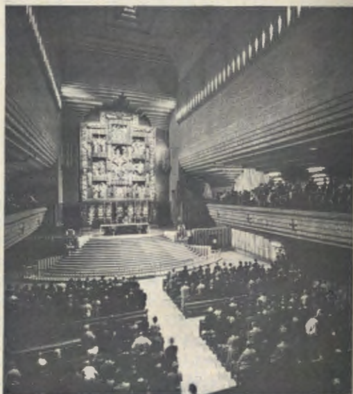
Interieur van het heiligdom van Torreciudad

Vanuit het Spaanse stadje Barbastro leidt de weg langs de rivier de Cinca door een ruw landschap. Bij El Grado verandert de rivier in een meer. We hebben de stuwdam bereikt. Links, op een steile rots, de oude kapel, een half in elkaar gestorte wachttoren, en hoog boven die twee oude bouwwerken het nieuwe heiligdom met enkele gebouwen eromheen. Hier is dus de plaats van het geestelijke werk waarvan de stichter van het Opus Dei gedroomd had. Tegen de achtergrond van een bijna altijd helderblauwe hemel rijzen de bergtoppen van de Pyreneeën omhoog.