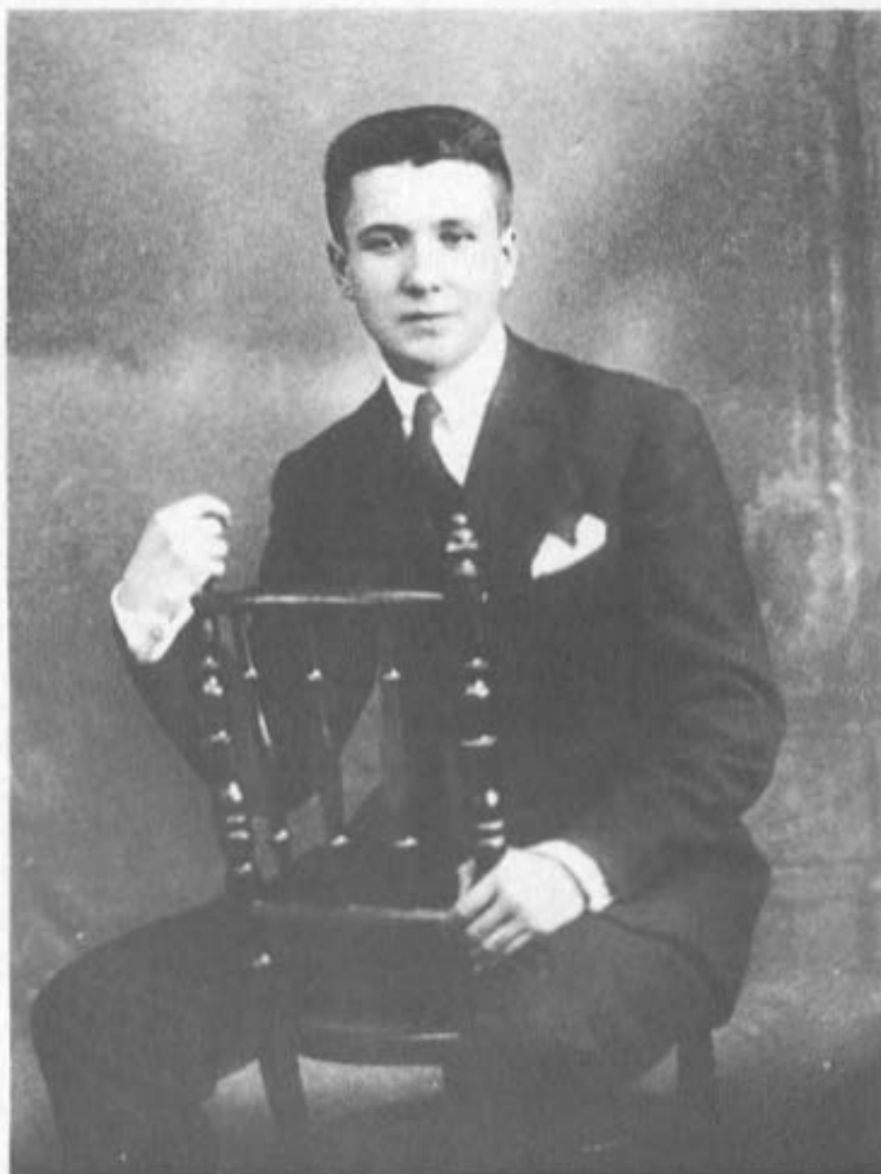
Josemaría op negentienjarige leeftijd.

decretum laudis (het decreet van erkenning) voor het Opus Dei, dat op 16 juni 1950 de definitieve goedkeuring ontving als instelling van pauselijk recht. Gelijktijdig werd de goedkeuring verkregen voor de Vereniging van Medewerkers van het Opus Dei, waartoe ook niet-katholieken konden worden toegelaten.