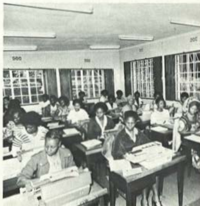
Les in typen op het Kianda College.

Dit was, in 1966, het antwoord van Mgr. Escrivá de Balaguer op vragen van een journalist. En de ontwikkeling van het Werk in landen der vijf continenten is het beste bewijs van de juistheid van deze woorden.