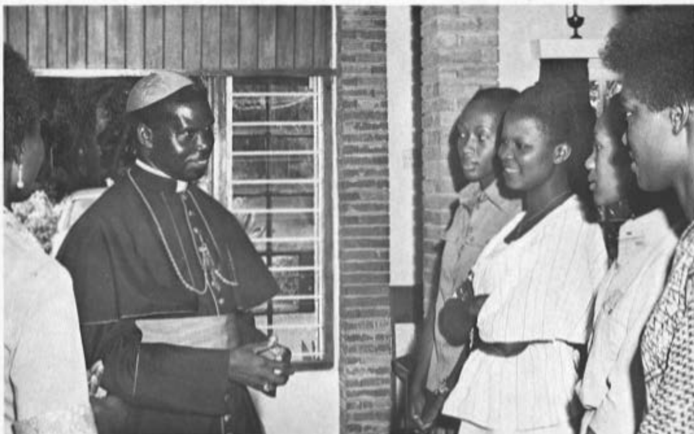
Kardinaal Maurice Otunga, Aartsbisschop van Nairobi, op het Kianda College.

ka en van 1967 af uit vele andere landen van het Afrikaanse continent: Nigeria, Ethiopië, Zambia, Ghana, Lesotho... In datzelfde jaar werd een tehuis voor honderd meisjes geopend en in een vleugel van het nieuwe gebouw werd met de Kibondeni School begonnen, een hotel-school. In 1973, eveneens op rechtstreekse instigatie van Mgr. Escrivá de Balaguer, die echter de realisering van dit project niet meer heeft mogen meemaken, werden de fundamente gelegd van de Kianda High School, een instelling voor middelbaar onderwijs, waar thans 350 meisjes onderwijs genieten. Van het eerste begin af kon dit initiatief rekenen op de geestdriftige steun van de drieduizend oudlerlingen van Kianda, die haar dochters in hetzelfde milieu wilden laten opleiden als zijzelf gekend hadden.