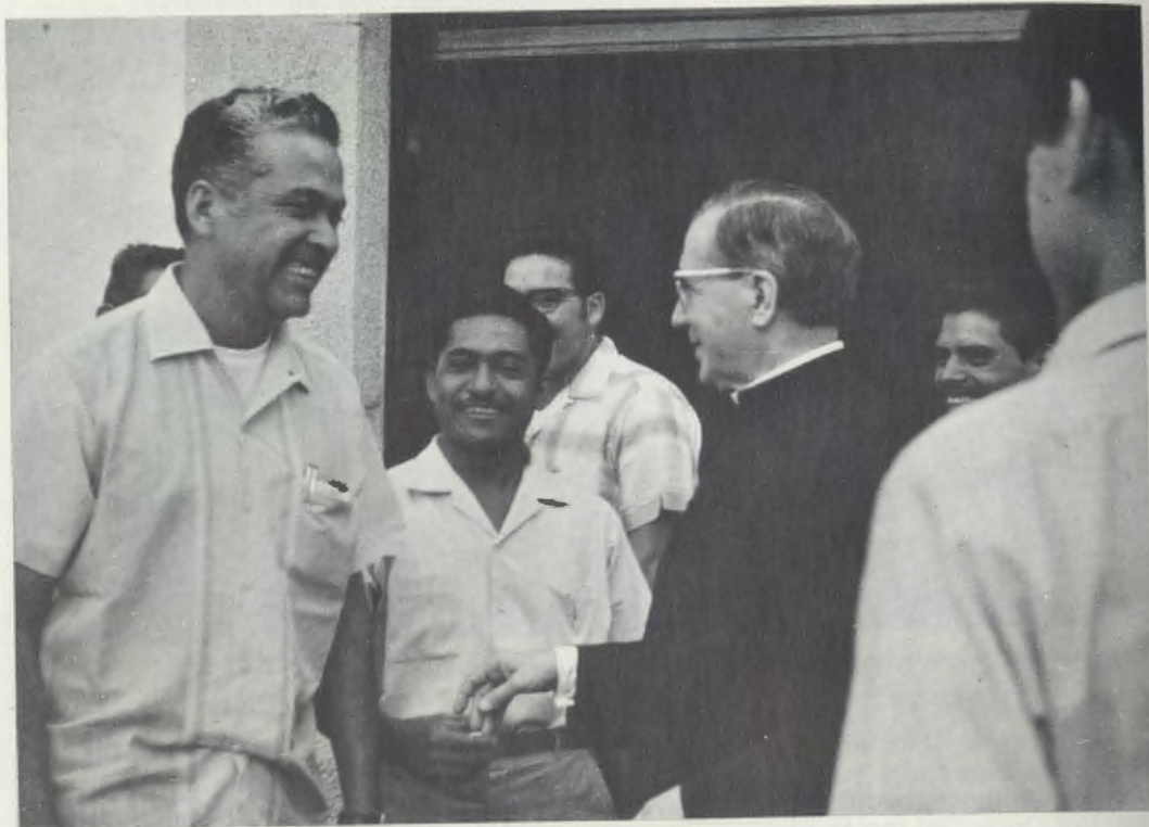
4 juni 1970. Mgr. Escrivá in het landbouwkundig opleidingscentrum El Peñón.

de vijftien dorpen in de vallei van Amilpas een degelijke culturele en christelijke vorming te geven.