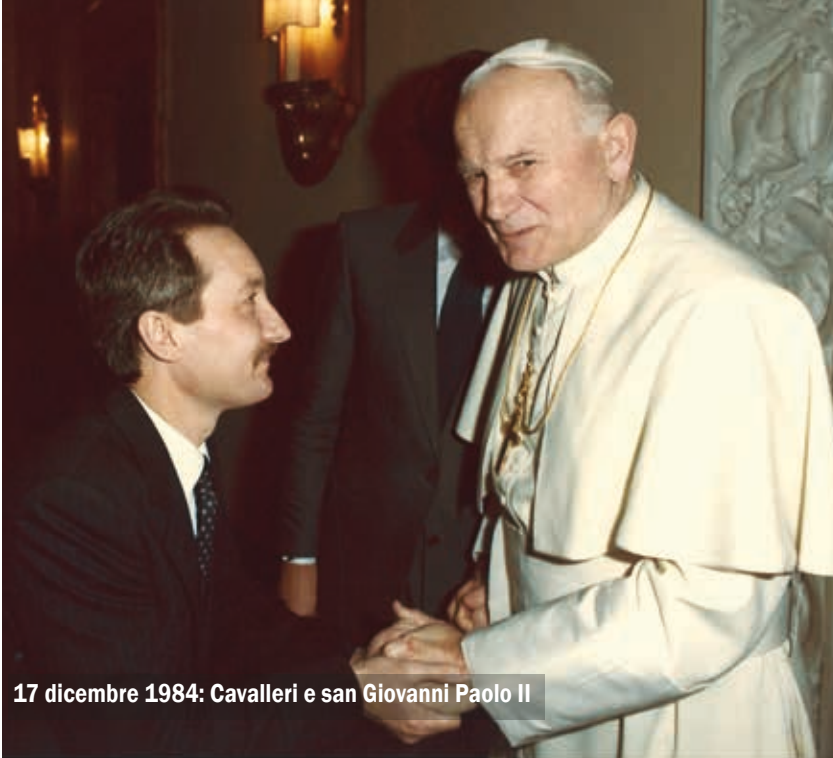
17 dicembre 1984: Cavalleri e san Giovanni Paolo II

piani 1967). Qui si delinea la tragicità di un'epoca senza più maestri, ma nella quale «l'artista è inserito nella società come professionista; è finita l'epoca del poeta solitario (...); in un mondo di consumatori veloci e distratti, in una società ingorda di tutti i possibili generi di consumo, capace di digerire e assimilare rapidamente anche gli oggetti più raffinati dell'arte, in un mondo di rapidissime informazioni e volgarizzazioni, che cosa ci starebbero a fare i Giganti della penna, i Geni della lirica e del romanzo?». Eppure, nonostante Cesare Cavalleri rilevi l'amara esattezza delle osservazioni di quell'ormai dimenticato libro, così afferma, contrapponendosi a esse: «Tutto giusto, tutto vero. Eppure si avverte che la ragione sta dalla