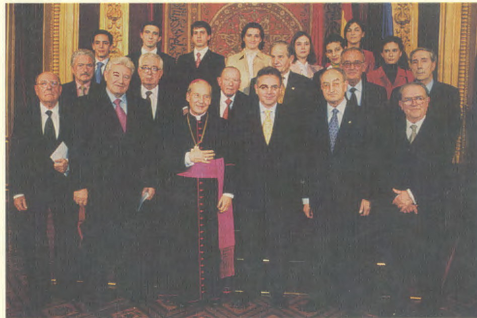
El presidente del Gobierno y el Gran Canciller, rodeados por antiguos alumnos de la primera promoción de Derecho y por estudiantes actuales.