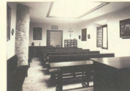
Una de las aulas acondicionadas en la Cámara de Comptos Reales, germen de la actual Universidad.

1961, octubre: Un nuevo edificio se añade a los ya existentes. Se trata de la primera fase de la Clínica Universitaria, que cuenta con 30 camas. También inicia su andadura el Instituto de Idiomas.