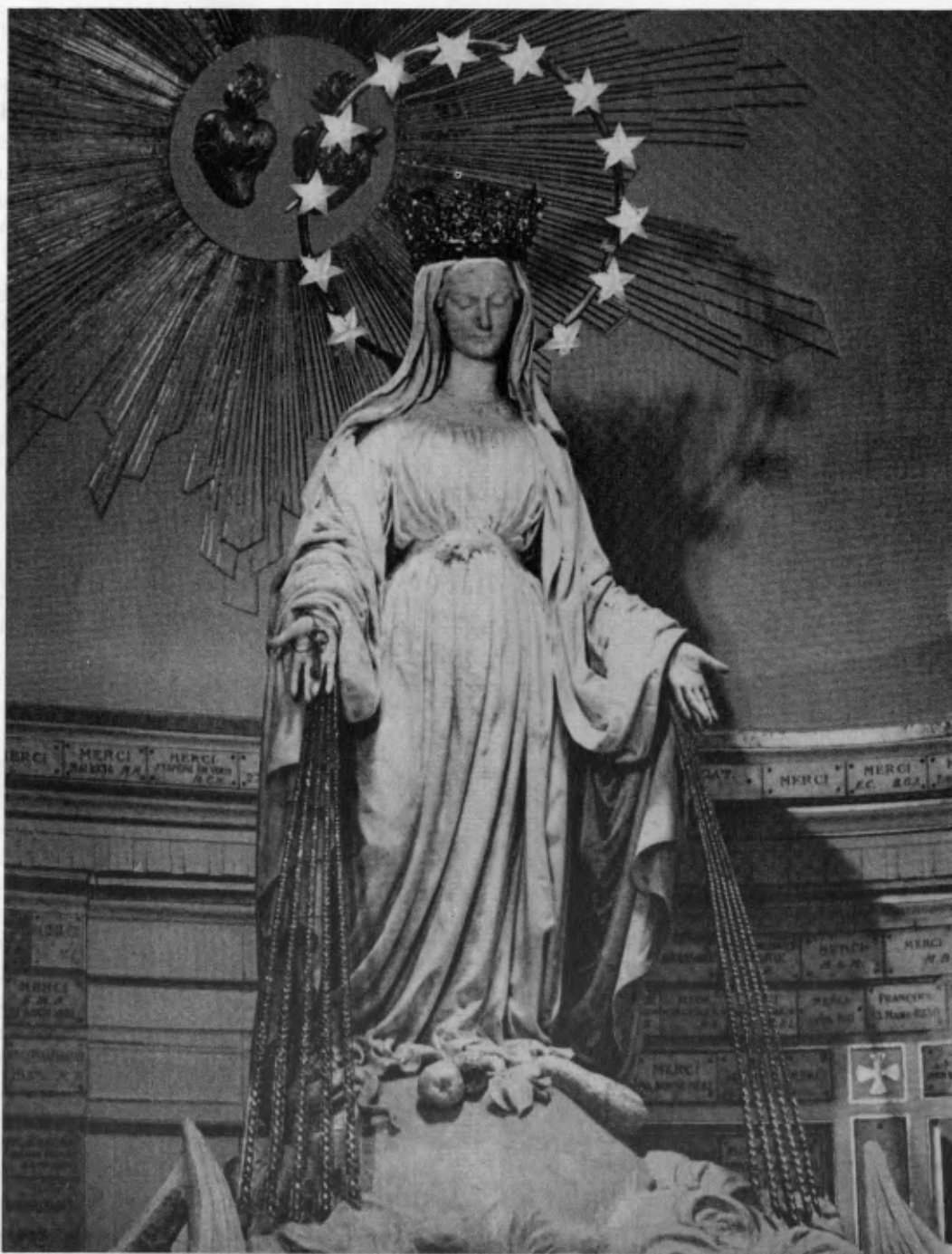
La statue de la chapelle de la rue du Bac, à Paris, où la Vierge apparut à sœur Catherine Labouré, en 1830. Le père de Mgr Escrivá avait une dévotion particulière pour la « médaille miraculeuse » et, lors de ses passages à Paris, le fondateur vint plusieurs fois prier dans cette chapelle Marie, médiatrice de toutes grâces.

(Texte composé le 9 janvier 1973 par Mgr Escrivá et ajouté en tête de son livre Saint Rosaire ).