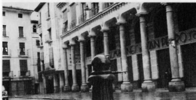
La place du marché de Barbastro (Aragon). A gauche du portique, la maison natale de Josemaría Escrivá de Balaguer