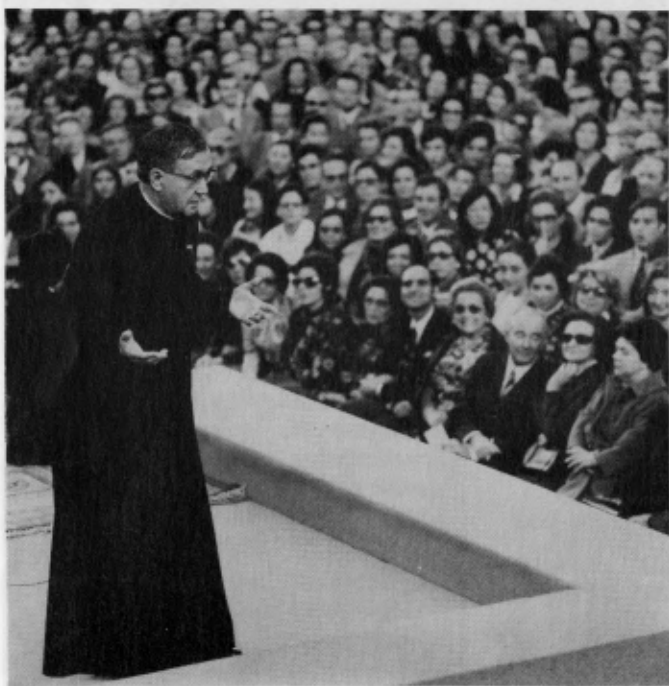
A Barcelone, en 1972

Le plus connu de ses ouvrages est Chemin (Le Laurier), suite de 999 pensées frappantes qui ont pour origine la prédication et le travail pastoral de Mgr Escrivá dans les années 30. Il a été publié dans une première version en 1934, et a connu depuis 196 éditions en 36 langues, atteignant un tirage de 3 210 000 exemplaires. Ses chapitres tracent un itinéraire