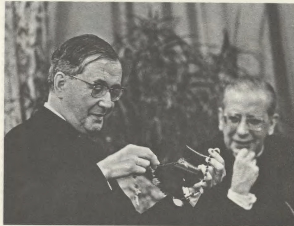
Avec l'abbé Alvaro del Portillo, à Lima (Pérou), le 25 juillet 1974.

En accord avec cette unité de vie, le Serviteur de Dieu ne considéra pas l'apostolat comme une activité de plus parmi d'autres, ni comme une mission réservée