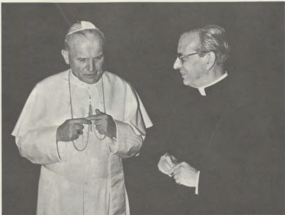
Le 5 février 1981, Sa Sainteté le Pape Jean Paul II a ratifié le nihil obstat de la Sacrée Congrégation pour les Causes des Saints à l'introduction de la Cause de béatification et de canonisation du Serviteur de Dieu Josemaría Escrivá de Balaguer.

dans les matières sujettes à opinion. Il défendit ainsi un principe intangible de la vocation séculière chrétienne, et sauvegarda la finalité exclusivement spirituelle de l'Opus Dei.