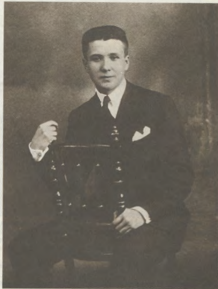
Josemaría à 19 ans.

En 1946 le Serviteur de Dieu vint à Rome, où il fixa définitivement sa résidence. En 1947 il obtint du Saint-Siège le decretum laudis pour l'Opus Dei, qui reçut, le 16 juin 1950, l'approbation définitive comme institution de droit pontifical. L'Association des Coopérateurs de l'Opus Dei, qui peut admettre aussi des non-catholiques, fut approuvée en même temps.