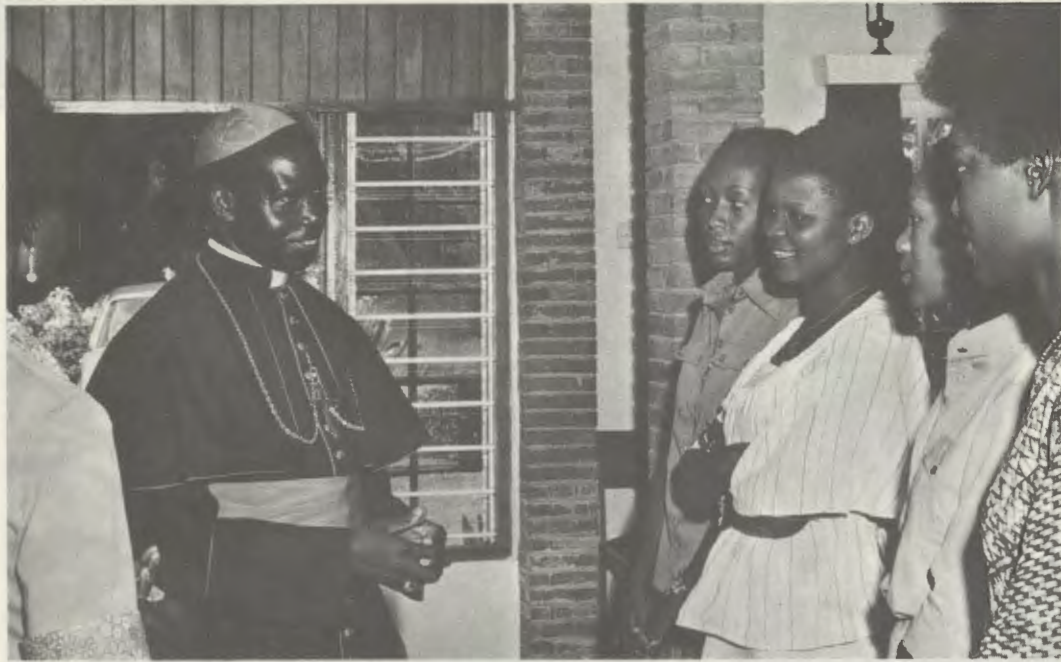
Le cardinal Maurice Otunga, archevêque de Nairobi, à Kianda College.

Nigéria, Ethiopie, Zambie, Ghana, Lesotho... Cette même année s'ouvrit une résidence pour cent jeunes filles, et dans une aile du nouvel édifice s'installa une école hôtelière, Kibondeni School. En 1973, toujours sous l'impulsion directe de Mgr Escrivá de Balaguer, qui n'eut pas le temps de voir ce travail achevé, l'on jeta les bases de Kianda High School, établissement d'enseignement secondaire qui compte actuellement 350 élèves. Dès le début, cette initiative put compter sur l'appui enthousiaste des trois mille anciennes élèves de Kianda, désireuses de voir leurs propres filles éduquées dans cette même ambiance qu'elles avaient connue.