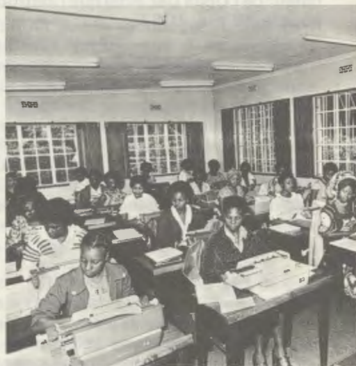
Cours de mécanographie à Kianda College.

C'est ainsi que Mgr Escrivá de Balaguer répondait, en 1966, aux questions d'un journaliste. Et le développement de l'Œuvre dans les cinq continents constitue la meilleure démonstration de l'exactitude de ces paroles. En 1958, le travail de l'Opus Dei s'étendit – sous l'impulsion de son Fondateur – à l'Extrême-Orient et à l'Afrique.