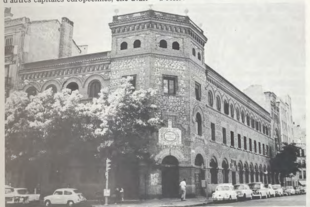
Madrid. Le Patronage des Malades.

A propos de ces années déjà lointaines, l'une des premières Dames Apostoliques a écrit :