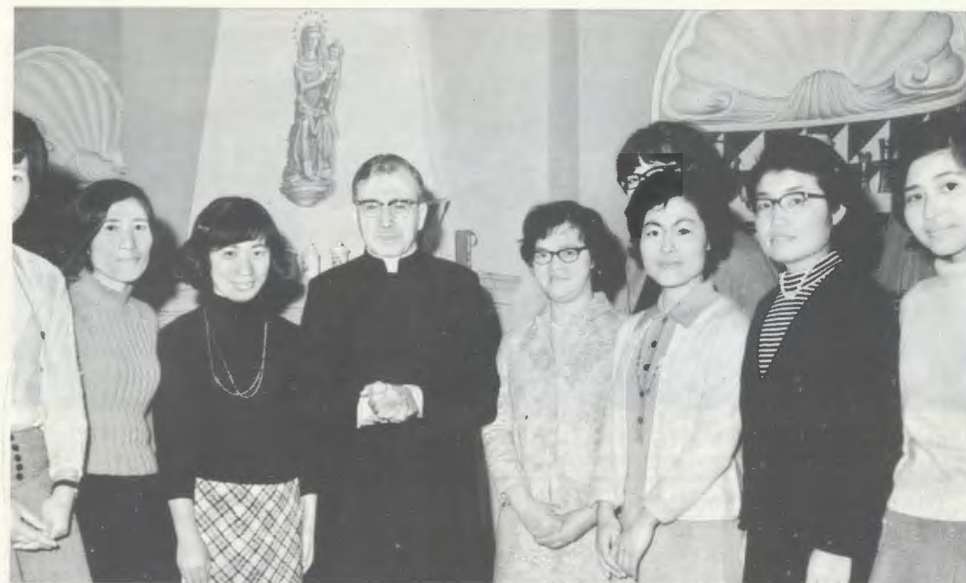
Rome, mars 1970 : Mgr Escrivá de Balaguer en compagnie d'un groupe de Japonaises de l'Opus Dei.