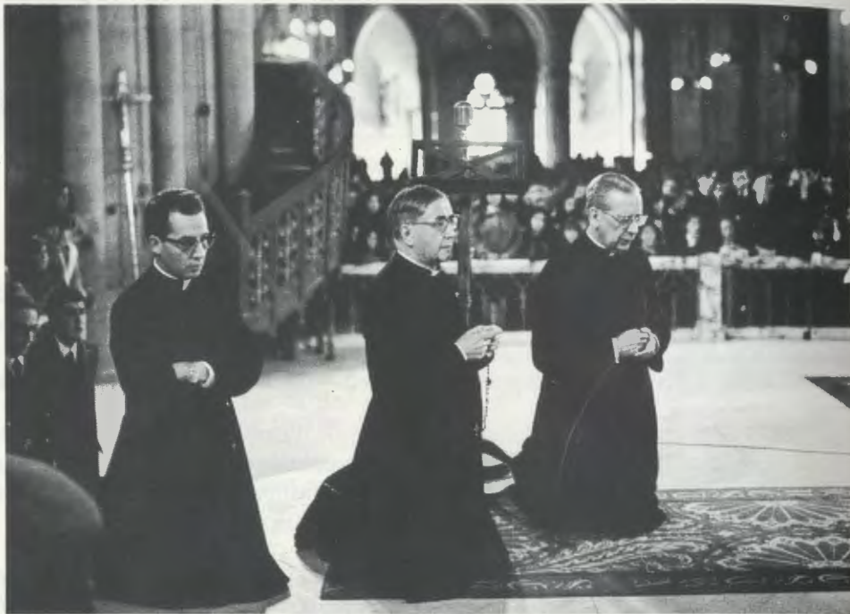
Mgr Escrivá de Balaguer en prière dans le sanctuaire de Notre-Dame de Luján (Argentine), le 12 juin 1974, avec, à ses côtés, M. l'abbé Alvaro del Portillo, actuel Président Général de l'Opus Dei et M. l'abbé Javier Echevarría, Secrétaire Général de l'Œuvre.

Il n'est cependant pas rare que certains posent la question suivante : comment faire oraison ? Dans une homélie prononcée le 4 avril 1955, le fondateur de l'Opus Dei répond :