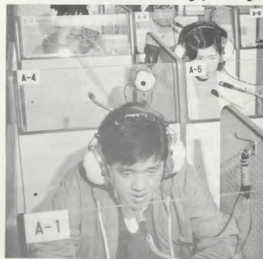
En plein travail, dans le laboratoire de Langues de SEIDO.

Avec le baptême, Dieu Notre Seigneur t'a donné le sens de l'Eglise. Prie pour ceux et celles de ton pays, car c'est un très grand peuple, prie pour qu'ils connaissent Jésus-Christ, qu'ils L'aiment et qu'ils Le servent. Vous savez toutes que tes sœurs du Japon préparent actuellement l'ouverture d'un collège, à Naga-