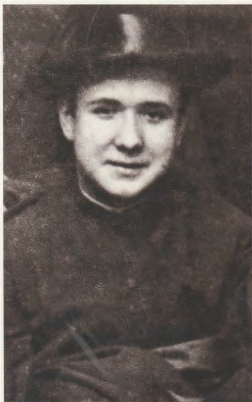
Mgr Josemaría Escrivá de Balaguer séminariste à Saragosse en 1923

Bien des manifestations de l'Amour de Dieu en ces années de mon adolescence me reviennent en mémoire – dira-t-il plus tard, évoquant ces souvenirs, – lorsque je pressentais que le Seigneur voulait quelque chose de moi, quelque chose que j'ignorais. Des événements et des détails ordinaires, apparemment innocents, dont Il se servait pour mettre en mon âme cette inquiétude divine. Aussi