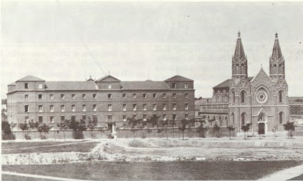
Résidence des Missionnaires de St-Vincent de Paul et Basilique de la Médaille Miraculeuse, dans la rue Garcia de Paredes, à Madrid, telles qu'elles étaient en 1928

chose de moi — quelque chose que j'ignorais — je fis mes oraisons jaculatoires à moi. Seigneur, que veux-tu ? que me demandes-tu ? Je pressentais qu'Il me cherchait pour quelque chose de nouveau et le Rabboni, ut videam ! — Maître, que je voie ! — me poussa à supplier le Christ, dans une prière constante : Seigneur, que ce que Tu veux s'accomplisse !