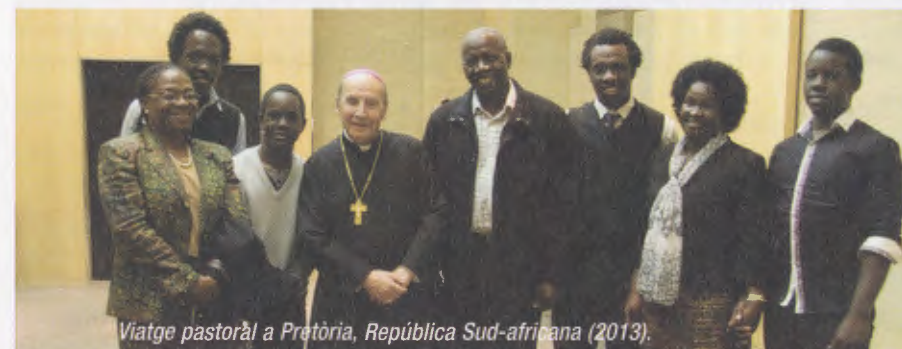
Viatge pastoral a Pretòria, República Sud-africana (2013).

nombroses visites de Mons. Javier Echevarría. El prelat sempre va aprofitar l'ocasió per encoratjar les persones amb qui es trobava a viure intensament la seva vida cristiana i a dur a terme una nova evangelització, plena d'audàcia, en aquestes terres. Molts dels fruits de santedat i de fidelitat a l'Església a Catalunya i a Andorra es deuen al seu afectuós i magnànim impuls.