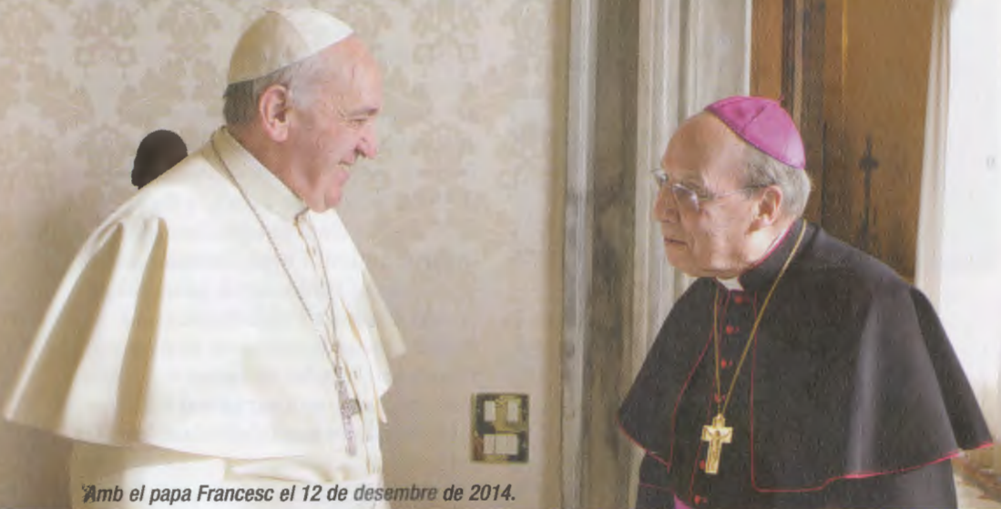
Amb el papa Francesc el 12 de desembre de 2014.

El qui va ser fins al desembre del 2016 el prelat de l'Opus Dei va secundar el desig dels darrers sants pares de portar arreu del món la nova evangelització.