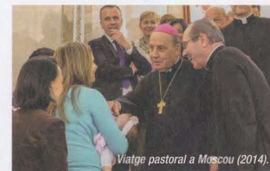
Viatge pastoral a Moscou (2014).

L'expansió dels apostolats de l'Obra arreu de Catalunya, del nombre de persones que participen en els mitjans de formació cristiana i en els diversos esdeveniments històrics relacionats amb el Principat, han estat el teló de fons de les