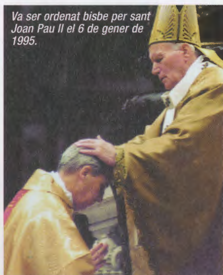
Va ser ordenat bisbe per sant Joan Pau II el 6 de gener de 1995.

el secretari des de 1953 fins a la seva mort, l'any 1975.