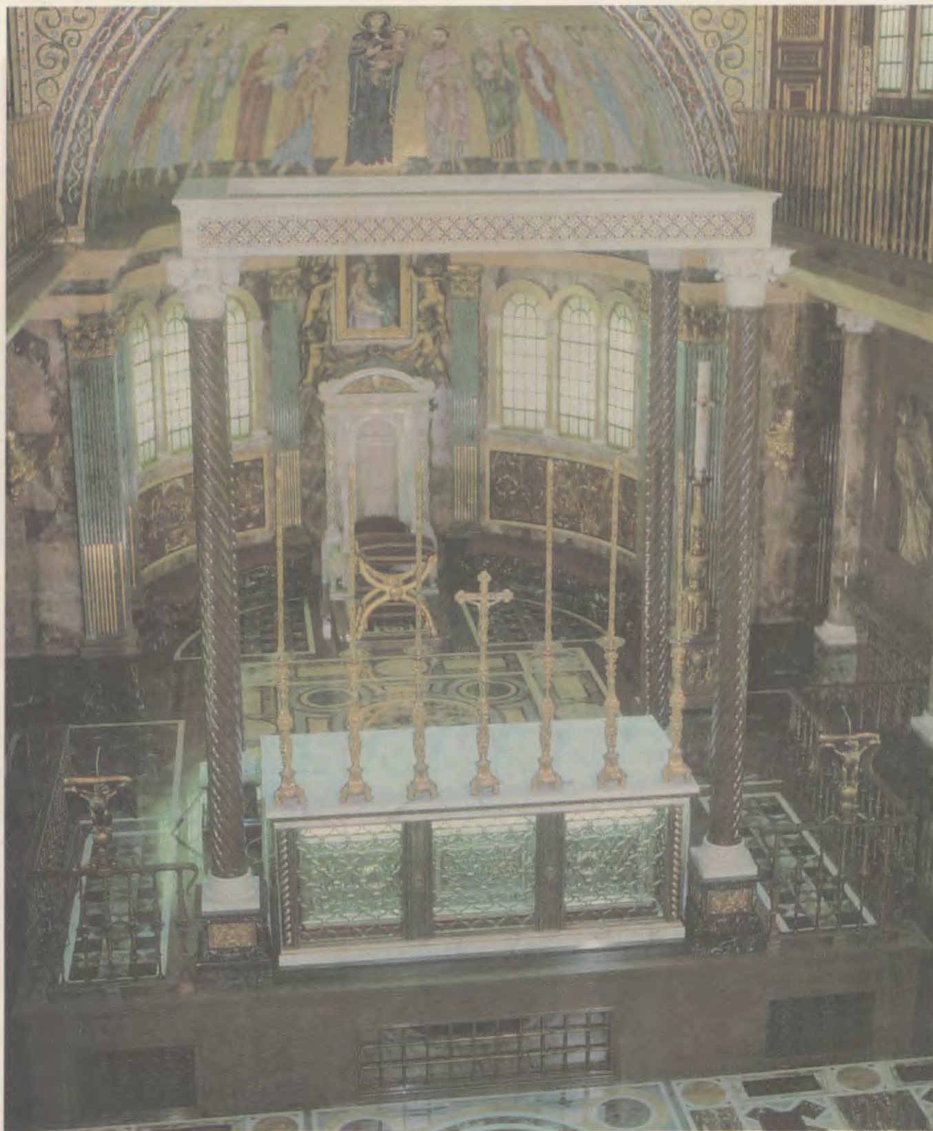
Altar da Igreja Prelática de Santa Maria da Paz, com a urna que contém o sagrado corpo do Bem-aventurado Josemaría Escrivá.

VICE-POSTULAÇÃO DO OPUS DEI NO BRASIL, R. João Cachoeira, 1496, CEP 04535-007, São Paulo, SP.