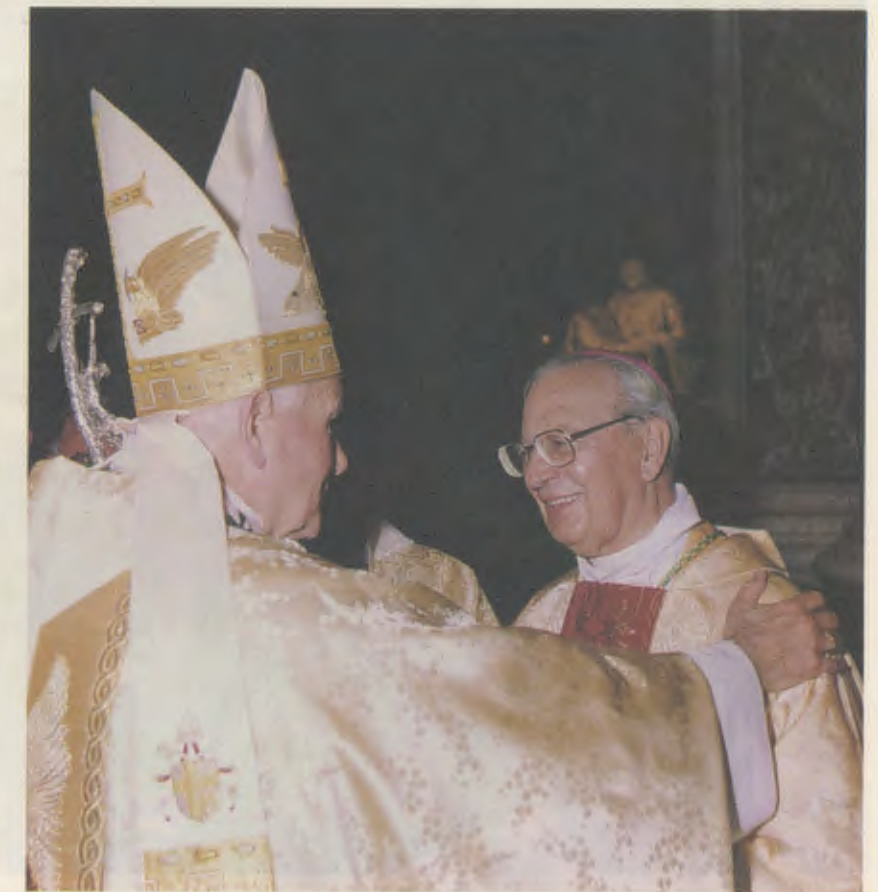
O Papa João Paulo II e o Bispo Prelado do Opus Dei, D. Álvaro del Portillo, no dia 17 de maio de 1992, depois da cerimônia de beatificação.

7. “Um novo mandamento vos dou: que vos ameis uns aos outros; assim como Eu vos amei, vós também deveis amar-vos uns aos outros. Por isto saberão todos que sois meus discípulos: se vos amardes uns aos outros” (Jo 13, 34-35). Com estas palavras de Jesus, conclui-se o Evangelho da Missa de hoje. Nesta frase evangélica encontramos a síntese de toda a santidade ; da santidade que alcançaram por caminhos di-