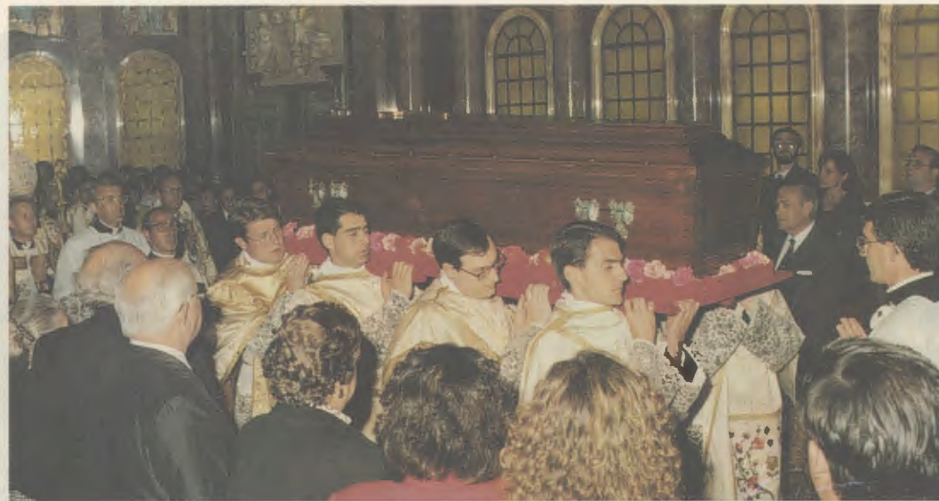
Procissão na Igreja Prelática de Santa Maria da Paz, onde repousam os restos do Bem-aventurado Josemaría Escrivá, no dia 21 de maio de 1992.

cialmente evidente por ocasião da beatificação: pessoas de todas as idades, dos países e das condições sociais mais diversas, apinhavam-se, ordenada e silenciosamente, para agradecer os favores obtidos graças à sua intercessão, e para pedir a sua ajuda nas necessidades espirituais e materiais que sempre acompanham a vida dos homens.