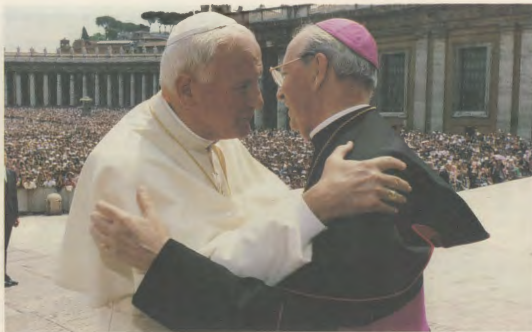
O Santo Padre abraça D. Álvaro del Portillo, antes de começar a audiência do dia 18 de maio de 1992.

petir: A única ambição, o único desejo do Opus Dei e de cada um dos seus filhos é servir a Igreja como a Igreja quer ser servida 1 .