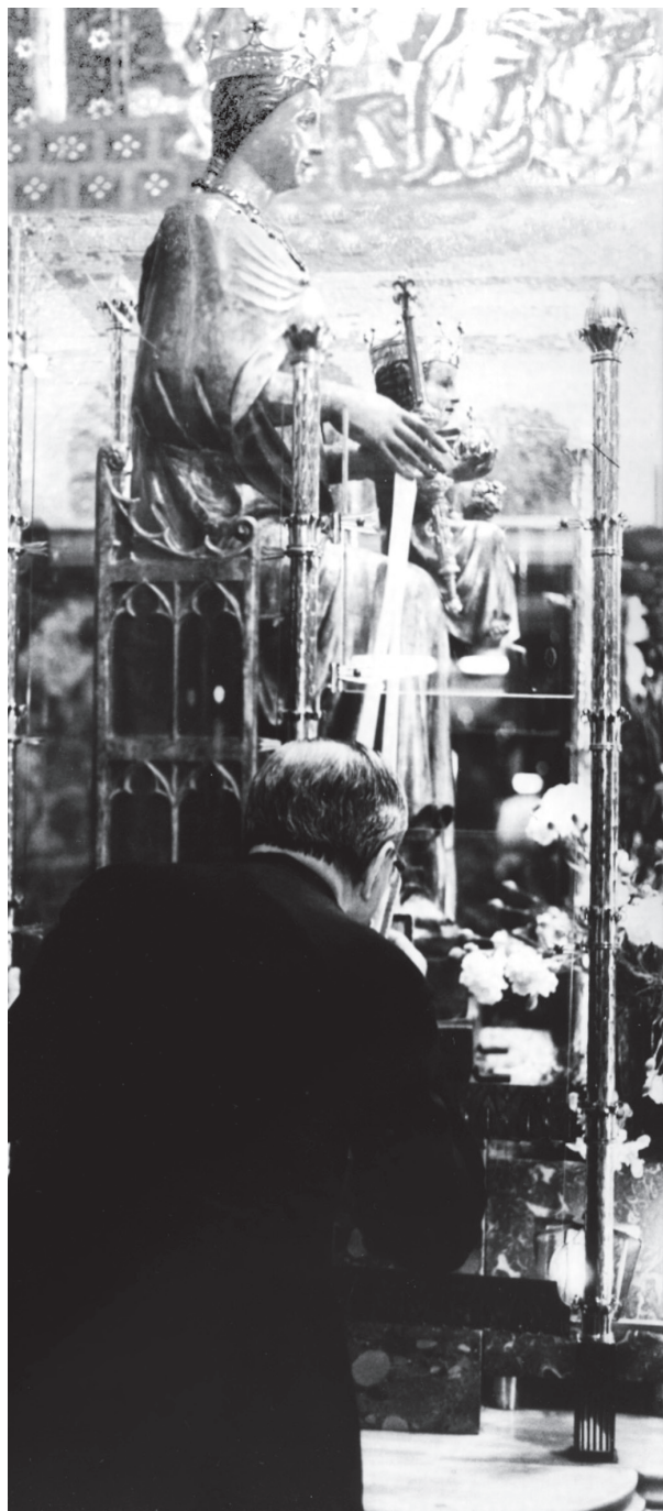
Basílica de la Merced. 21.XI.72