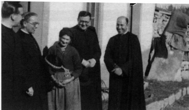
Il beato Josemaría Escrivá a Fatima, il 6 febbraio 1945. La signora alla sua destra è la madre dei beati Francisco y Jacinta Marto, che videro la Madonna insieme a Lucia Dos Santos.

prima lezione che possiamo desumere del sincero amore del beato Josemaría per tutti i Paesi. La seconda lezione non è meno importante: le nazioni, come le persone, sono le loro virtù; non i loro difetti. Questa lezione il fondatore del Opus Dei ce l'aveva data pure nel punto 4 di Cammino : «Non dire: "Sono fatto così..., sono cose del mio carattere". Sono cose della tua mancanza di carattere: sii uomo – "esto vir"». Un difetto è qualcosa che ci manca. Non è qualcosa che appartiene alla nostra personalità: al contrario la sfigura, la insudicia, la nasconde. Ma essa non rimane occulta a Dio, che ci vede sempre con l'amore con cui la madre guarda il proprio figlio. L'amore con cui ci guardava e ci guarda adesso dal Cielo il beato Josemaría. Un uomo è quello che è, non quello che non è, mentre un difetto è un «non essere».